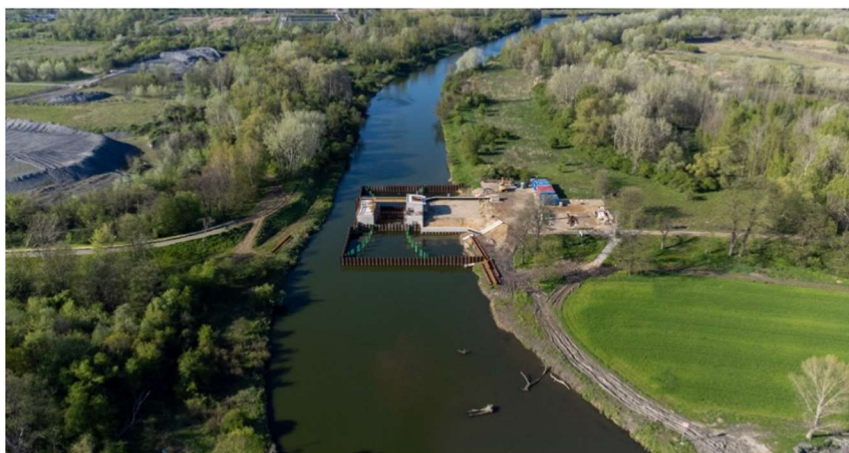
Port Kujawy. Budowa wrot przeciwpowodziowych w portach Płaszów i Kujawy w Krakowie jest jednym z elementów domykających system ochrony Krakowa przed powodzią. Wymiary jednego skrzydła wrot, które są montowane w porcie Płaszów, mają ponad 5 m szerokości i ponad 11 m wysokości, a ciężar jednego skrzydła to ponad 15 ton. W porcie Kujawy, ciężar jednego skrzydła wrot wynosi ponad 10 t, a jego wymiary to przeszło 6 m szerokości i 7 m wysokości Szymon Korta

https://gazet Krakowska.pl/krakow-inwestycje-w-portach-kujawy-i-plaszow-co-sie-tam-dzieje-czy-posluzu-mieszkancom/ar/c1-17778747