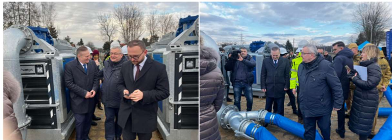
Minister Adamczyk i Prezes Woś na pompowni Lesisko.

- Cieszę się, że tutaj w Krakowie, w Nowej Hucie, mogę powiedzieć: dotrzymujemy słowa! To szczególne miejsce, które przez pokolenia spędzało sen z powiek mieszkańcom, gdy przychodziła duża woda. Rzeka to dla wielu miejscowości szansa na rozwój, ale też zagrożenie. I nie inaczej jest z Wisłą w Krakowie. Dzięki Wodom Polskim i współpracującym z nimi władzom miasta za to, że realizują zadanie, które rząd uznał za priorytetowe - zapewnienie bezpieczeństwa dla obywateli - powiedział Minister Infrastruktury Andrzej Adamczyk.