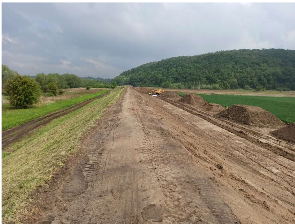
Foto. 20. Zabezpieczenie hałd humusu na Zadaniu 1, stan w trzeciej dekadzie maja 2020 r. (widok w dół rzeki).