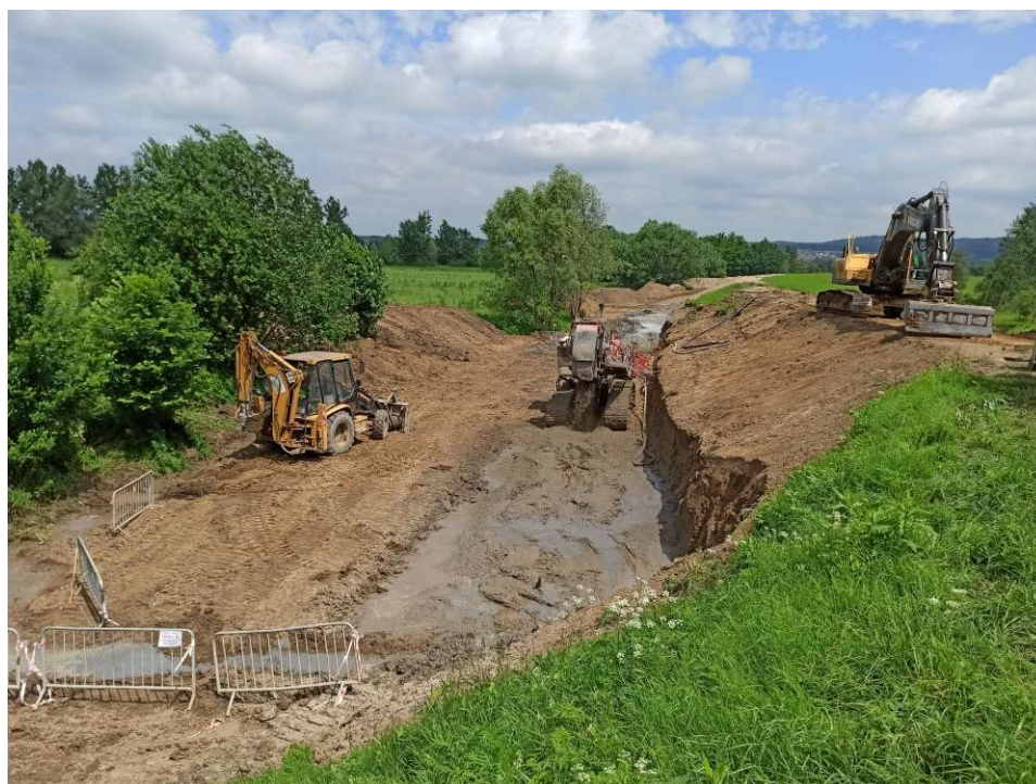
Foto. 27. Budowa przesłony cementowo-bentonitowej na Zadaniu 3, stan w trzeciej dekadzie czerwca 2020 r. (widok w dół rzeki).