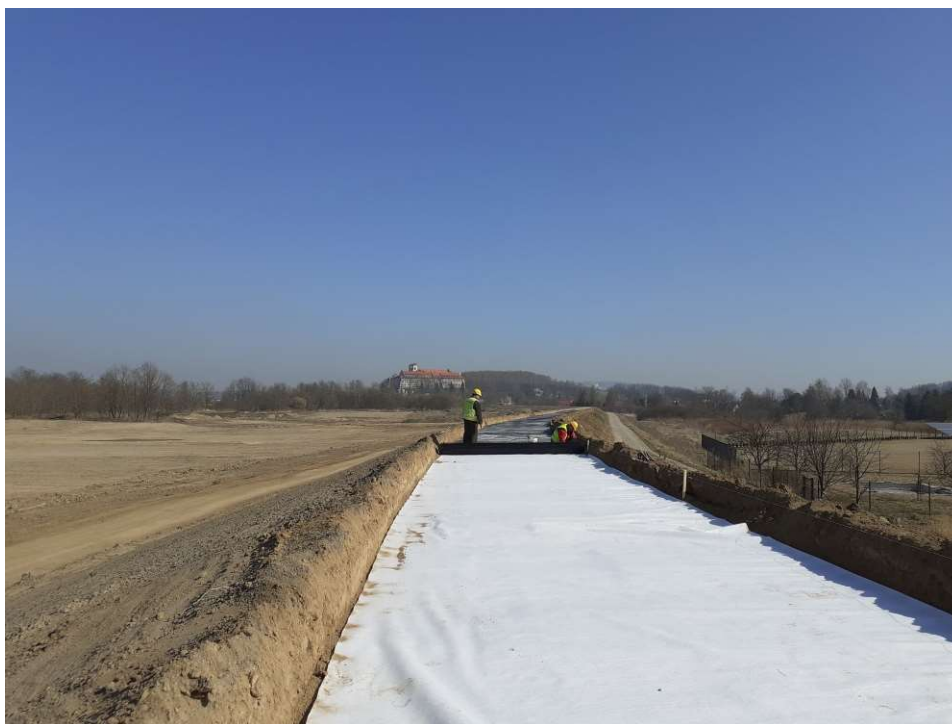
Foto. 34. Budowa drogi na koronie wału przeciwpowodziowego na Zadaniu 2, stan w trzeciej dekadzie marca 2022 r. (widok w dół rzeki).