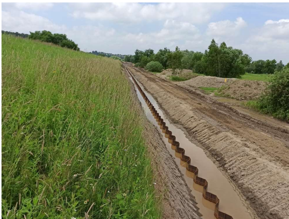
Foto. 25. Budowa przesłony ze ścianki szczelnej na Zadaniu 3, stan w trzeciej dekadzie czerwca 2020 r. (widok w górę rzeki).