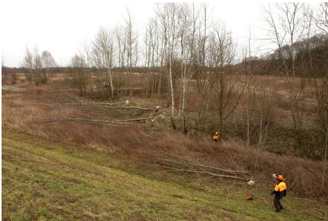
Foto. 9. Wycinka drzew na Zadaniu 3, stan w trzeciej dekadzie lutego 2020 r. (widok w kierunku zawala).