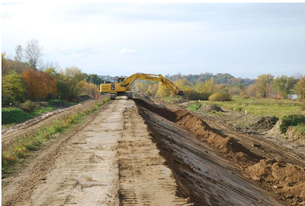
Foto. 29. Formowanie skarp wału przeciwpowodziowego na Zadaniu 3, stan w trzeciej dekadzie września 2020 r. (widok w górę rzeki).