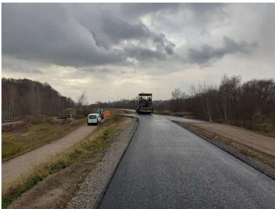
Foto. 35. Budowa drogi na koronie wału przeciwpowodziowego na Zadaniu 3, stan w trzeciej dekadzie listopada 2021 r. (widok w górę rzeki).