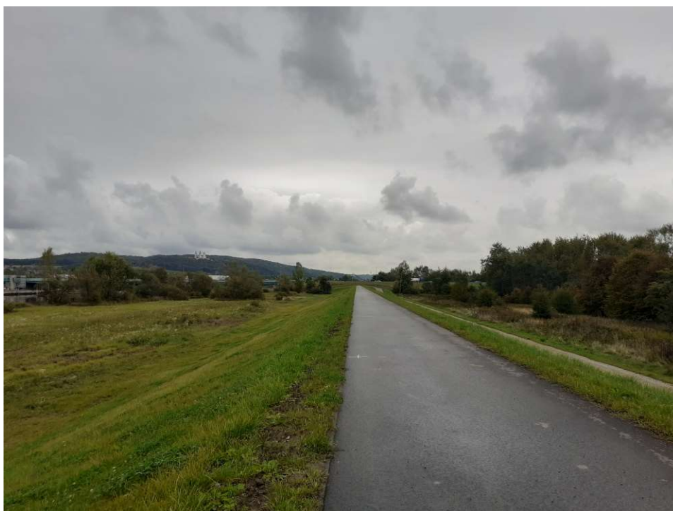
Foto. 43. Stan terenu budowy w ostatnim miesiącu okresu realizacji robót – prawy wał Wisły na Zadaniu 3, stan w trzeciej dekadzie września 2022 r. (widok w dół rzeki).