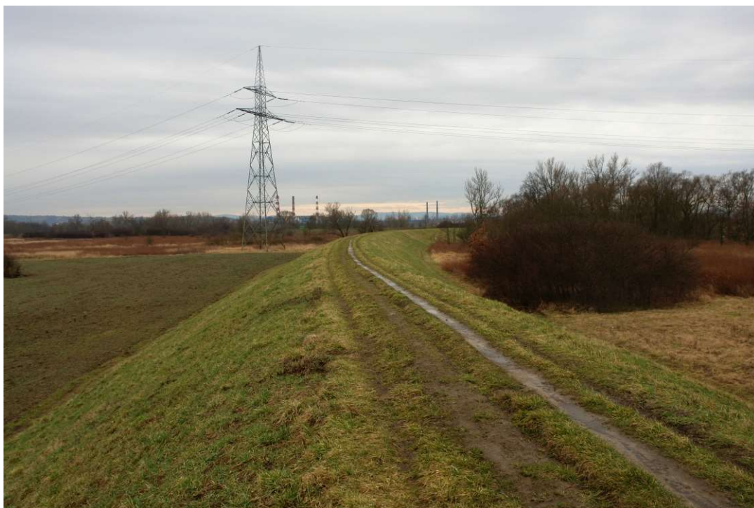
Foto. 1. Stan Terenu Budowy przed rozpoczęciem realizacji robót – prawy wał Wisły planowany do przebudowy na Zadaniu 1, stan w trzeciej dekadzie lutego 2020 r. (widok w górę rzeki).