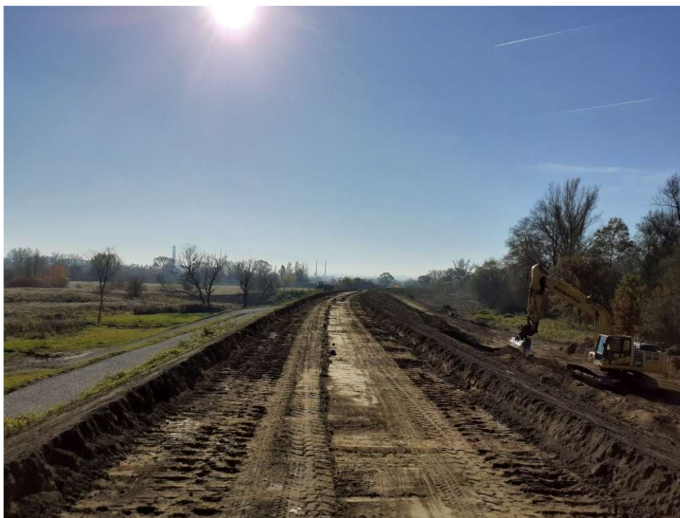
Foto. 32. Humusowanie skarp wału przeciwpowodziowego na Zadaniu 1, stan w trzeciej dekadzie października 2021 r. (widok w górę rzeki).