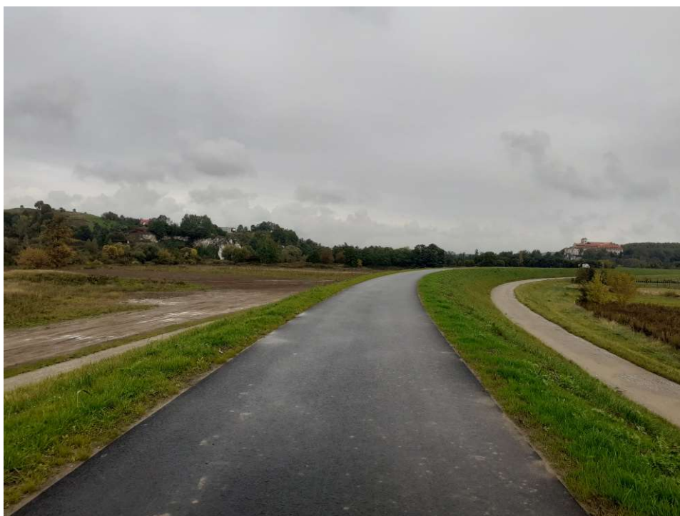
Foto. 41. Stan terenu budowy w ostatnim miesiącu okresu realizacji robót – prawy wał Wisły na Zadaniu 2, stan w trzeciej dekadzie września 2022 r. (widok w dół rzeki).