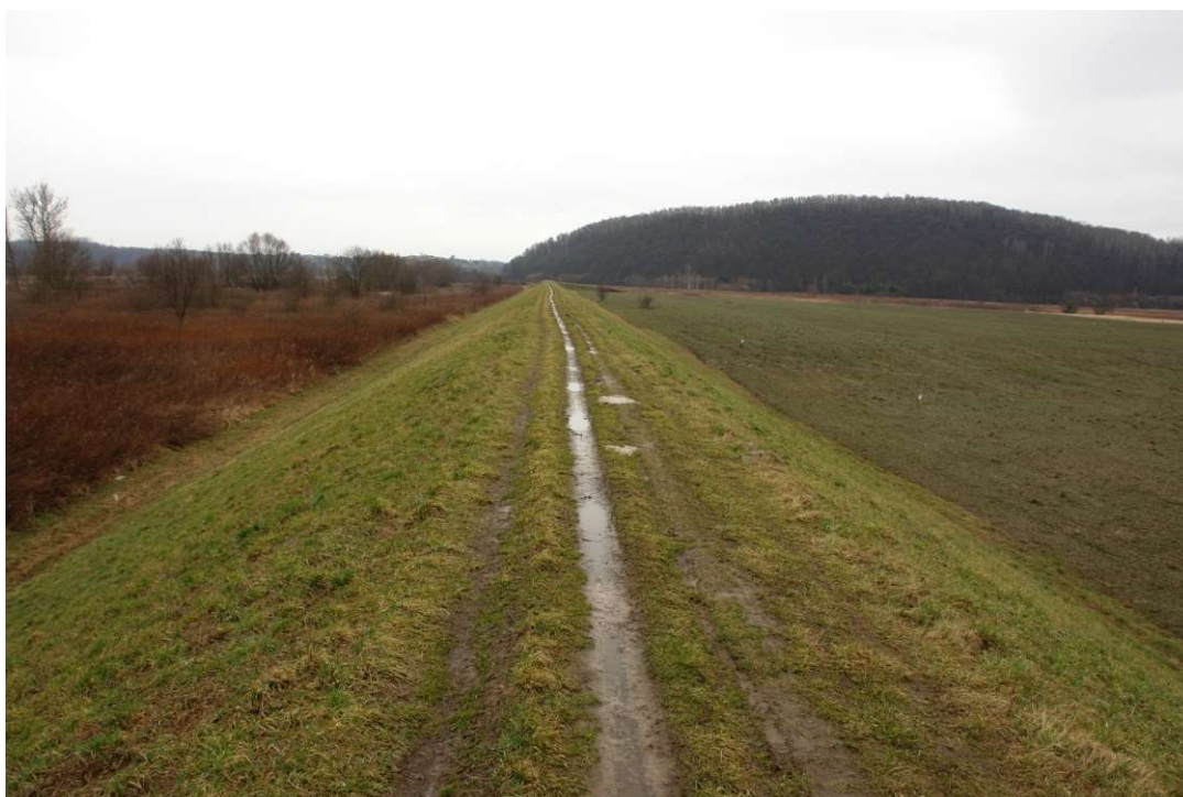
Foto. 2. Stan Terenu Budowy przed rozpoczęciem realizacji robót – prawy wał Wisły planowany do przebudowy na Zadaniu 1, stan w trzeciej dekadzie lutego 2020 r. (widok w dół rzeki).