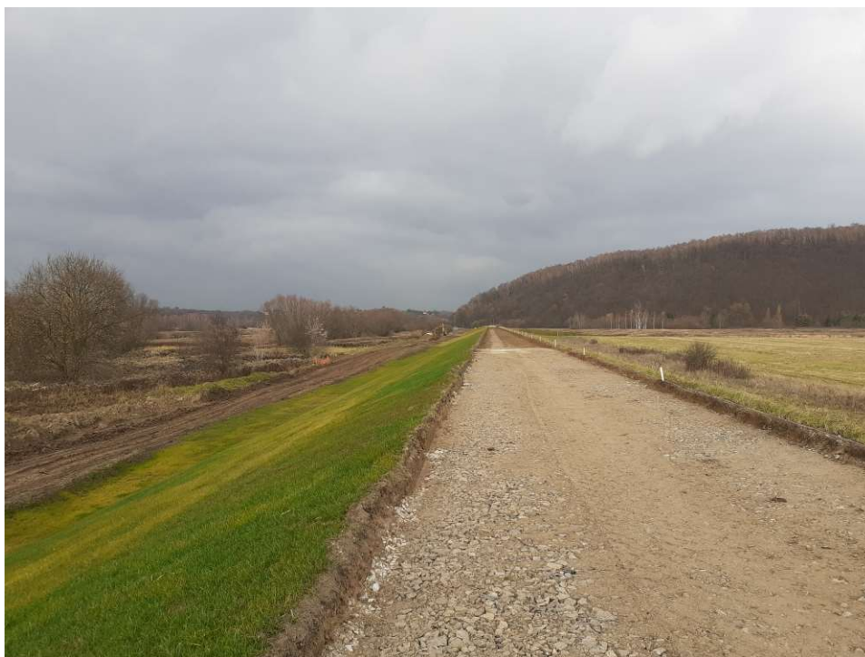
Foto. 36. Porost traw wysianych na skarpie wału przeciwpowodziowego na Zadaniu 1, stan w trzeciej dekadzie listopada 2021 r. (widok w dół rzeki).