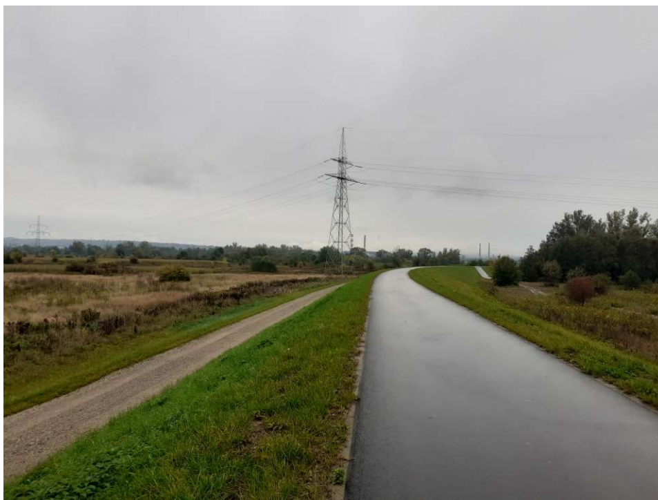
Foto. 38. Stan terenu budowy w ostatnim miesiącu okresu realizacji robót – prawy wał Wisły na Zadaniu 1, stan w trzeciej dekadzie września 2022 r. (widok w górę rzeki).