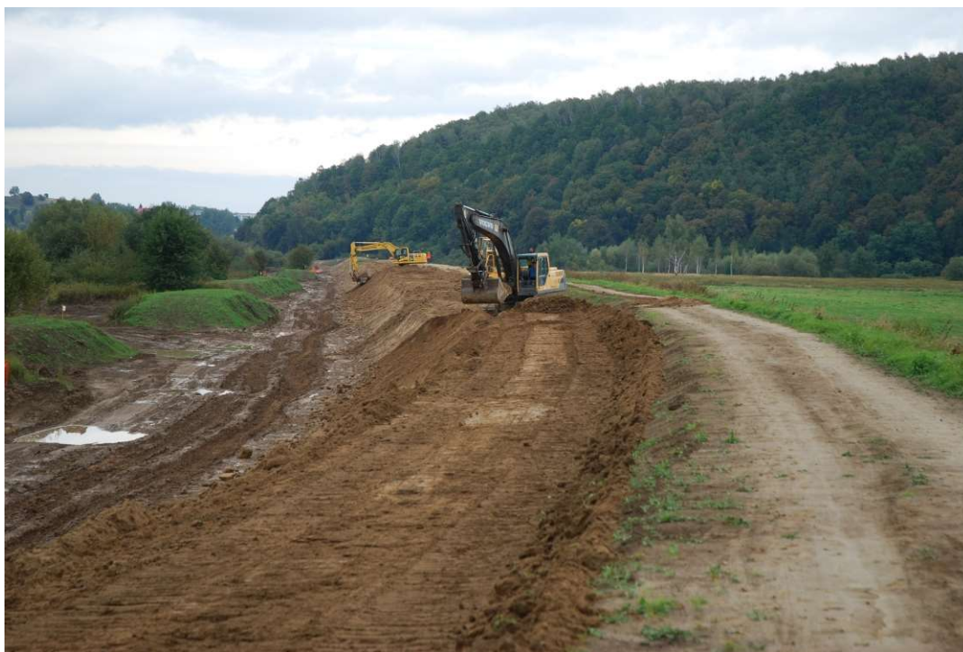
Foto. 28. Formowanie skarp wału przeciwpowodziowego na Zadaniu 1, stan w trzeciej dekadzie września 2020 r. (widok w dół rzeki).