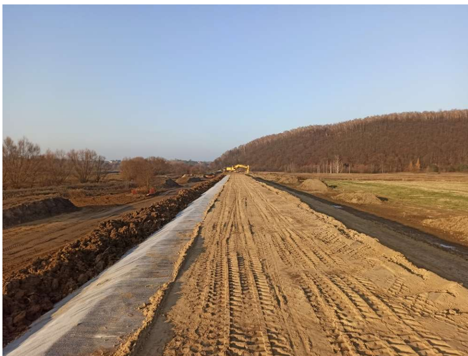
Foto. 31. Układanie bentomaty na skarpie wału przeciwpowodziowego na Zadaniu 1, stan w trzeciej dekadzie listopada 2020 r. (widok w dół rzeki).