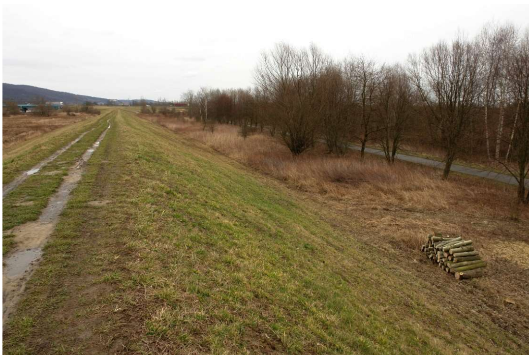
Foto. 8. Stan Terenu Budowy przed rozpoczęciem realizacji robót – prawy wał Wisły planowany do przebudowy na Zadaniu 3, stan w trzeciej dekadzie lutego 2020 r. (widok w dół rzeki).