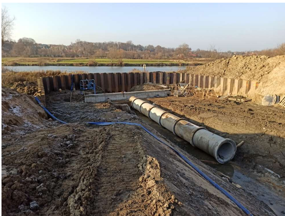
Foto. 23. Przebudowa przepustu wałowego w km 63+115 wału Wisły na Zadaniu 2, stan w trzeciej dekadzie listopada 2020 r. (widok w kierunku międzywala).