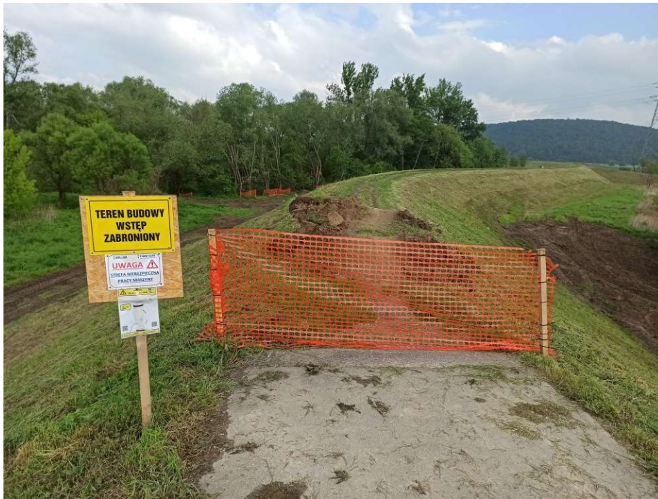
Foto. 11. Oznakowanie terenu budowy na Zadaniu 1, stan w trzeciej dekadzie maja 2020 r. (widok w dół rzeki).