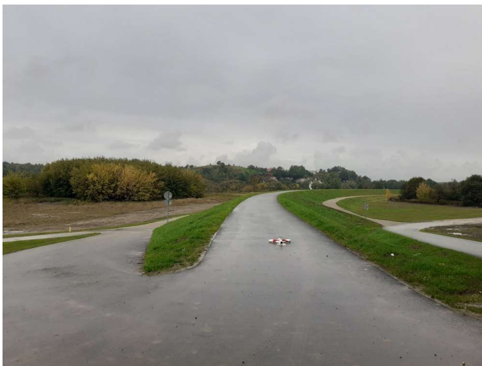
Foto. 45. Zrekultywowany teren byłego zaplecza budowy (po zakończeniu zajęcia czasowego) na prawobrzeżnym zawału Wisły na wysokości Zadania 2, stan w trzeciej dekadzie września 2022 r. (widok w dół rzeki).