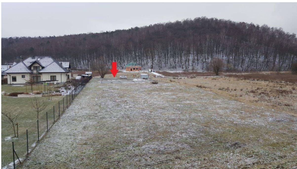
Foto. 4. Stan Terenu Budowy przed rozpoczęciem realizacji robót – fundamenty zlokalizowane na nieruchomości gruntowej nr 197/6 (przed podziałem 197/1).