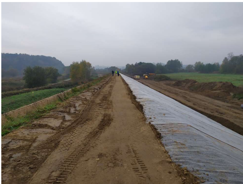
Foto. 30. Układanie bentomaty na skarpie wału przeciwpowodziowego na Zadaniu 3, stan w trzeciej dekadzie października 2020 r. (widok w górę rzeki).