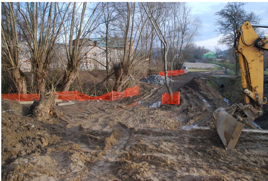
Foto. 16. Zabezpieczenie drzew i krzewów nie planowanych do wycinki na Zadaniu 2, stan w trzeciej dekadzie grudnia 2020 r. (widok w kierunku zawala).