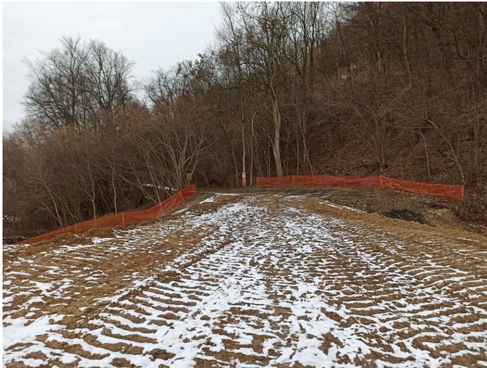
Foto. 15. Zabezpieczenie drzew i krzewów nie planowanych do wycinki na Zadaniu 1, stan w trzeciej dekadzie stycznia 2021 r. (widok w dół rzeki).