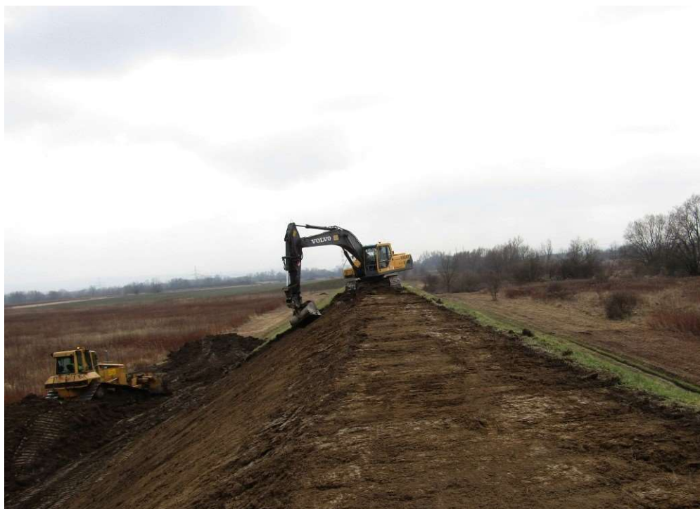
Foto. 18. Zdejmowanie warstwy humusu na Zadaniu 1, stan w trzeciej dekadzie lutego 2020 r. (widok w górę rzeki).