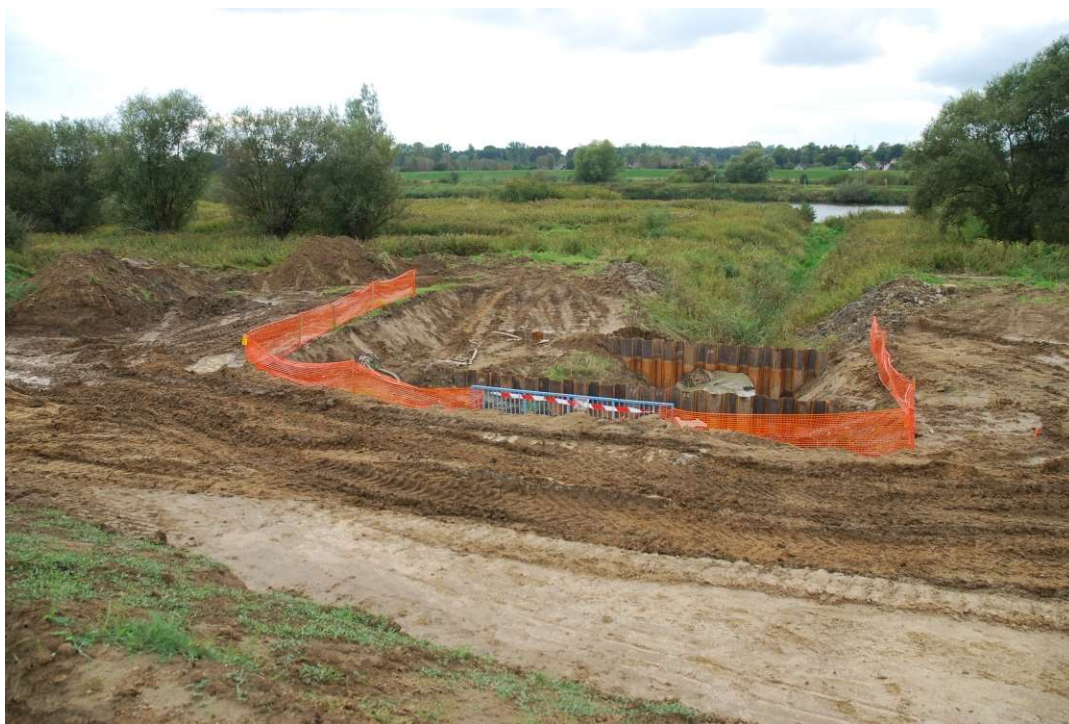
Foto. 13. Zabezpieczenie miejsc niebezpiecznych na Zadaniu 1, stan w trzeciej dekadzie września 2020 r. (widok w kierunku międzywala).