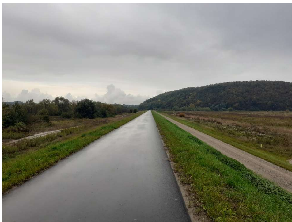
Foto. 39. Stan terenu budowy w ostatnim miesiącu okresu realizacji robót – prawy wał Wisły na Zadaniu 1, stan w trzeciej dekadzie września 2022 r. (widok w dół rzeki).