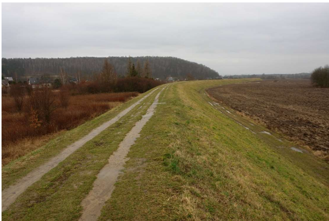
Foto. 5. Stan Terenu Budowy przed rozpoczęciem realizacji robót – prawy wał Wisły planowany do przebudowy na Zadaniu 2, stan w trzeciej dekadzie lutego 2020 r. (widok w górę rzeki).