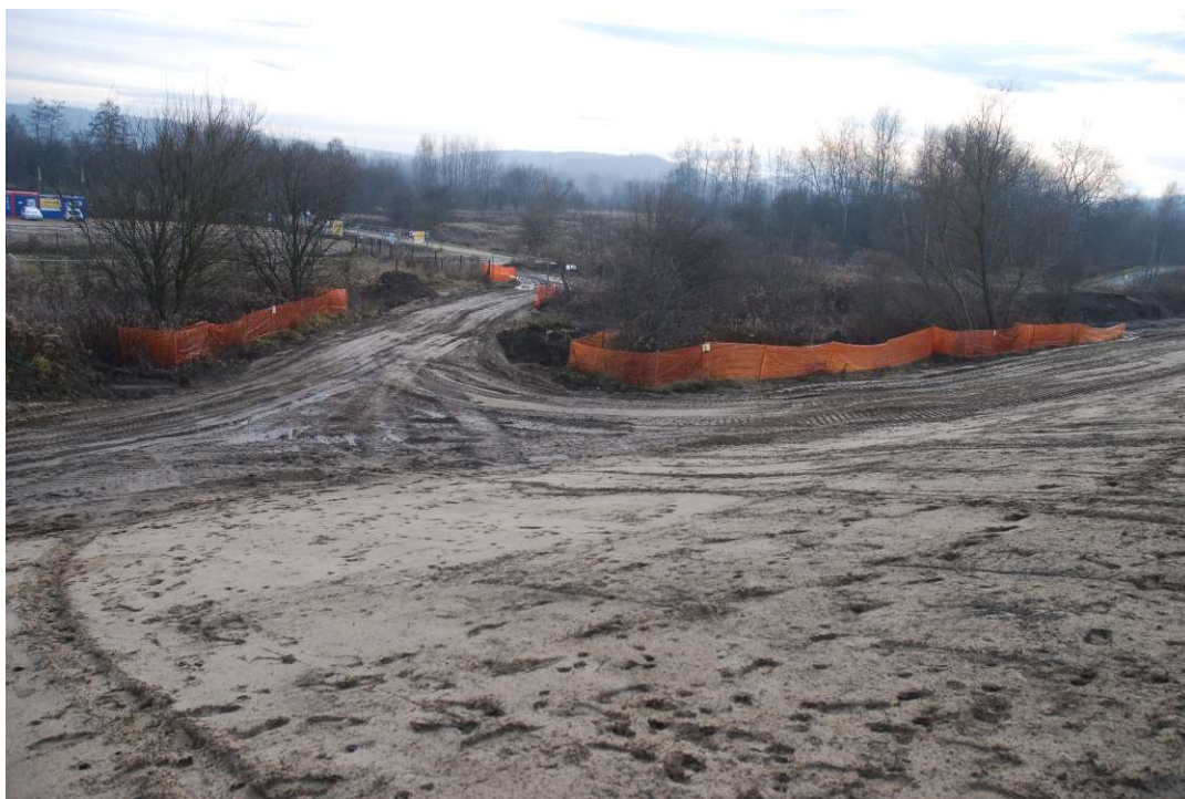
Foto. 17. Zabezpieczenie drzew i krzewów nie planowanych do wycinki na Zadaniu 3, stan w trzeciej dekadzie grudnia 2020 r. (widok w kierunku zawala).