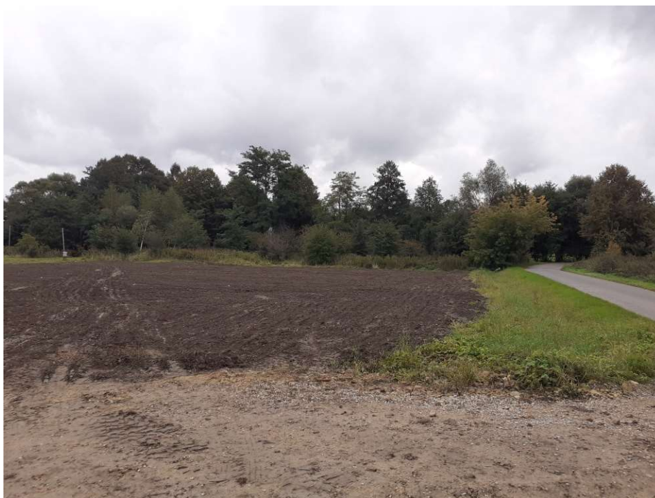
Foto. 44. Zrekultywowany teren byłego zaplecza budowy (po zakończeniu zajęcia czasowego) na prawobrzeżnym zawału Wisły na wysokości Zadania 3, stan w trzeciej dekadzie września 2022 r. (widok w kierunku południowym).