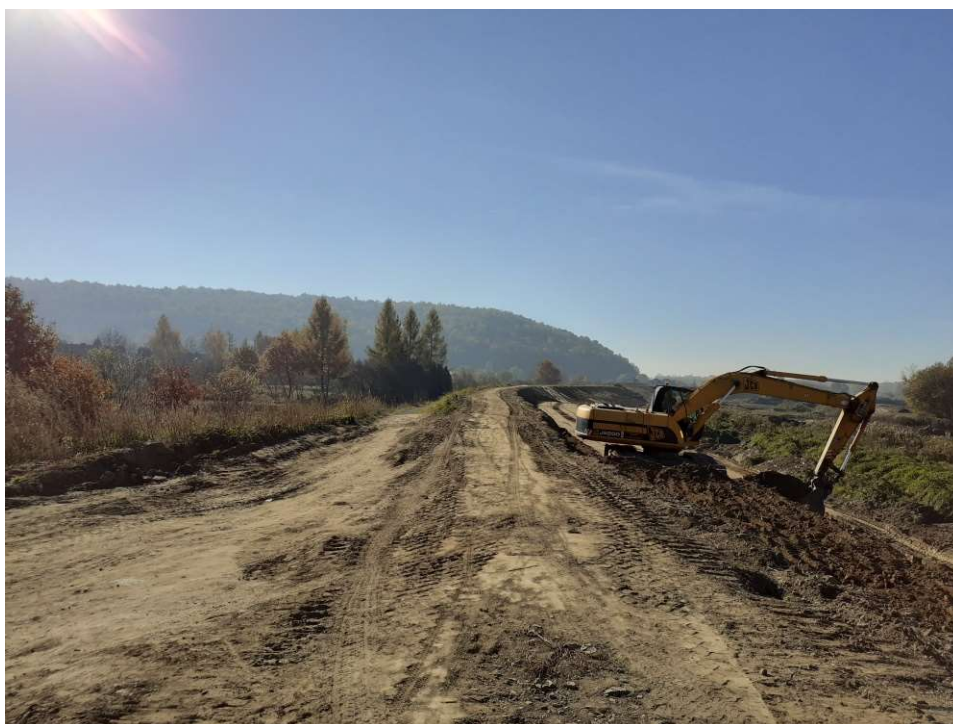
Foto. 33. Humusowanie skarp wału przeciwpowodziowego na Zadaniu 2, stan w trzeciej dekadzie października 2021 r. (widok w górę rzeki).