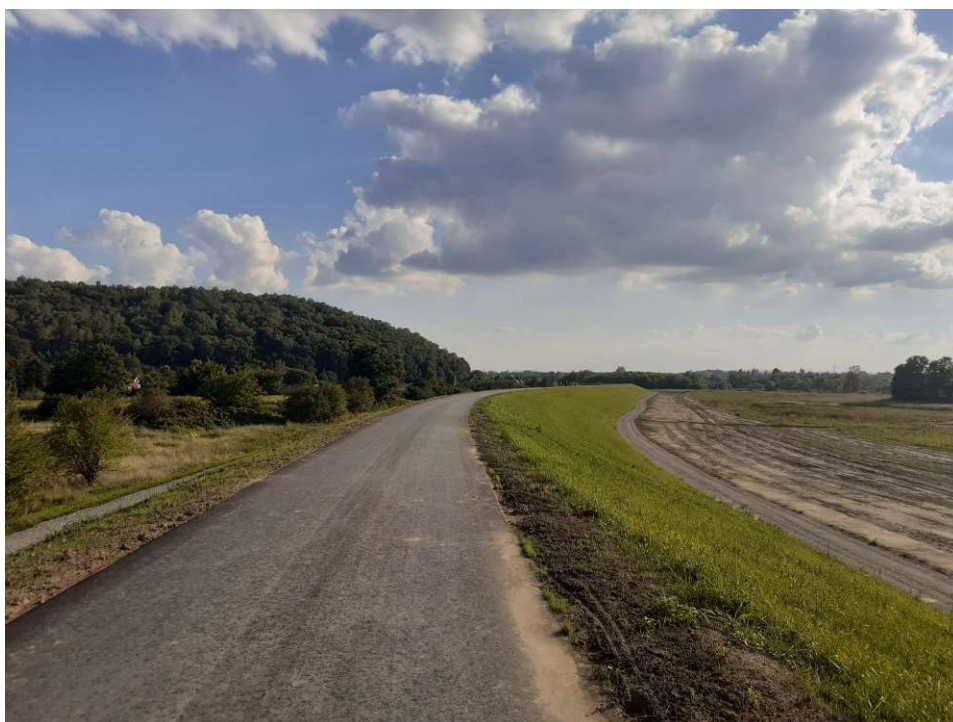
Foto. 37. Porost traw wysianych na skarpie wału przeciwpowodziowego na Zadaniu 2, stan w trzeciej dekadzie sierpnia 2022 r. (widok w górę rzeki).