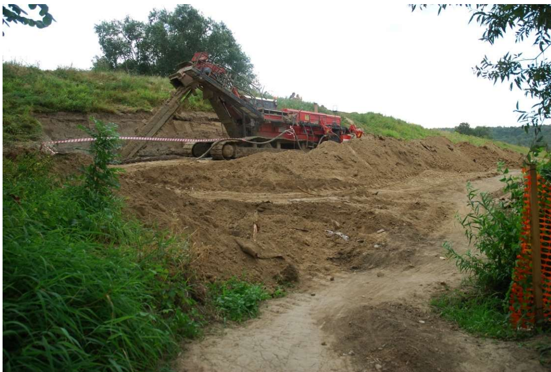
Foto. 26. Budowa przesłony cementowo-bentonitowej na Zadaniu 2, stan w trzeciej dekadzie sierpnia 2020 r. (widok w górę rzeki).