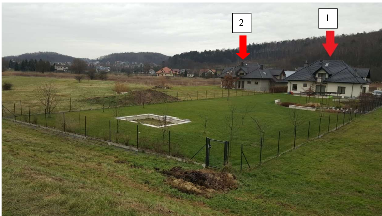
Foto. 3. Stan Terenu Budowy przed rozpoczęciem realizacji robót – gospodarstwo domowe zlokalizowane przy ul. Walgierza Wdalego 58 (1) oraz nieruchomość gruntowa zabudowana nr 197/12 (2).