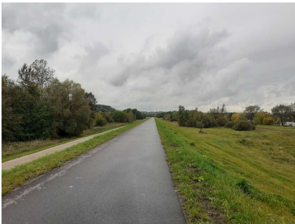
Foto. 42. Stan terenu budowy w ostatnim miesiącu okresu realizacji robót – prawy wał Wisły na Zadaniu 3, stan w trzeciej dekadzie września 2022 r. (widok w górę rzeki).