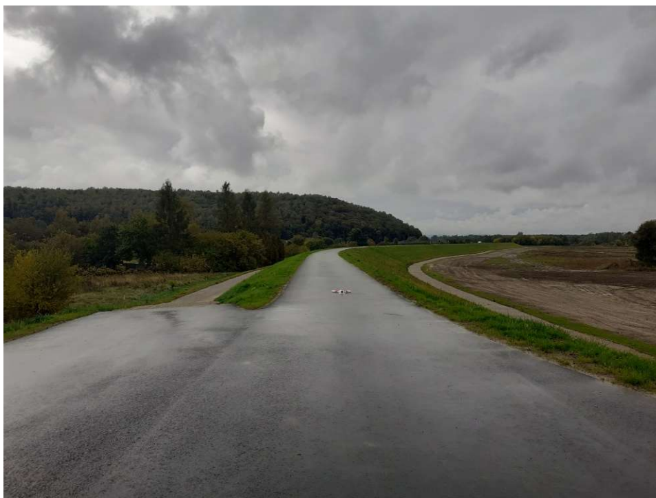
Foto. 40. Stan terenu budowy w ostatnim miesiącu okresu realizacji robót – prawy wał Wisły na Zadaniu 2, stan w trzeciej dekadzie września 2022 r. (widok w górę rzeki).