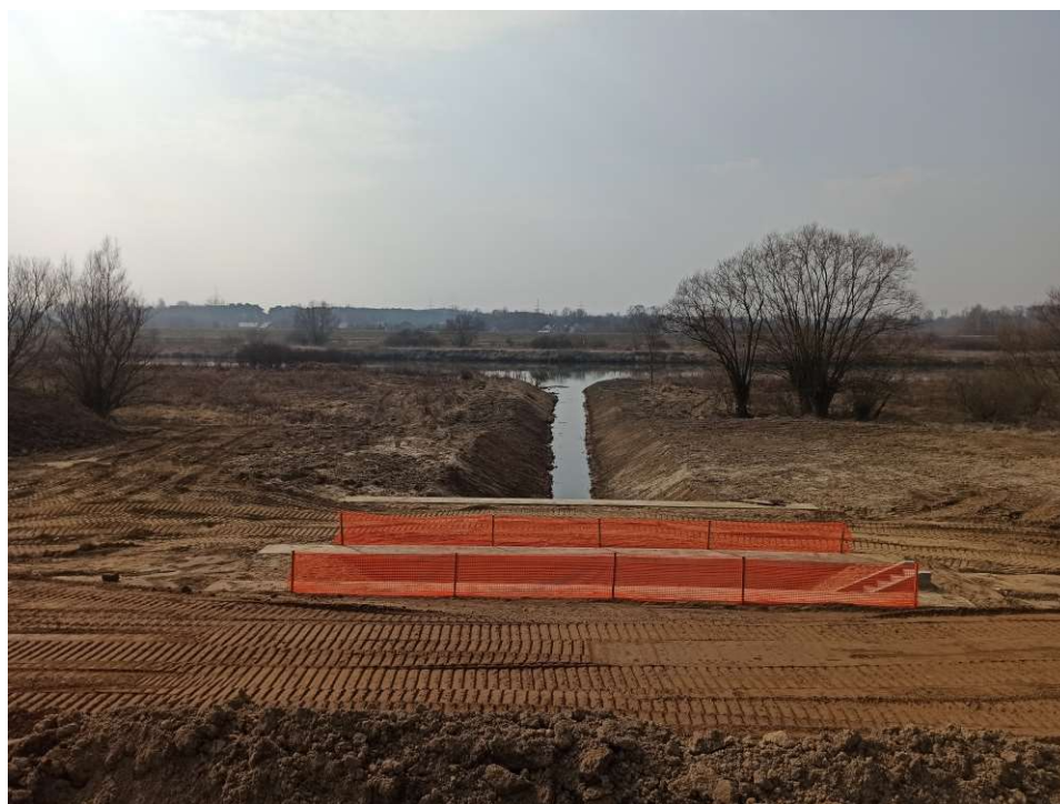
Foto. 14. Zabezpieczenie miejsc niebezpiecznych na Zadaniu 1, stan w trzeciej dekadzie marca 2021 r. (widok w kierunku międzywala).