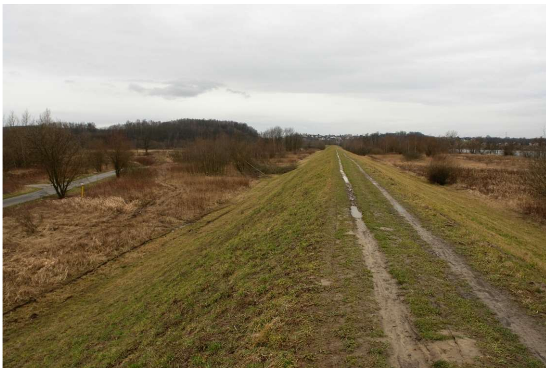
Foto. 7. Stan Terenu Budowy przed rozpoczęciem realizacji robót – prawy wał Wisły planowany do przebudowy na Zadaniu 3, stan w trzeciej dekadzie lutego 2020 r. (widok w górę rzeki).