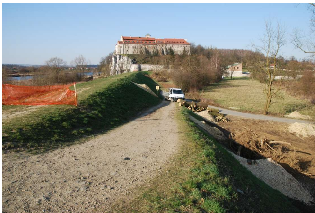
Foto. 10. Porządkowanie terenu po wycince drzew na Zadaniu 2, stan w trzeciej dekadzie marca 2020 r. (widok w dół rzeki).