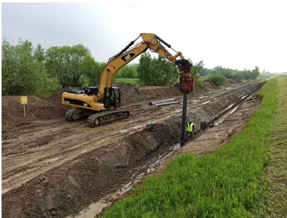
Foto. 24. Budowa przesłony ze ścianki szczelnej na Zadaniu 3, stan w trzeciej dekadzie maja 2020 r. (widok w dół rzeki).