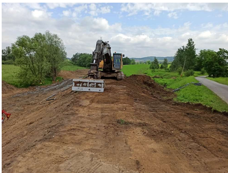
Foto. 19. Zdejmowanie warstwy humusu na Zadaniu 3, stan w trzeciej dekadzie czerwca 2020 r. (widok w dół rzeki).