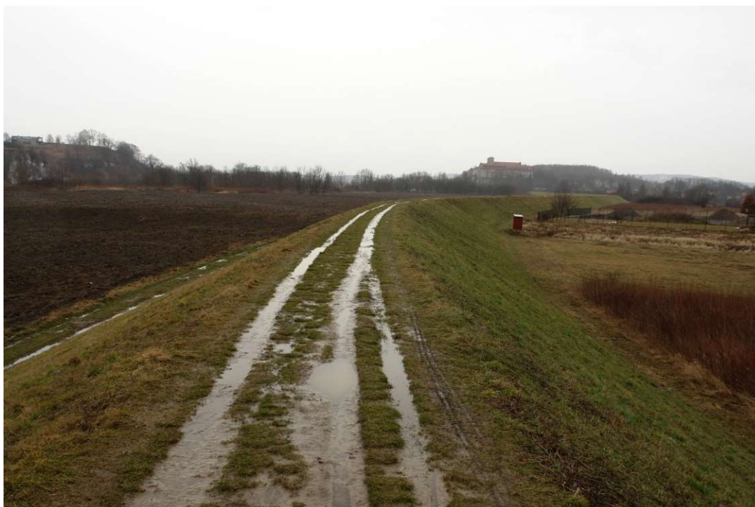
Foto. 6. Stan Terenu Budowy przed rozpoczęciem realizacji robót – prawy wał Wisły planowany do przebudowy na Zadaniu 2, stan w trzeciej dekadzie lutego 2020 r. (widok w dół rzeki).