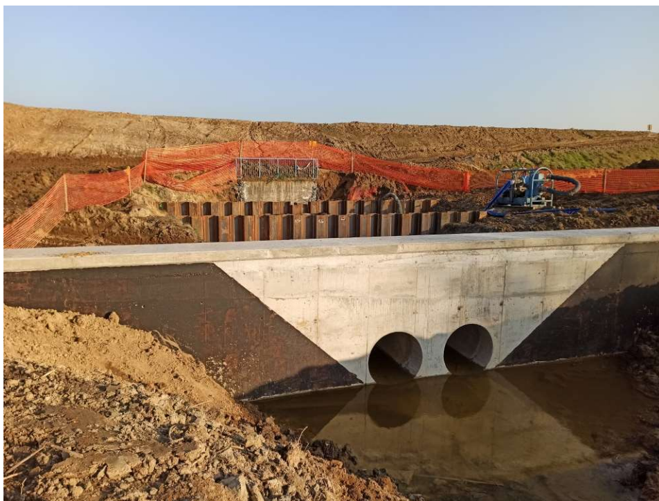
Foto. 22. Przebudowa przepustu wałowego w km 61+239 wału Wisły na Zadaniu 1, stan w trzeciej dekadzie listopada 2020 r. (widok od strony międzywala).