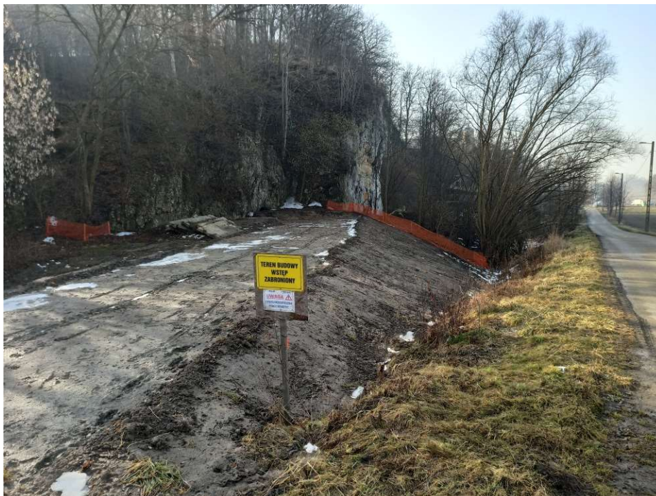
Foto. 12. Oznakowanie terenu budowy na Zadaniu 3, stan w trzeciej dekadzie lutego 2021 r. (widok w górę rzeki).