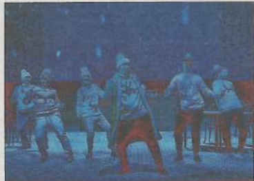
Twórcy spektaklu „Salto w tył” odbiorą Nagrodę im. Wyspiańskiego