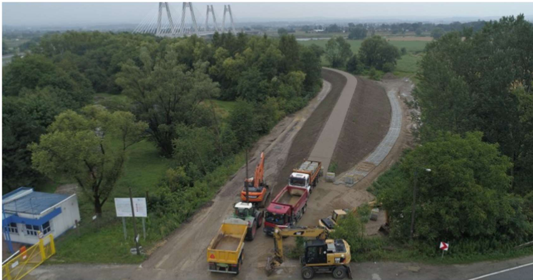
Rozbudowa wałów w okolicy ul. Longinusa Podbięty Marcin Banasik