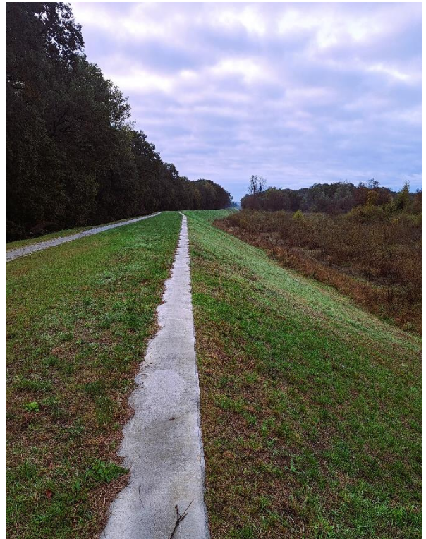
Fot. 4 Rozbudowany wał istniejący