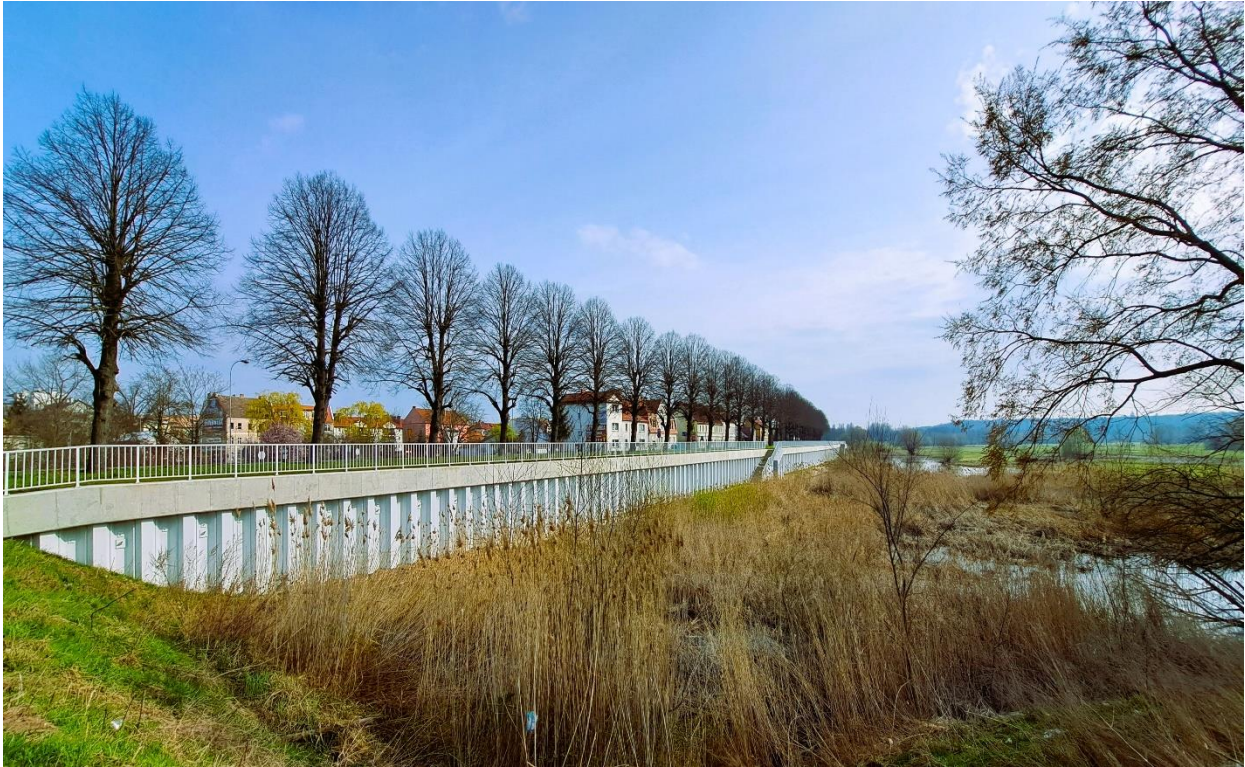
Fot. 3 Rozbudowany wał istniejący