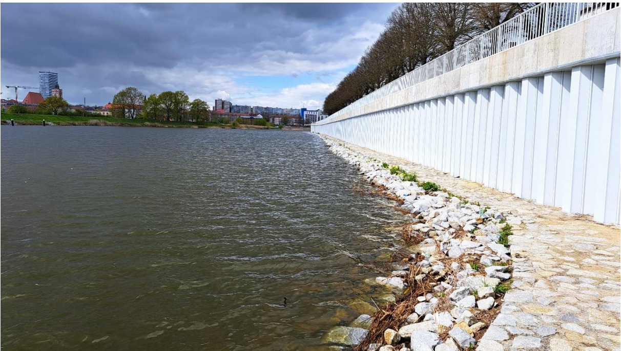
Fot. 2 Rozbudowany wał istniejący