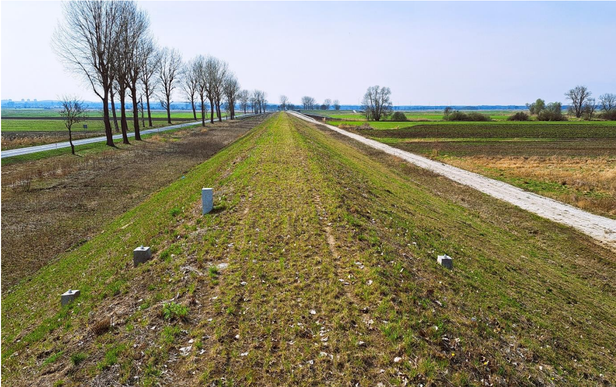
Fot. 5 Nowo wybudowany wał okrężny