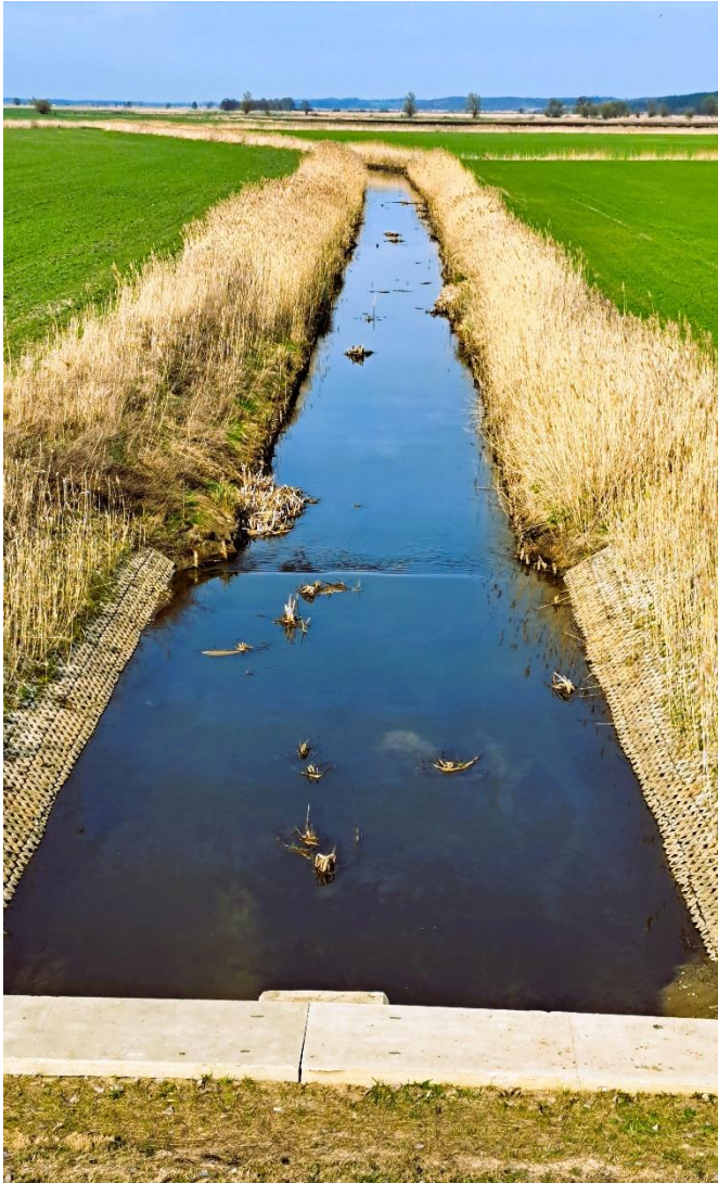
Fot. 7 Odbudowany kanał Raczej Strugi