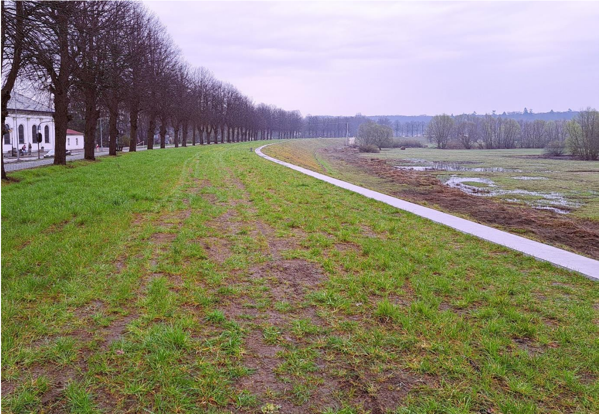
Fot. 1 Rozbudowany wał istniejący