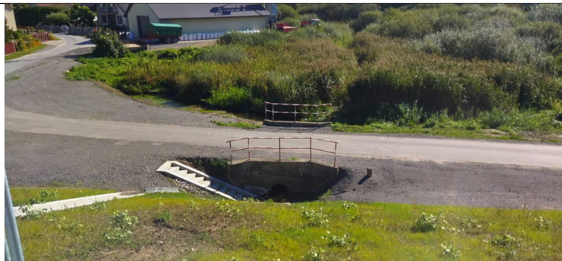
Zdjęcie nr 16: Przepust pod ul. Podwale .