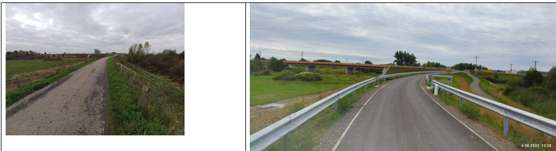
Zdjęcie nr 5: Przepust, zasuwa na cieku wodnym przebiegającym przez wał, w tle widok na most nad rz. Łęg, DK 77 (ul. Sandomierska)