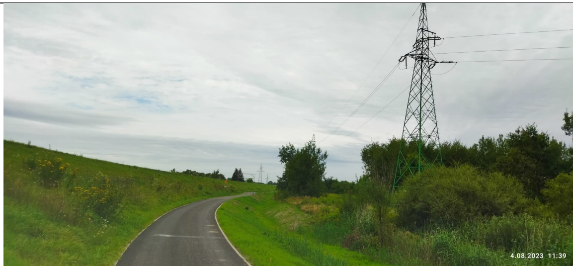
Zdjęcie nr 13: Wał, droga, słupy sieci WN i SN do przebudowy.