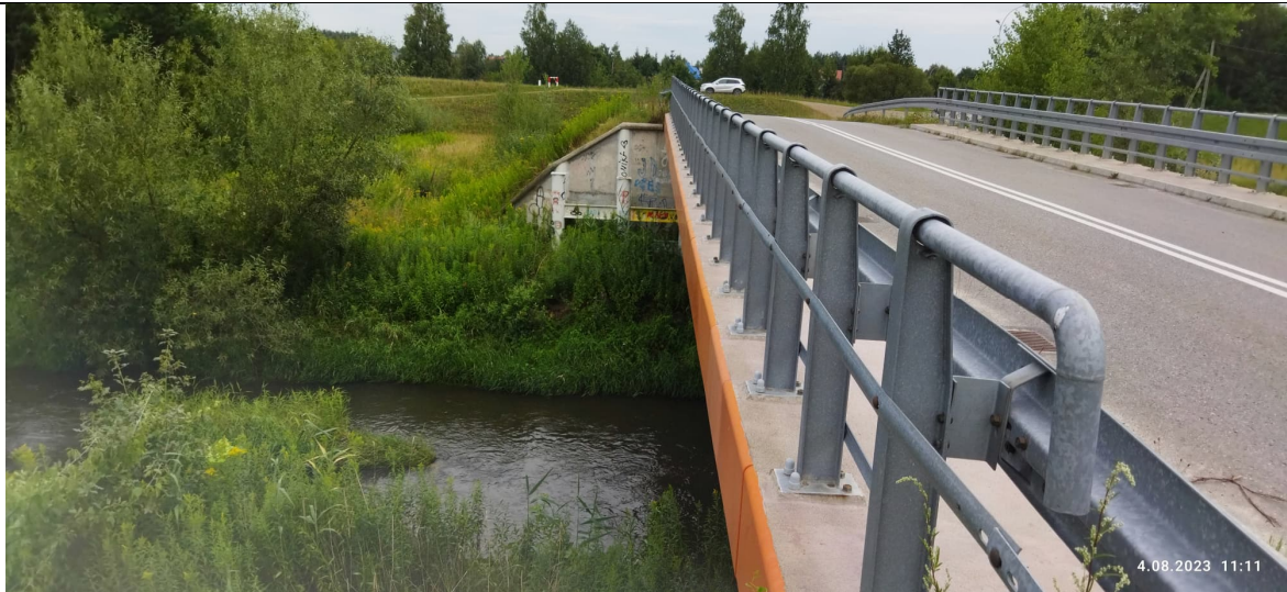
Zdjęcie nr 1: Most nad rz. Łęg, dr. Orlińska – Gorzyce.