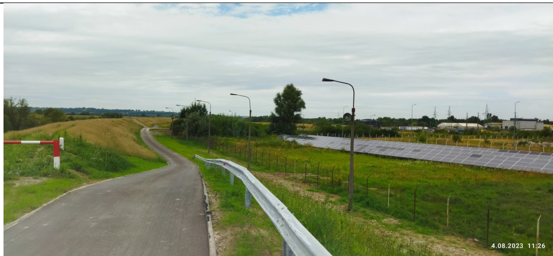
Zdjęcie nr 9: Zjazd drogi asfaltowej z wałów, w oddali ferma fotowoltaiki.