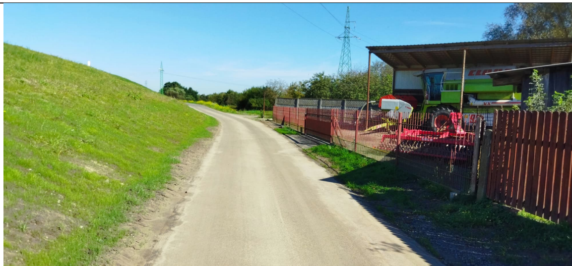
Zdjęcie nr 19: Droga przy wale prawym, ogrodzenia do przebudowy, w oddali słup sieci WN.