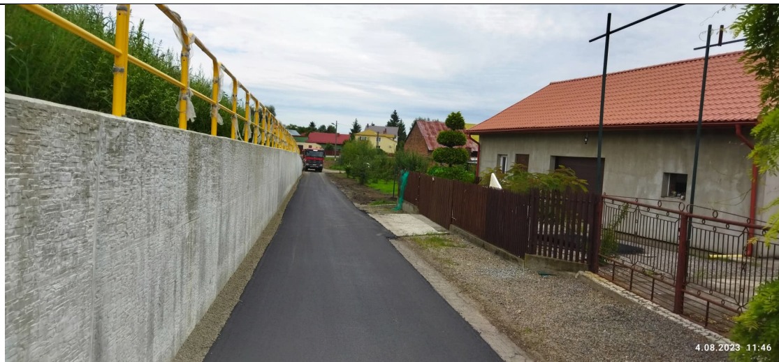
Zdjęcie nr 15: ul. Podwale.