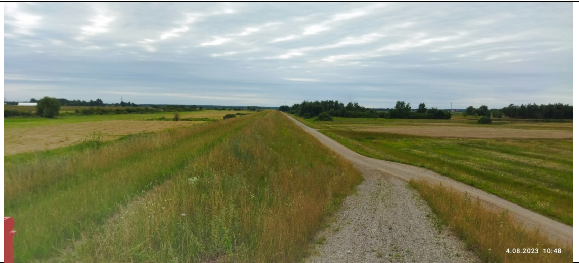
Zdjęcie nr 8: Wody powierzchniowe w międzywale, wał, droga przy wale od strony odpowietrznej.