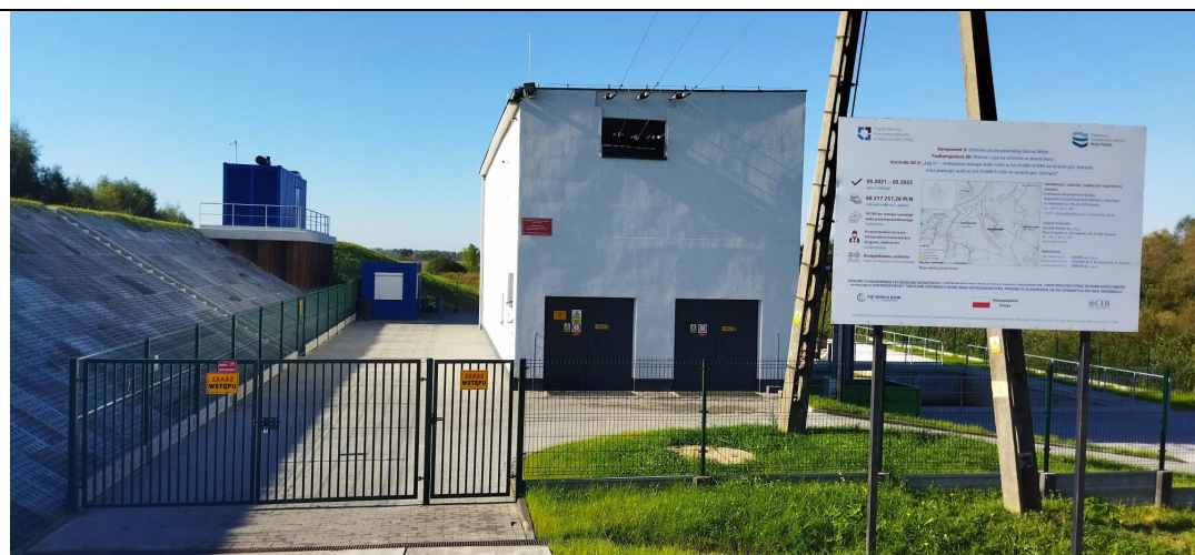
Zdjęcie nr 6: Przepompownia PGW WP, ciek Strug.