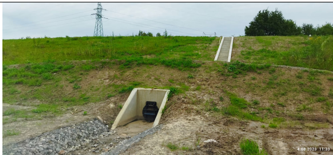
Zdjęcie nr 12: Przepust od strony międzywala, zaszuwa, w oddali linia WN do przebudowy.