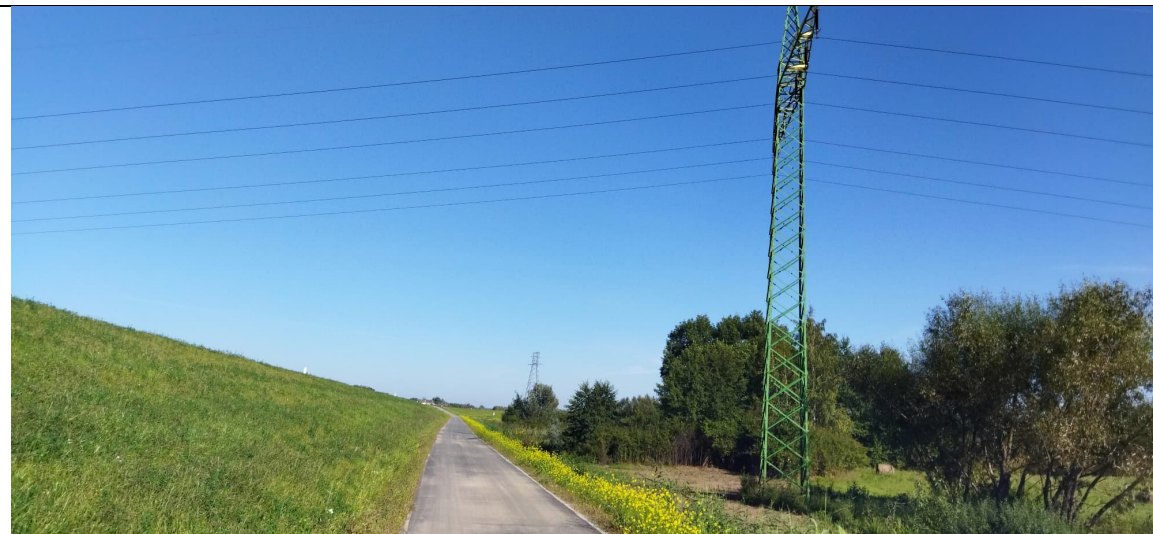
Zdjęcie nr 20: Wał prawy, droga przy wale, słup linii WN przechodzącej przez międzywale rzeki Łęg.