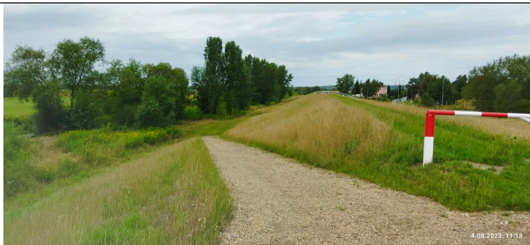
Zdjęcie nr 4: Wzmocnienie przejścia w poprzek przez wał.