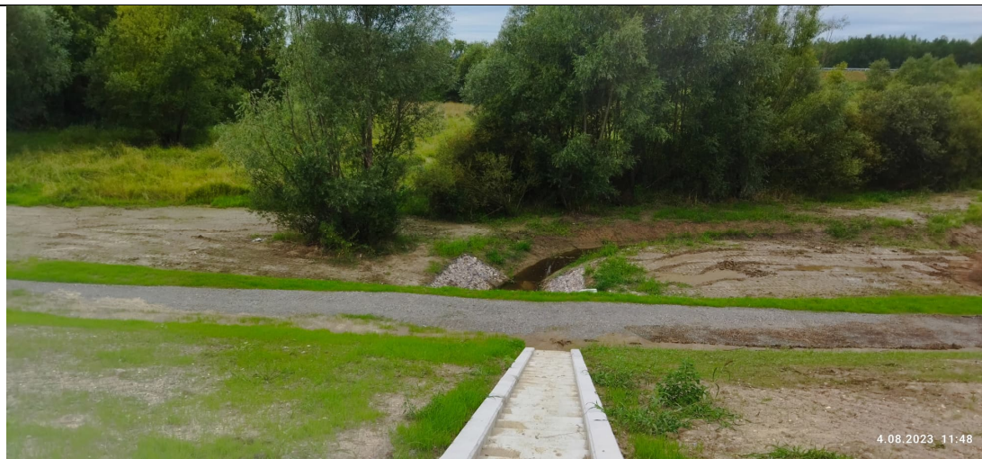
Zdjęcie nr 17: Odpływ z przepustu od strony międzywala ( ul. Podwale).