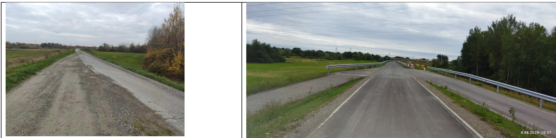
Zdjęcie nr 4: Skrzyżowanie – dr. szutrowa i dr. asfaltowa, przebiegające górą wałów.