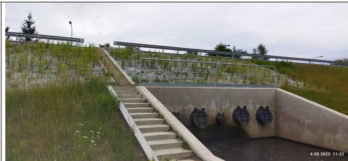
Zdjęcie nr 8: Wylot wód opadowych, w oddali budynek oczyszczalni.