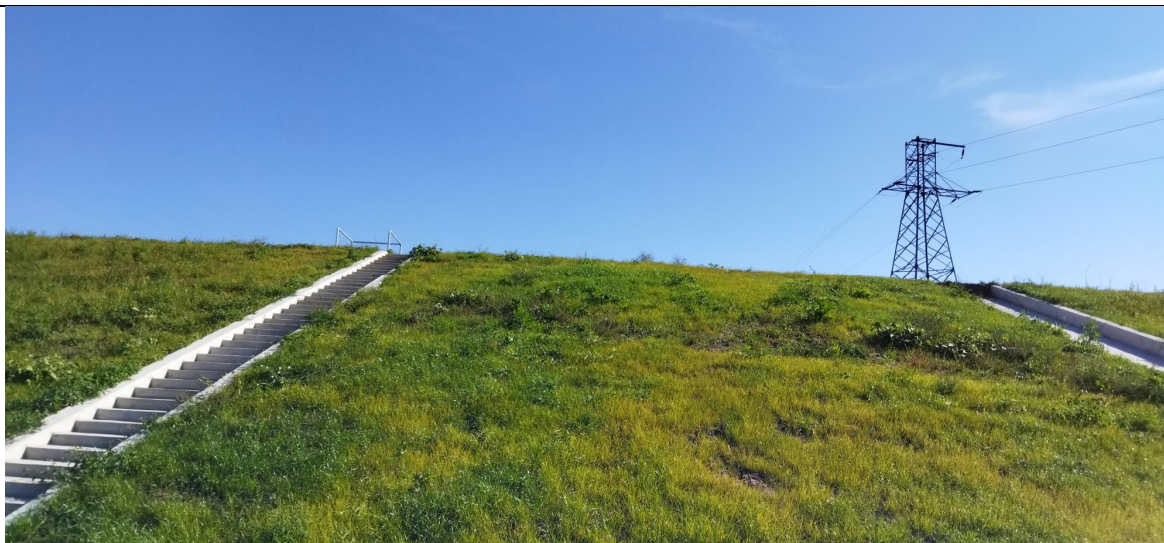
Zdjęcie nr 21: Przepust przez wał, zasuwa, linia WN.