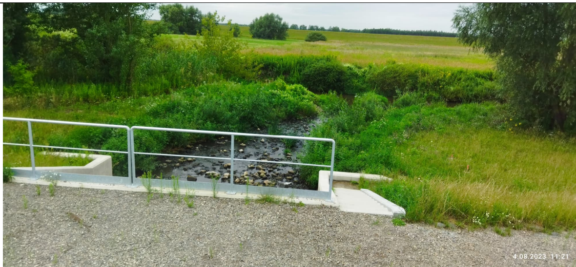
Zdjęcie nr 7: Odpływ wód z oczyszczalni, mostek.