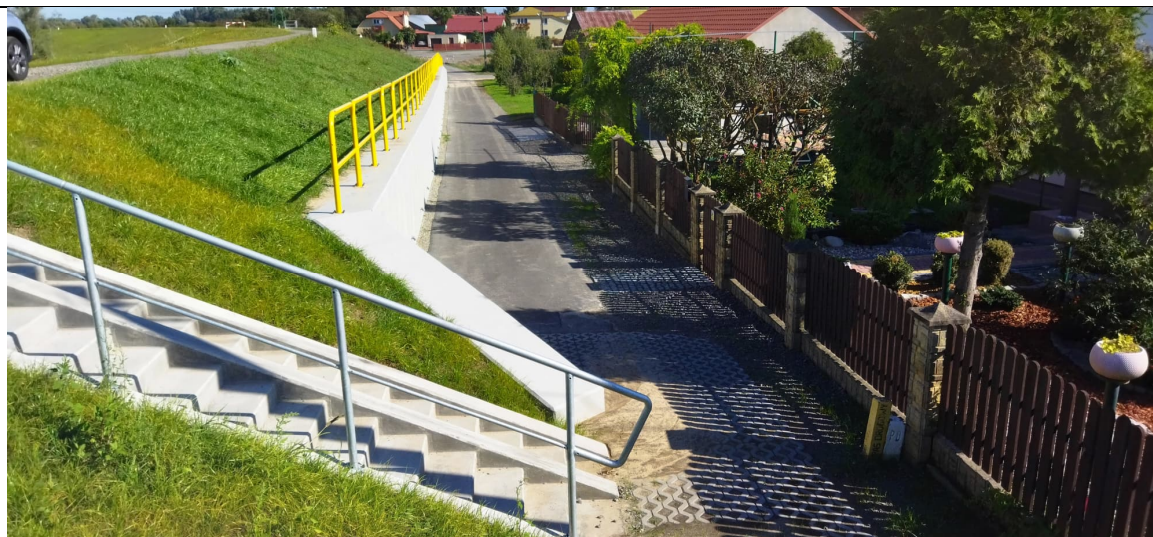
Zdjęcie nr 14: Widok z DK 77, Wał prawostronny, schody zwalnego do ul. Podwale, zabudowania w sąsiedztwie istniejących wałów.