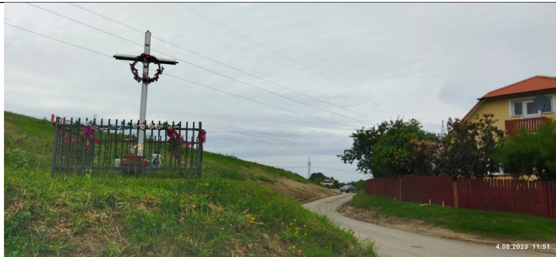
Zdjęcie nr 18: Krzyż na terenie inwestycji, droga, zabudowania blisko inwestycji.