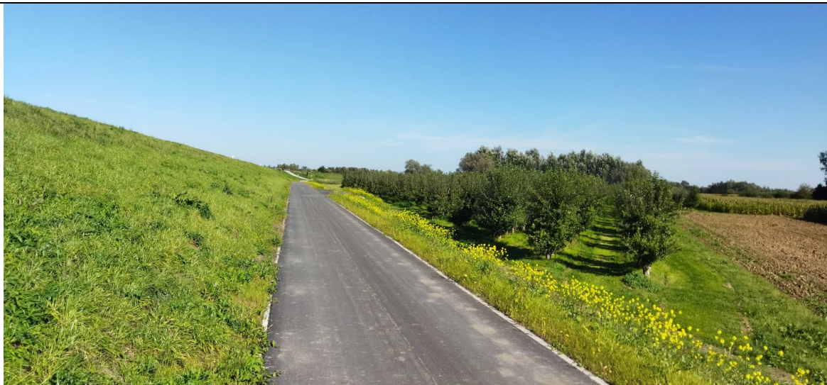
Zdjęcie nr 22: Sady owocowe przy drodze przywałowej.