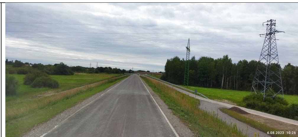
Zdjęcie nr 3: Sieć linii WN przechodząca przez t. inwestycji.