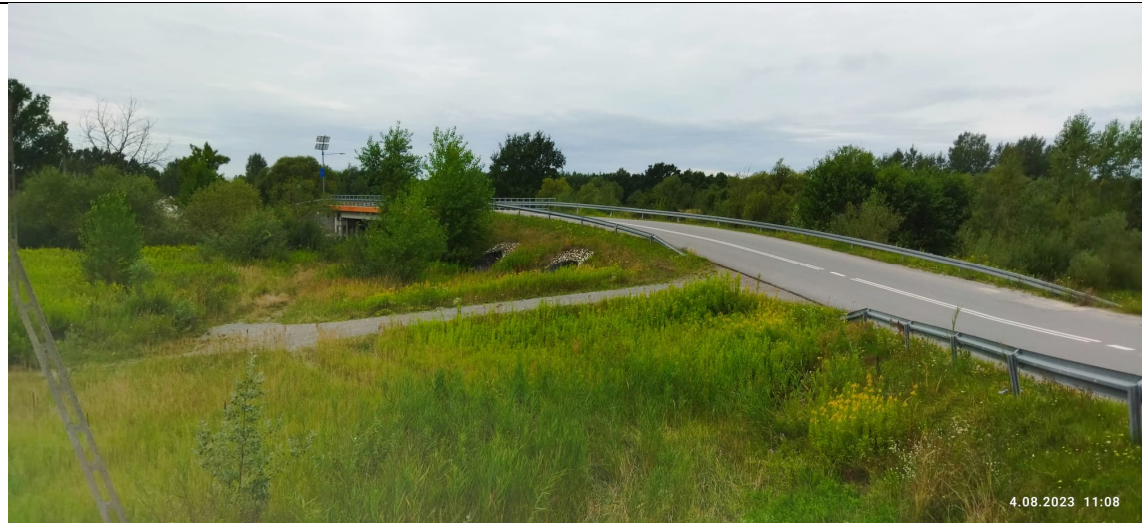
Zdjęcie nr 2: Widok na Most oraz przepusty w międzywalu.