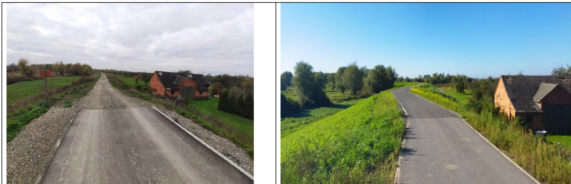
Zdjęcie nr 1: Początek wałów lewostronnych, budynek gospodarczy.

Zdjęcia od km 0+082 (od rzeki Wisły) do mostu Orliśka – Gorzyce)