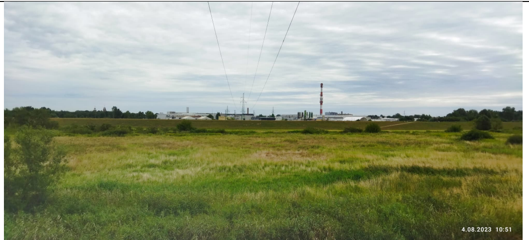
Zdjęcie nr 10: Widok na międzywale, rz. Łęg, tereny przemysłowe w oddali.