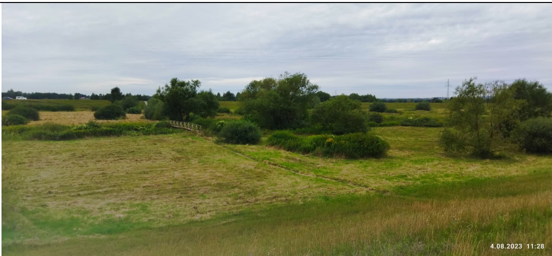
Zdjęcie nr 10: Widok na mostek dla pieszych z wałów prawostronnych.