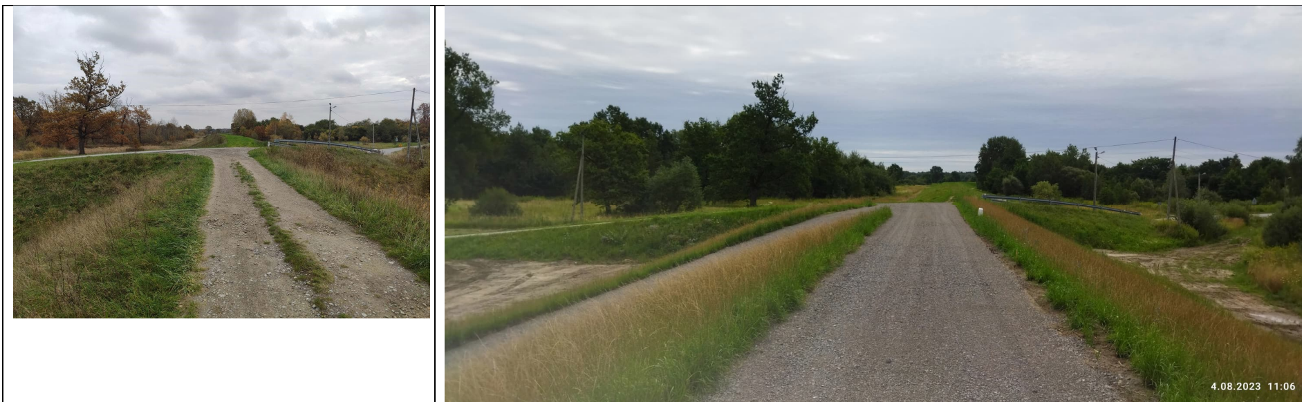
Zdjęcie nr 12: Koniec inwestycji – droga Orliśka – Gorzyce.

Część II. Zdjęcia wału prawego rzeki Łęg w km 0+000 - 5+236.