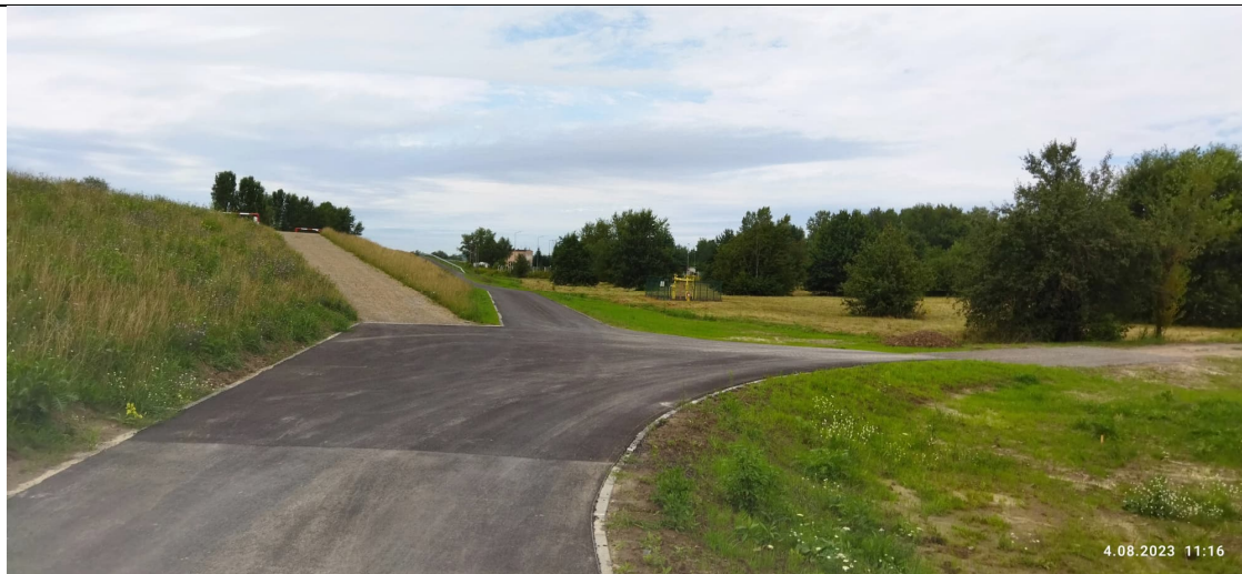
Zdjęcie nr 3: Skrzyżowanie dróg z wjazdem na wały, w oddali stacja redukcji gazu.