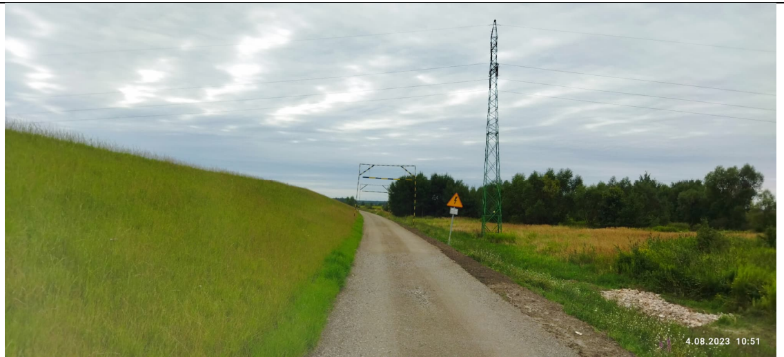
Zdjęcie nr 9: Wał, droga szutrowa, linia WN, tereny przyległe.