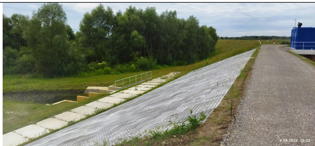
Zdjęcie nr 7: Ujście wód z przepompowni PGW WP do międzywala.