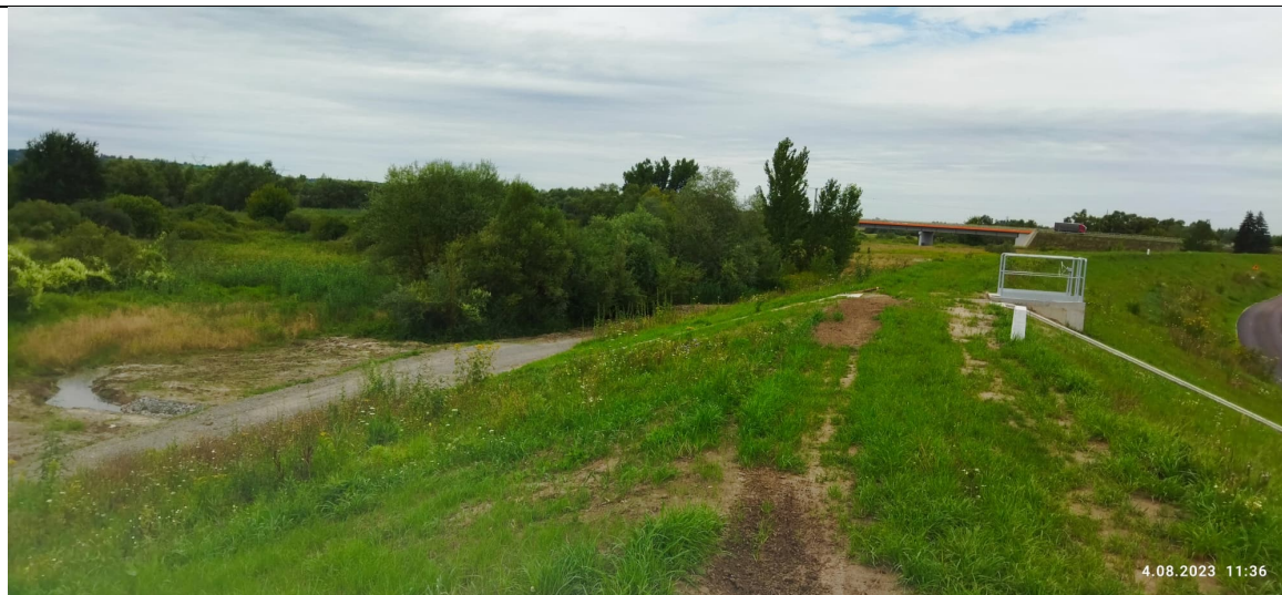
Zdjęcie nr 11: Przepust przez wał, zaszuwa.