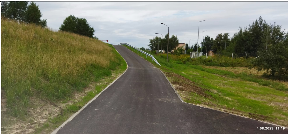
Zdjęcie nr 5: Wjazd na wał przy oczyszczalni (nawierzchnia asfaltowa).