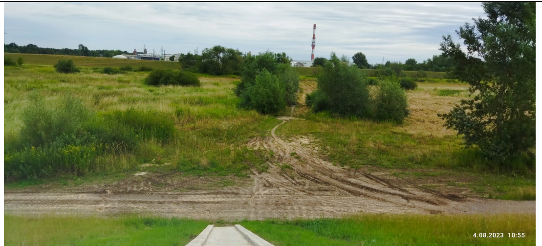
Zdjęcie nr 11: Droga w międzywale, dojście do mostku dla pieszych.