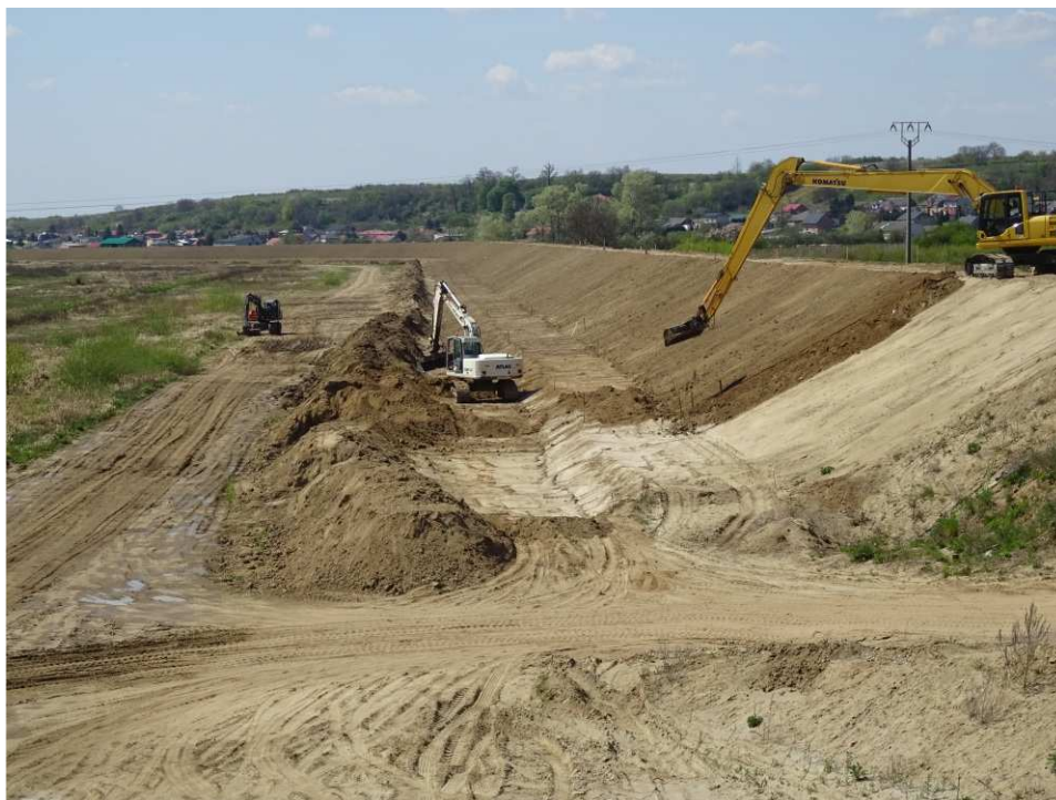
Foto. 39. Humusowanie skarp wału przeciwpowodziowego – lewy brzeg Koprzywianki powyżej mostu na drodze Andruszkowice- Koćmierzów, stan w trzeciej dekadzie kwietnia 2020 r. (widok w górę rzeki).