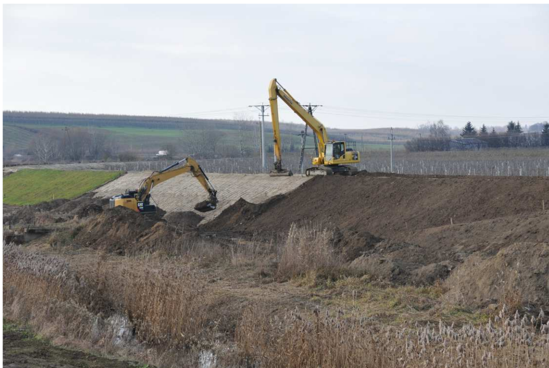
Foto. 40. Humusowanie skarp wału przeciwpowodziowego – lewy brzeg Koprzywianki powyżej mostu na drodze Samborzec-Zajeziórze, stan w pierwszej dekadzie grudnia 2020 r. (widok w górę rzeki).