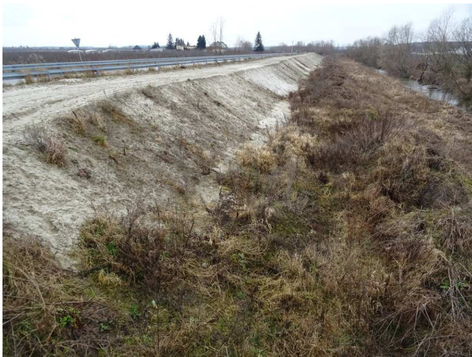
Foto. 6. Stan terenu budowy w pierwszym kwartale okresu realizacji robót na Zadaniu 4 – prawy brzeg Koprzywianki powyżej mostu na drodze Sośniczany-Skotniki, stan w trzeciej dekadzie lutego 2020 r. (widok w górę rzeki).