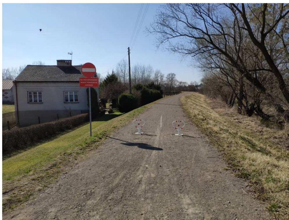
Foto. 56. Stan terenu budowy w ostatnim kwartale okresu realizacji robót na Zadaniu 4 – prawy brzeg Koprzywianki powyżej mostu na drodze nr 758 w Koprzywnicy, stan w trzeciej dekadzie marca 2022 r. (widok w górę rzeki).