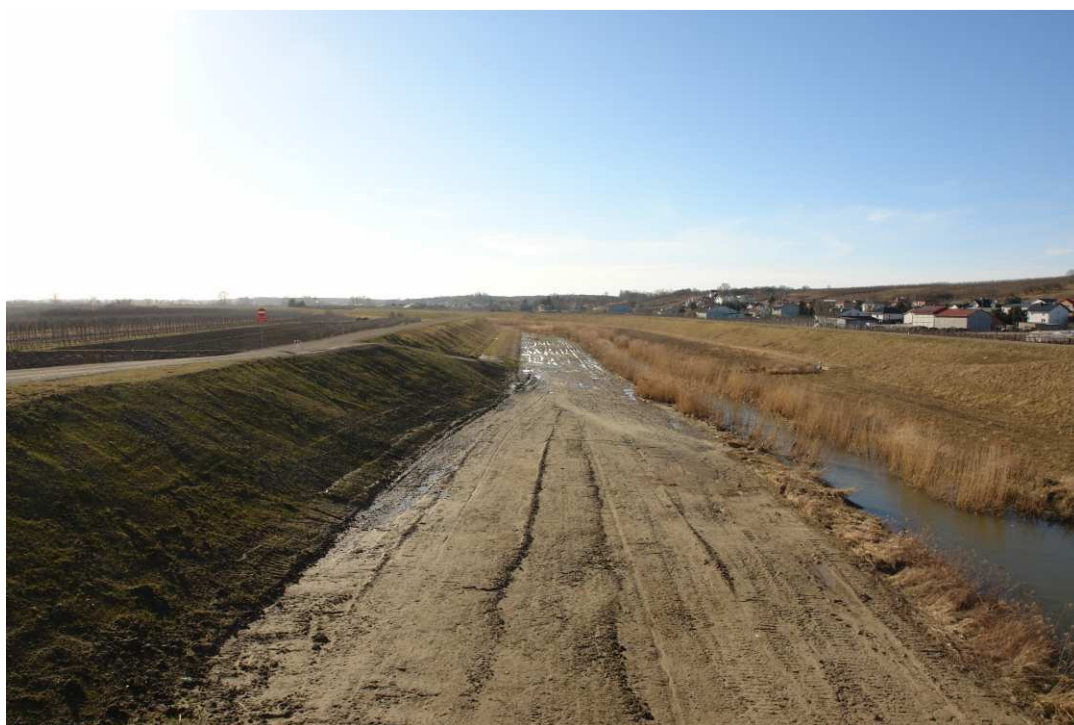
Foto. 51. Stan terenu budowy w ostatnim kwartale okresu realizacji robót na Zadaniu 4 – brzegi Koprzywianki powyżej mostu na drodze Żłota-Zawierzbie, stan w trzeciej dekadzie lutego 2022 r. (widok w górę rzeki).