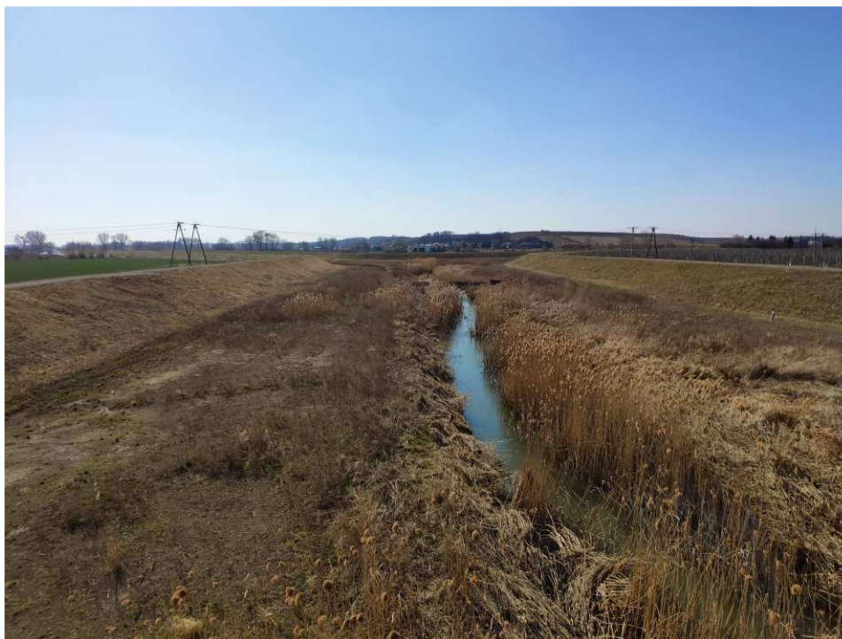
Foto. 52. Stan terenu budowy w ostatnim kwartale okresu realizacji robót na Zadaniu 4 – brzegi Koprzywianki powyżej mostu na drodze Samborzec-Zajeziórze, stan w trzeciej dekadzie marca 2022 r. (widok w górę rzeki).