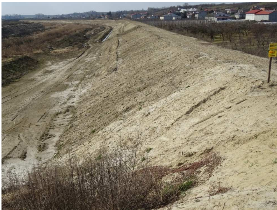
Foto. 3. Stan terenu budowy w pierwszym kwartale okresu realizacji robót na Zadaniu 4 – lewy brzeg Koprzywianki powyżej mostu na drodze Żłota-Zawierzbie, stan w trzeciej dekadzie marca 2020 r. (widok w górę rzeki).