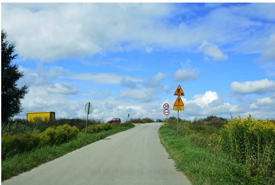
Foto. 13. Oznakowanie drogi publicznej w pobliżu wyjazdu z terenu budowy – prawy brzeg Koprzywianki na wysokości mostu przy drodze Andruszkowice-Koćmierzów, stan w trzeciej dekadzie sierpnia 2020 r. (widok w kierunku NW).