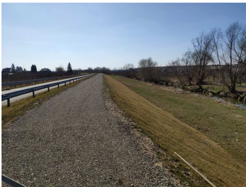
Foto. 54. Stan terenu budowy w ostatnim kwartale okresu realizacji robót na Zadaniu 4 – prawy brzeg Koprzywianki powyżej mostu na drodze Sośniczany-Skotniki, stan w trzeciej dekadzie marca 2022 r. (widok w górę rzeki).