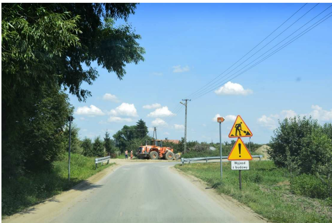
Foto. 14. Oznakowanie drogi publicznej w pobliżu wyjazdu z placu składowego – lewy brzeg Koprzywianki na wysokości mostu przy drodze Sośniczany-Skotniki, stan w trzeciej dekadzie lipca 2020 r. (widok w kierunku NE)