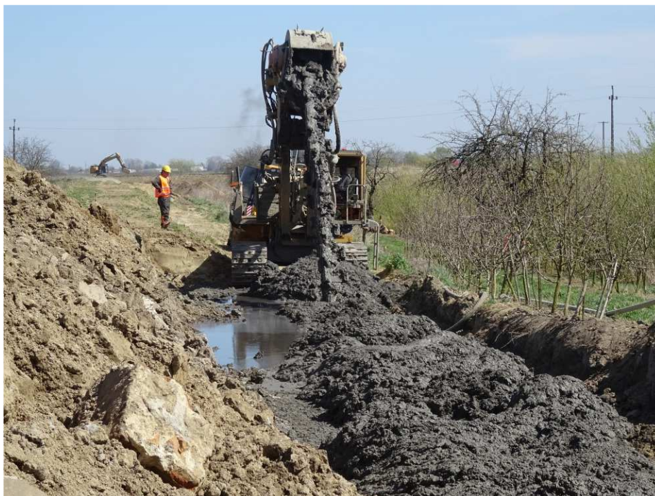
Foto. 26. Budowa przesłony cementowo-bentonitowej – lewy brzeg ciek Polanówka poniżej mostu na drodze Kraków-Sandomierz, stan w drugiej dekadzie kwietnia 2020 r. (widok w dół ciek).