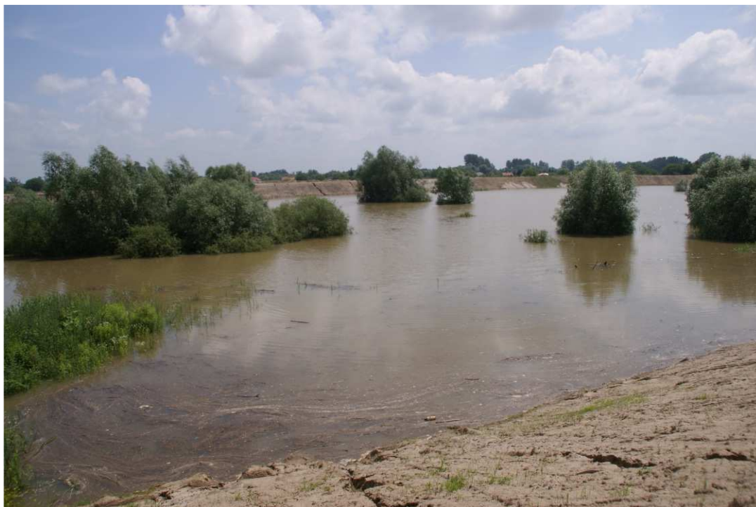
Foto. 47. Wezbranie powodziowe na terenie robót – brzegi Koprzywianki powyżej mostu na drodze Sandomierz-Zawisielcze, stan w trzeciej dekadzie czerwca 2020 r. (widok w górę rzeki).