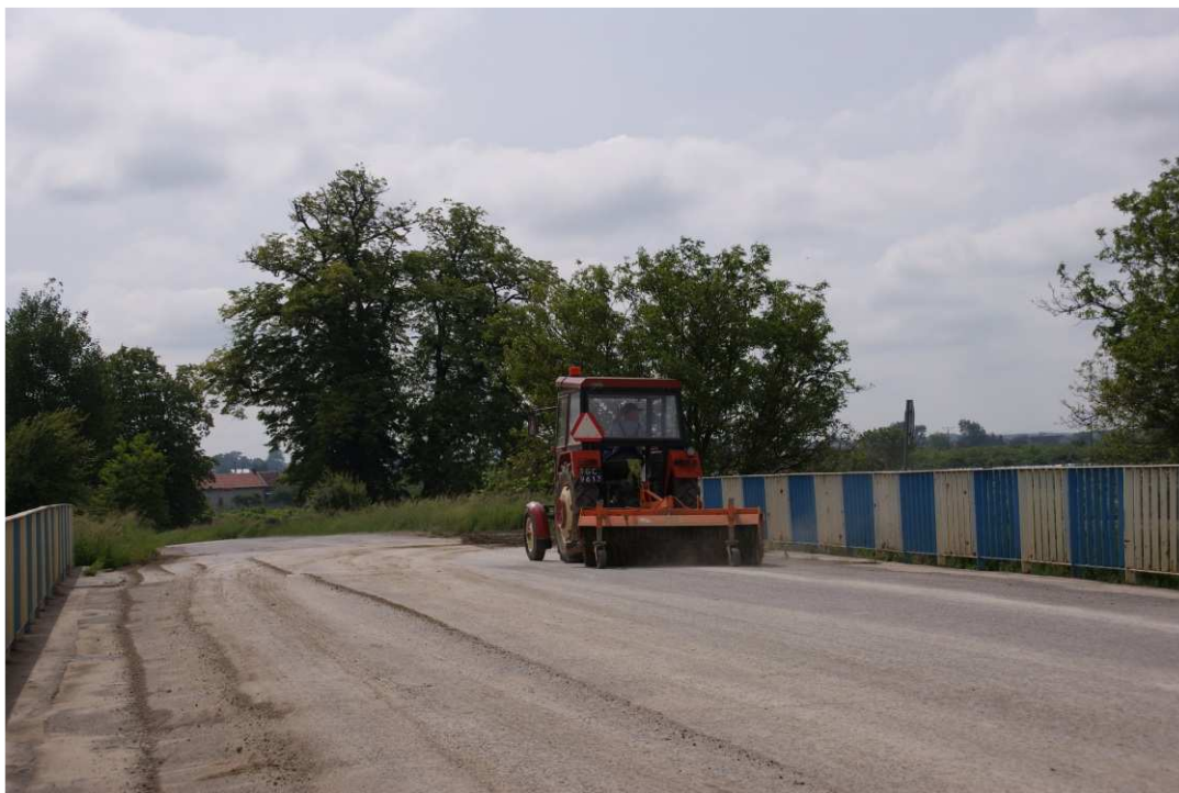
Foto. 21. Utrzymywanie czystości dróg publicznych w sąsiedztwie terenu budowy – most na drodze Samborzec-Zajeziórze, stan w drugiej dekadzie czerwca 2020 r. (widok w kierunku SE).