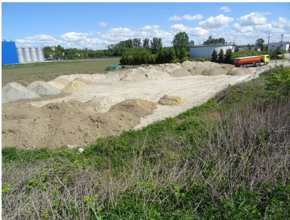
Foto. 10. Plac składowy na lewobrzeżnym zawalu Koprzywianki – lewy brzeg Koprzywianki poniżej mostu przy drodze Samborzec-Zajeziórze, stan w drugiej dekadzie maja 2020 r. (widok w dół rzeki).