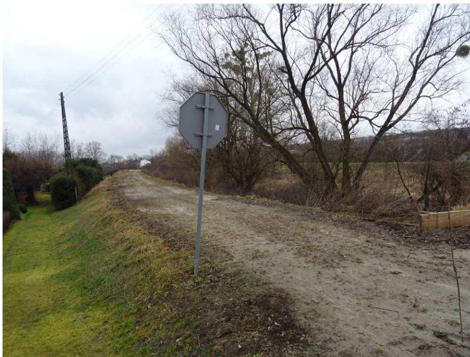
Foto. 8. Stan terenu budowy w pierwszym kwartale okresu realizacji robót na Zadaniu 4 – prawy brzeg Koprzywianki powyżej mostu na drodze nr 758 w Koprzywnicy, stan w trzeciej dekadzie lutego 2020 r. (widok w górę rzeki).