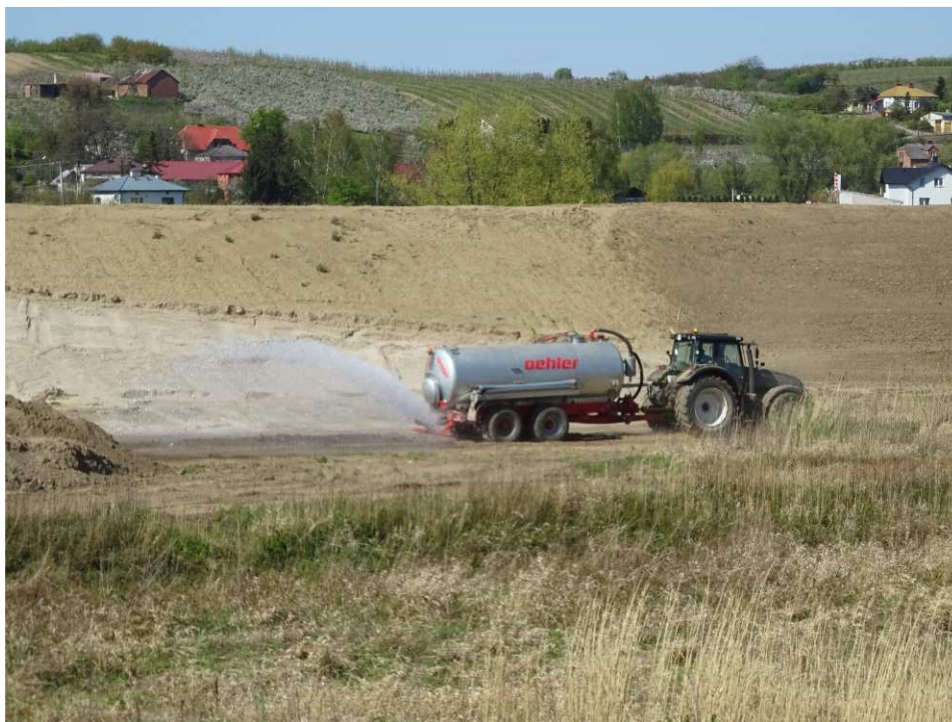
Foto. 19. Zraszanie dróg technologicznych w celu ograniczania pylenia – lewy brzeg Koprzywianki poniżej mostu na drodze Andruszkowice- Koćmierzów, stan w trzeciej dekadzie kwietnia 2020 r. (widok w dół rzeki).