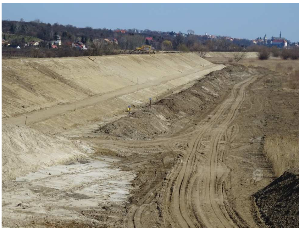
Foto. 23. Zabezpieczenie hałd humusu – lewy brzeg Koprzywianki poniżej mostu na drodze Andruszkowice- Koćmierzów, stan w trzeciej dekadzie marca 2020 r. (widok w dół rzeki).