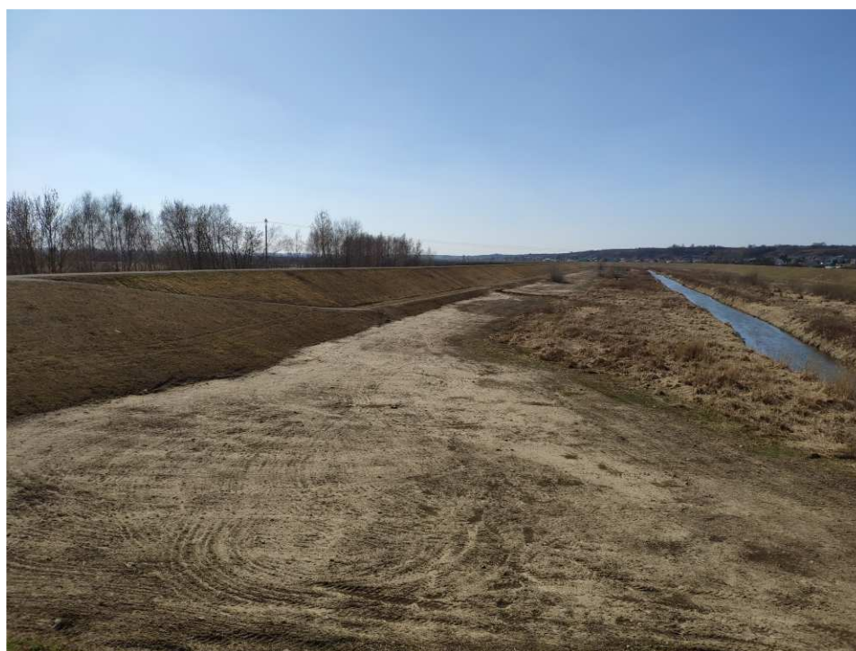
Foto. 50. Stan terenu budowy w ostatnim kwartale okresu realizacji robót na Zadaniu 4 – brzegi Koprzywianki powyżej mostu na drodze Andruszkowice-Koćmierzów, stan w trzeciej dekadzie marca 2022 r. (widok w górę rzeki).