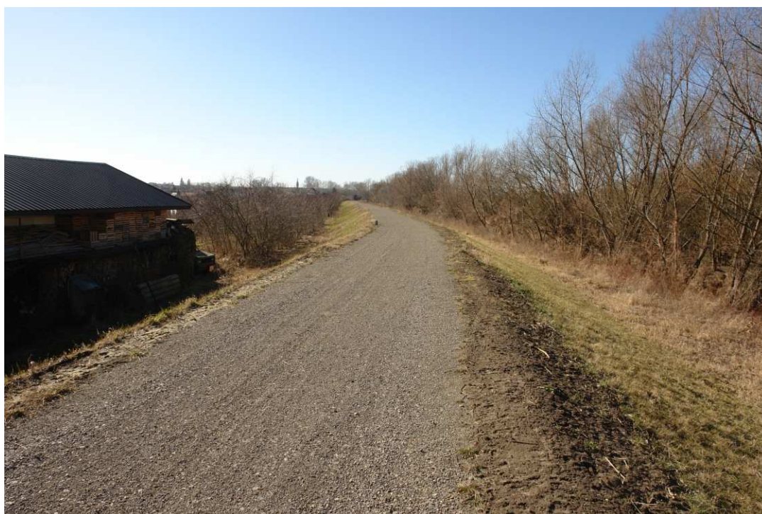
Foto. 55. Stan terenu budowy w ostatnim kwartale okresu realizacji robót na Zadaniu 4 – prawy brzeg Koprzywianki powyżej kładki pieszej w Koprzywnicy, stan w trzeciej dekadzie lutego 2022 r. (widok w górę rzeki).