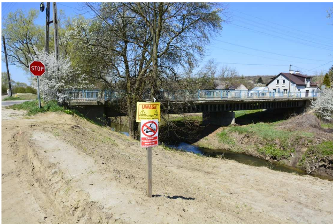
Foto. 16. Zabezpieczenie miejsc niebezpiecznych – prawy brzeg Koprzywianki poniżej mostu na drodze nr 758 w Koprzywnicy, stan w trzeciej dekadzie kwietnia 2021 r. (widok w górę rzeki).