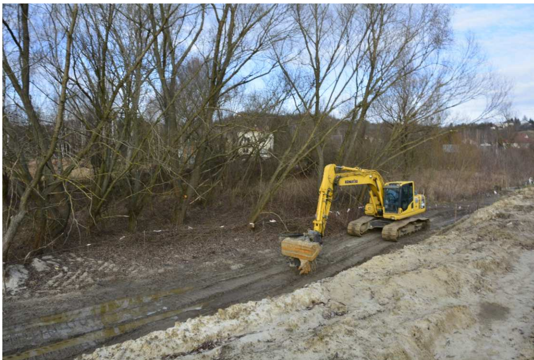
Foto. 17. Zabezpieczenie drzew i krzewów nie planowanych do wycinki – lewy brzeg Koprzywianki powyżej mostu na drodze Sandomierz-Zawisielcze, stan w trzeciej dekadzie grudnia 2020 r. (widok w dół rzeki).