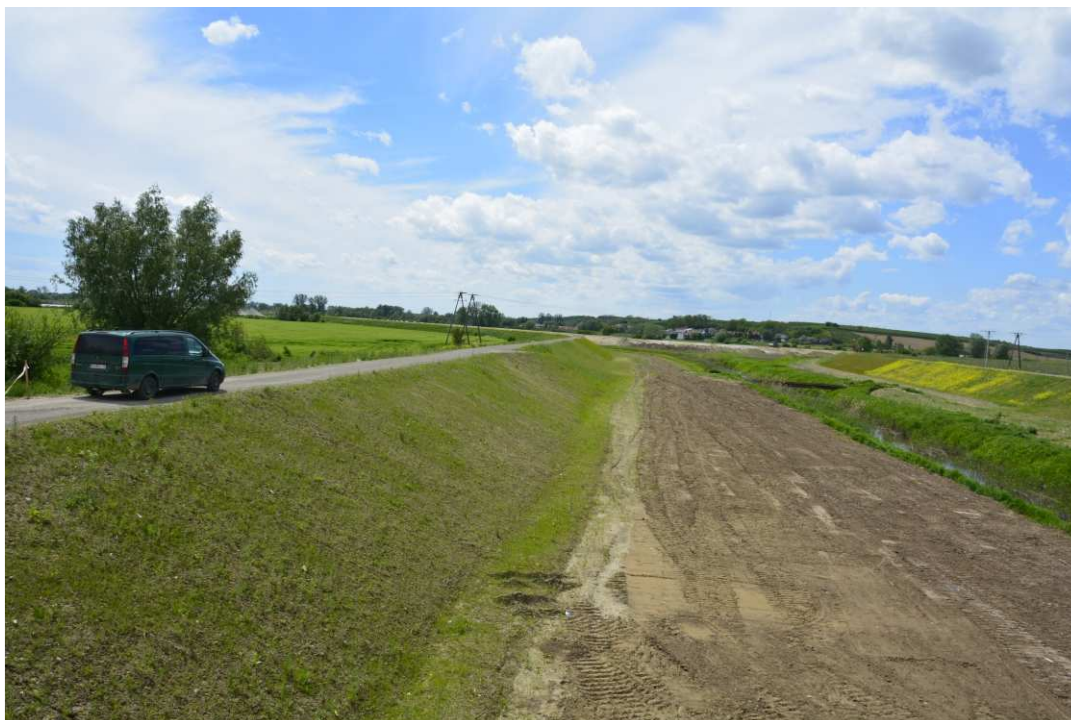
Foto. 46. Rekultywacja terenu międzywala Koprzywianki – brzegi Koprzywianki powyżej mostu na drodze Samborzec-Zajeziórze, stan w trzeciej dekadzie maja 2021 r. (widok w górę rzeki).