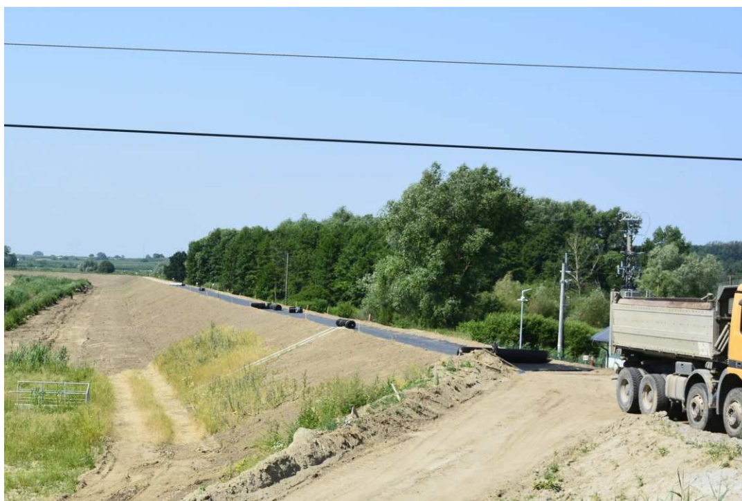
Foto. 41. Budowa drogi na koronie wału przeciwpowodziowego – lewy brzeg Koprzywianki powyżej mostu na drodze Szewce-Skotniki, stan w drugiej dekadzie czerwca 2021 r. (widok w górę rzeki).