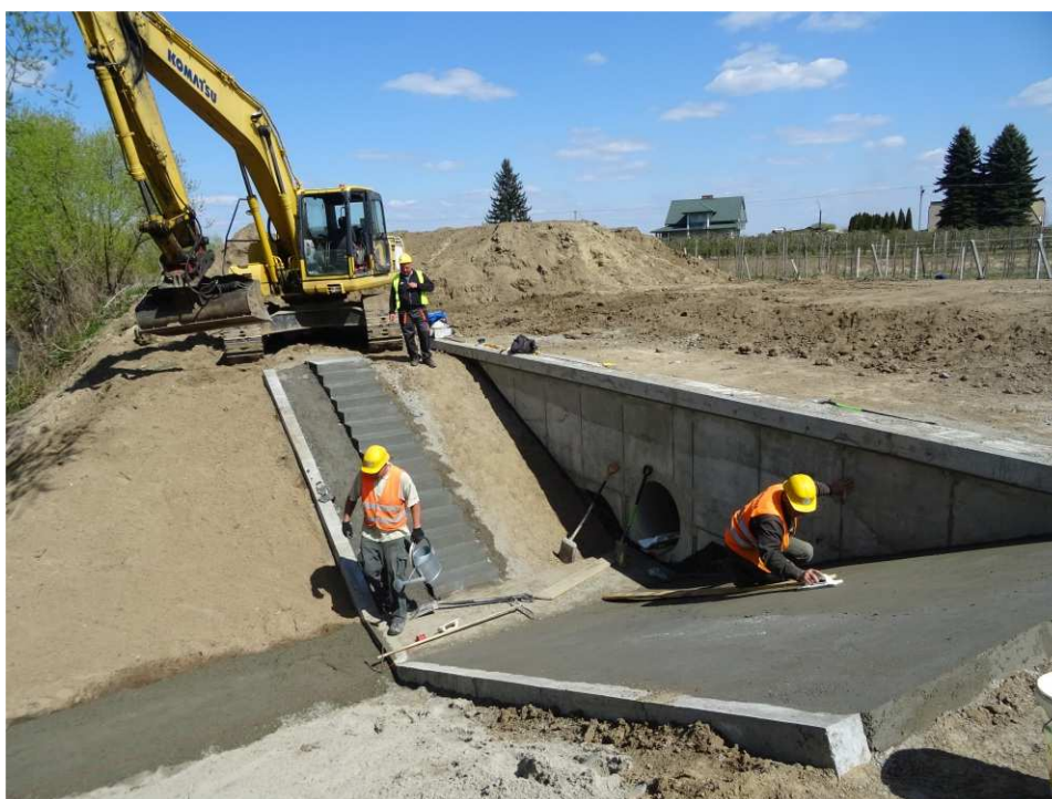
Foto. 30. Przebudowa przepustu wałowego – prawy brzeg Koprzywianki powyżej mostu na drodze Sońciszany-Skotniki, stan w drugiej dekadzie kwietnia 2020 r. (widok w dół rzeki).