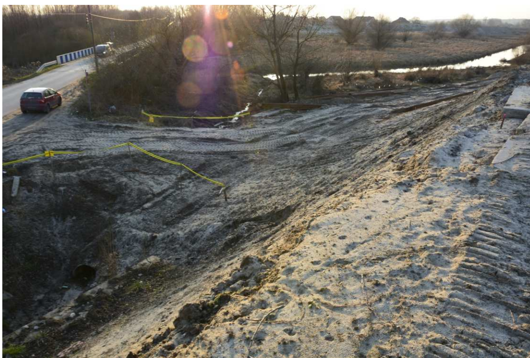
Foto. 15. Zabezpieczenie miejsc niebezpiecznych – lewy brzeg Koprzywianki powyżej mostu na drodze Sandomierz-Zawiszełcze, stan w drugiej dekadzie stycznia 2021 r. (widok w górę rzeki).