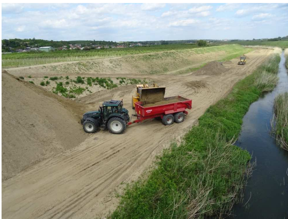
Foto. 31. Transport mas ziemnych do budowy wału przeciwpowodziowego – lewy brzeg Koprzywianki poniżej mostu na drodze Żłota-Zawierzbie, stan w drugiej dekadzie maja 2020 r. (widok w dół rzeki).