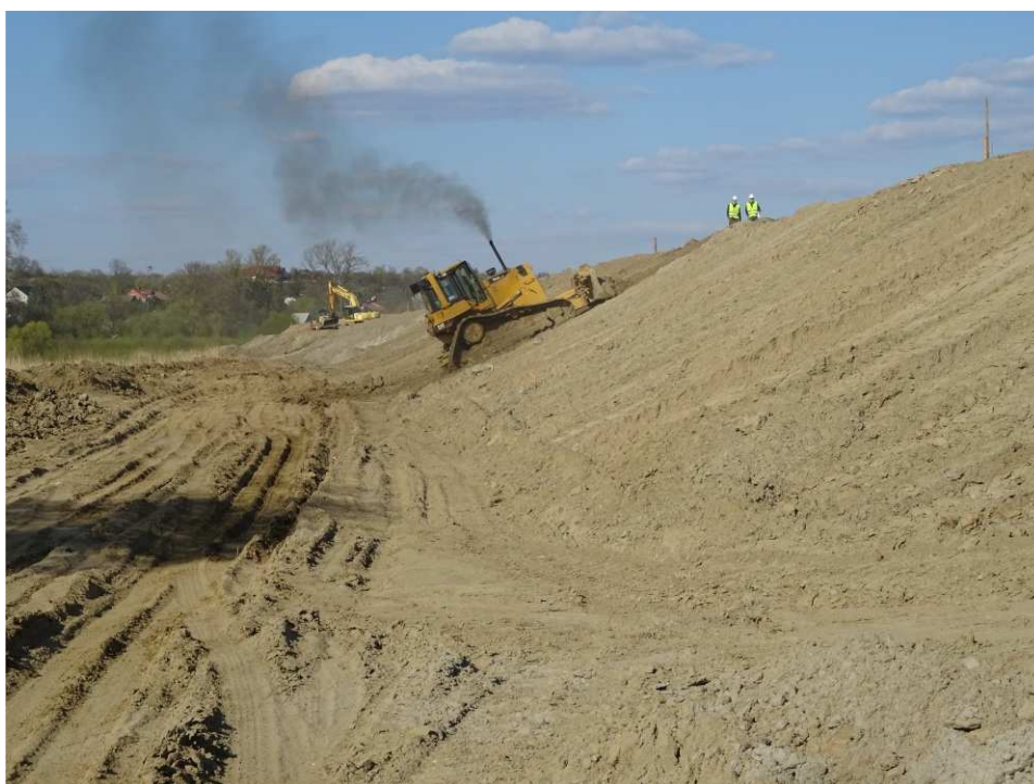
Foto. 33. Formowanie skarp wału przeciwpowodziowego – prawy brzeg Koprzywianki poniżej mostu na drodze Andruszkowice- Koćmierzów, stan w drugiej dekadzie kwietnia 2020 r. (widok w dół rzeki).