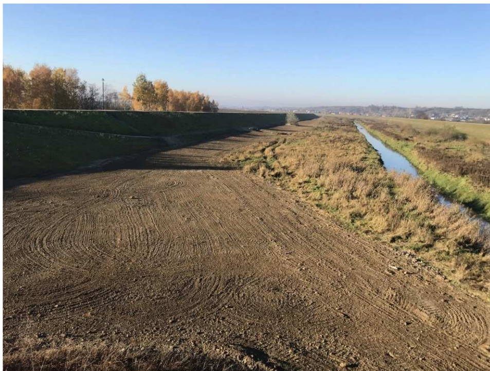
Foto. 45. Rekultywacja terenu międzywala Koprzywianki – prawy brzeg Koprzywianki powyżej mostu na drodze Andruszkowice- Koćmierzów, stan w trzeciej dekadzie października 2021 r. (widok w górę rzeki).