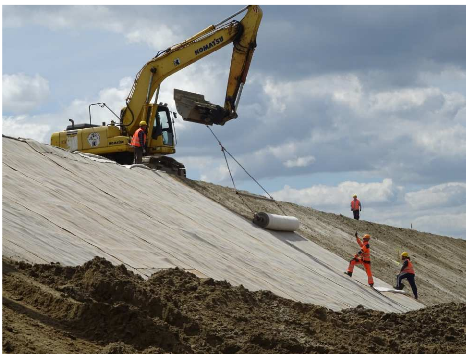
Foto. 37. Układanie bentomaty na skarpie wału przeciwpowodziowego – lewy brzeg Koprzywianki poniżej mostu na drodze Andruszkowice-Koćmierzów, stan w drugiej dekadzie maja 2020 r. (widok w dół rzeki).