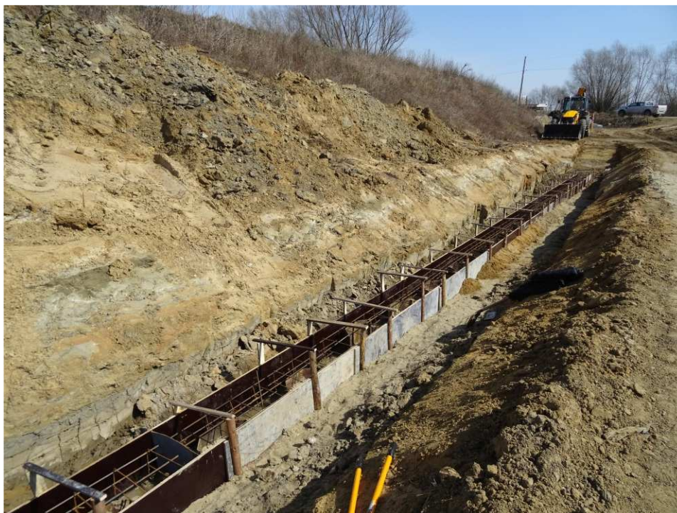
Foto. 28. Wykonywanie oczepu na ścianie szczelnej u podstawy wału – lewy brzeg Koprzywianki powyżej mostu na drodze Sandomierz-Zawisielcze, stan w trzeciej dekadzie marca 2020 r. (widok w dół rzeki).