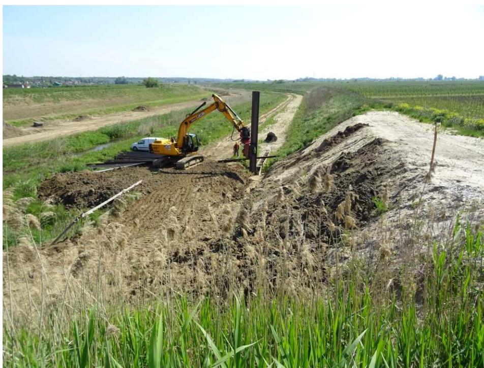
Foto. 27. Wbijanie ścianki szczelnej u podstawy wału – prawy brzeg Koprzywianki poniżej mostu na drodze Żłota-Zawierzbie, stan w drugiej dekadzie maja 2020 r. (widok w dół rzeki).