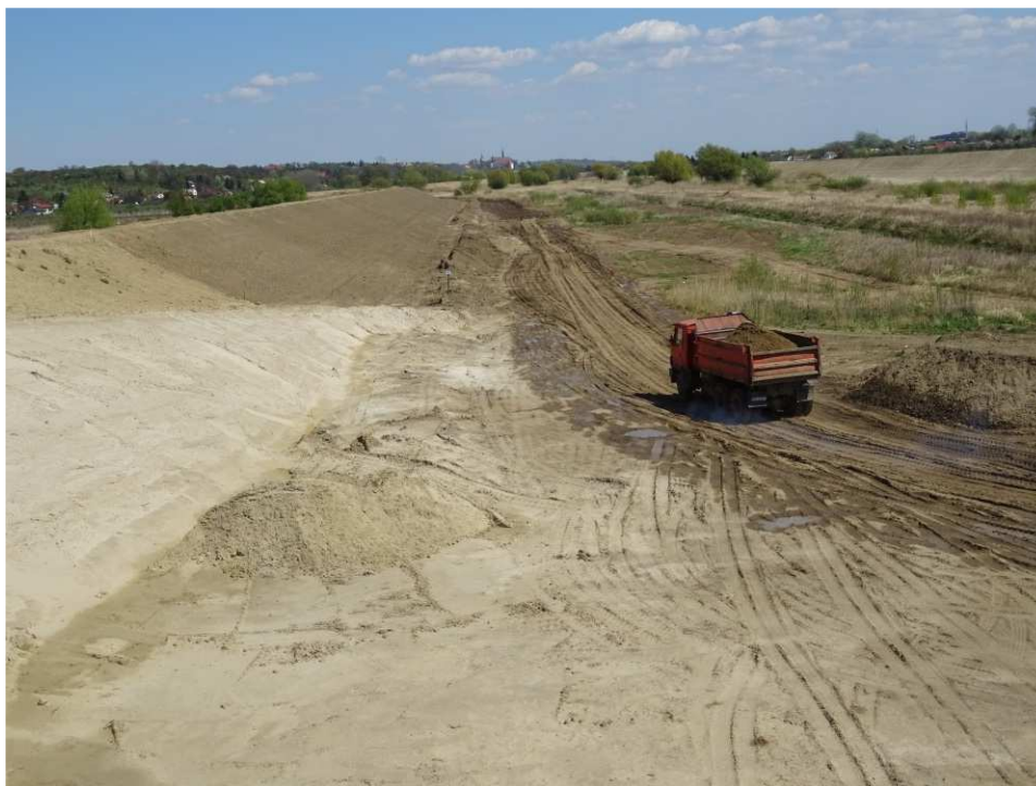
Foto. 20. Utrzymywanie dróg technologicznych w stanie ograniczającym pylenie – lewy brzeg Koprzywianki poniżej mostu na drodze Andruszkowice- Koćmierzów, stan w trzeciej dekadzie kwietnia 2020 r. (widok w dół rzeki).