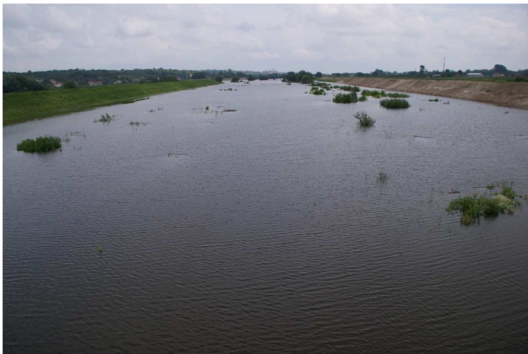
Foto. 48. Wezbranie powodziowe na terenie robót – brzegi Koprzywianki poniżej mostu na drodze Andruszkowice-Koćmierzów, stan w trzeciej dekadzie czerwca 2020 r. (widok w dół rzeki).