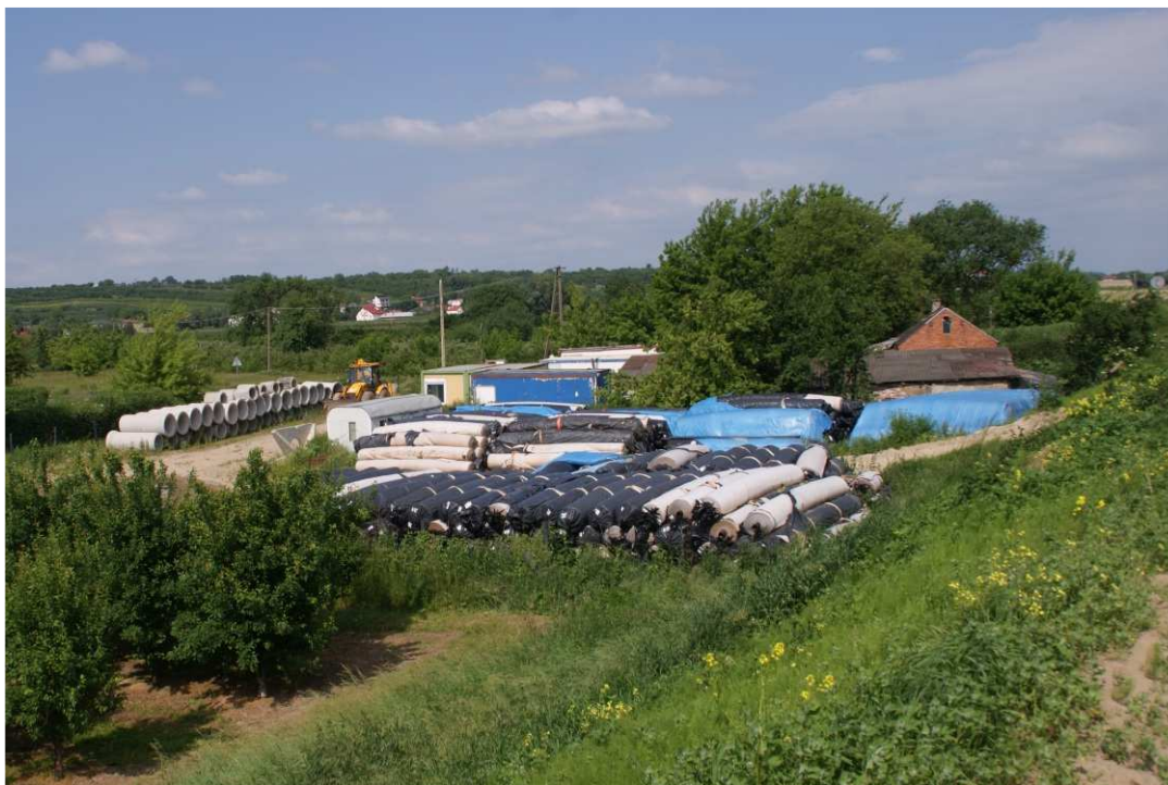
Foto. 9. Zaplecze budowy na lewobrzeżnym zawalu Koprzywianki – lewy brzeg Koprzywianki powyżej mostu przy drodze Andruszkowice- Koćmierzów, stan w drugiej dekadzie czerwca 2020 r. (widok w dół rzeki).