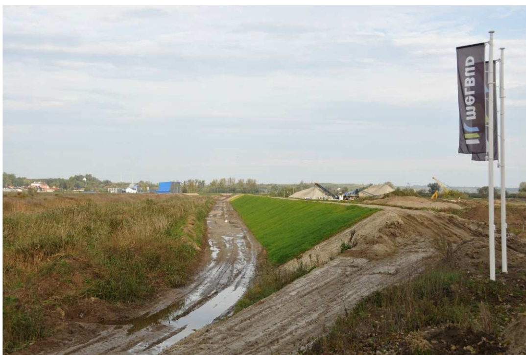
Foto. 44. Porost traw wysianych na skarpie wału przeciwpowodziowego – prawy brzeg Koprzywianki poniżej mostu na drodze Szewce-Skotniki, stan w trzeciej dekadzie października 2020 r. (widok w dół rzeki).