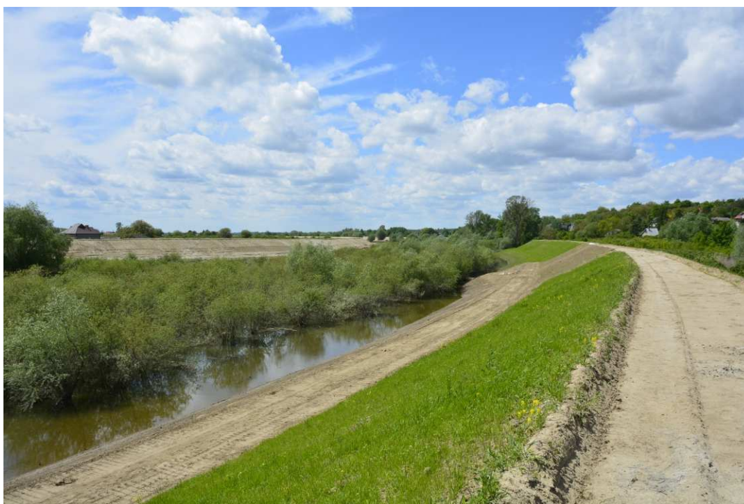
Foto. 43. Porost traw wysianych na skarpie wału przeciwpowodziowego – lewy brzeg Koprzywianki powyżej mostu na drodze Sandomierz-Zawisielce, stan w trzeciej dekadzie maja 2021 r. (widok w górę rzeki).