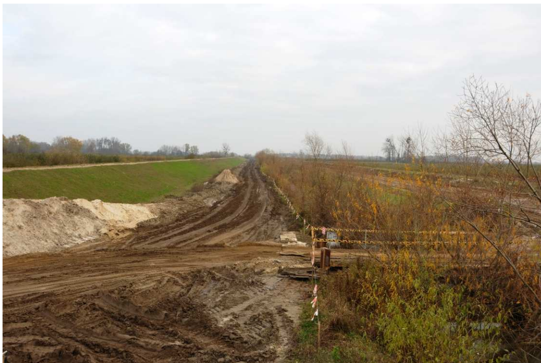
Foto. 18. Zabezpieczenie drzew i krzewów nie planowanych do wycinki – lewy brzeg Koprzywianki poniżej mostu na drodze Sośniczany-Skotniki, stan w drugiej dekadzie listopada 2020 r. (widok w dół rzeki).