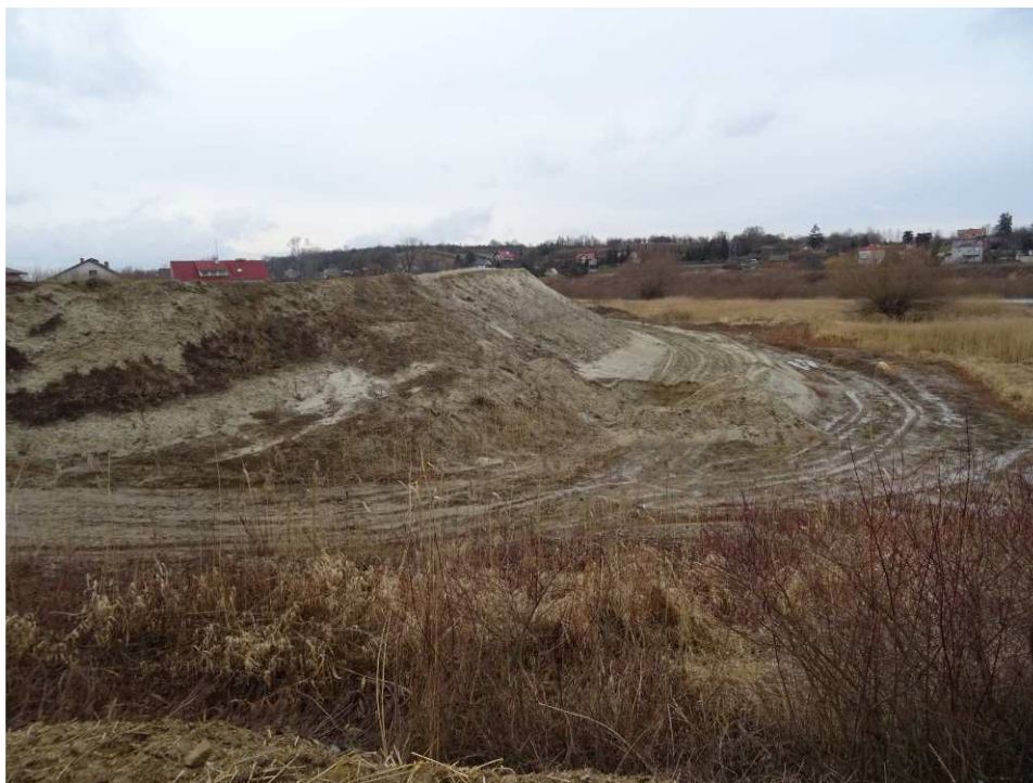
Foto. 1. Stan terenu budowy w pierwszym kwartale okresu realizacji robót na Zadaniu 4 – brzegi Koprzywianki powyżej mostu na drodze Sandomierz-Zawiszełcze, stan w trzeciej dekadzie lutego 2020 r. (widok w górę rzeki).