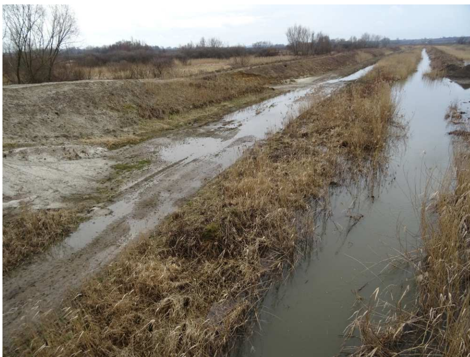
Foto. 5. Stan terenu budowy w pierwszym kwartale okresu realizacji robót na Zadaniu 4 – prawy brzeg Koprzywianki powyżej mostu na drodze Szewce-Skotniki, stan w trzeciej dekadzie lutego 2020 r. (widok w górę rzeki).