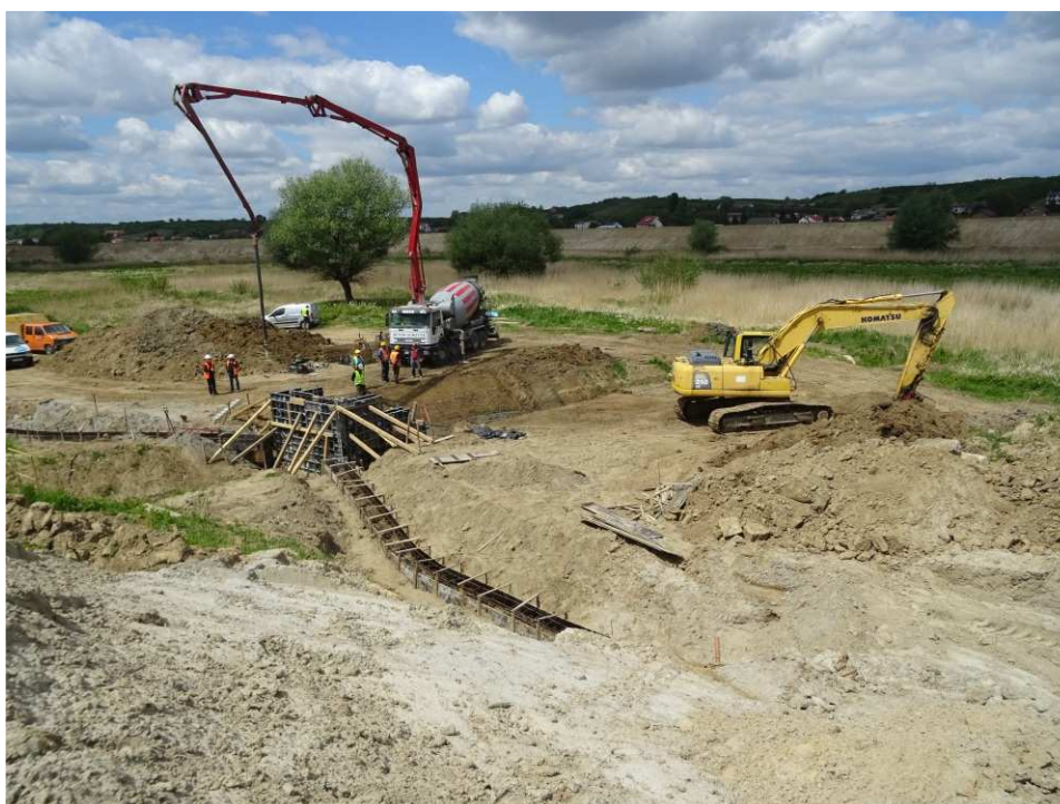
Foto. 29. Przebudowa przepustu wałowego – prawy brzeg Koprzywianki poniżej mostu na drodze Andruszkowice- Koćmierzów, stan w drugiej dekadzie maja 2020 r. (widok w górę rzeki).