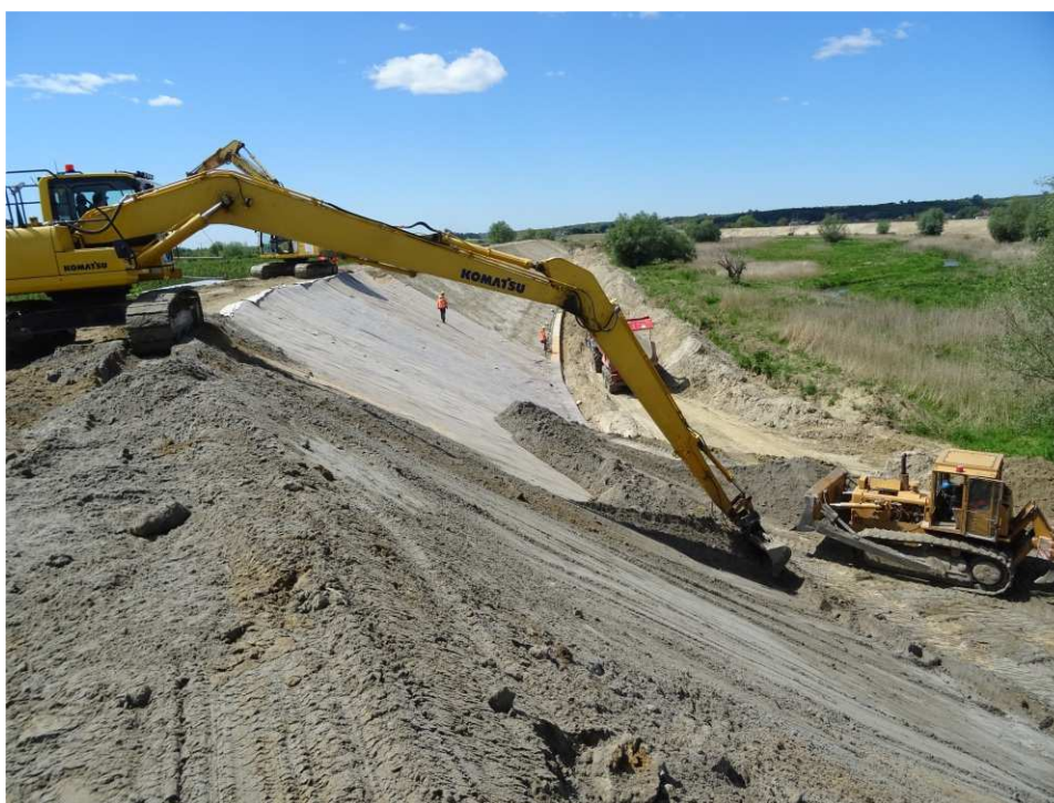
Foto. 38. Układanie bentomaty na skarpie wału przeciwpowodziowego – prawy brzeg Koprzywianki poniżej mostu na drodze Andruszkowice-Koćmierzów, stan w trzeciej dekadzie maja 2020 r. (widok w górę rzeki).