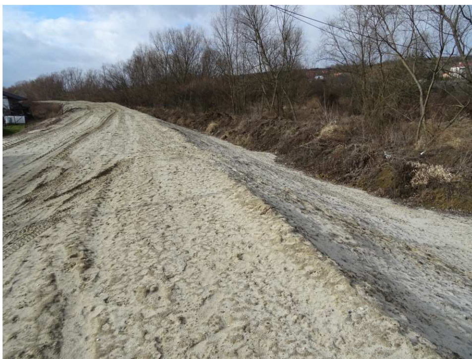
Foto. 7. Stan terenu budowy w pierwszym kwartale okresu realizacji robót na Zadaniu 4 – prawy brzeg Koprzywianki powyżej kładki pieszej w Koprzywnicy, stan w trzeciej dekadzie lutego 2020 r. (widok w górę rzeki).