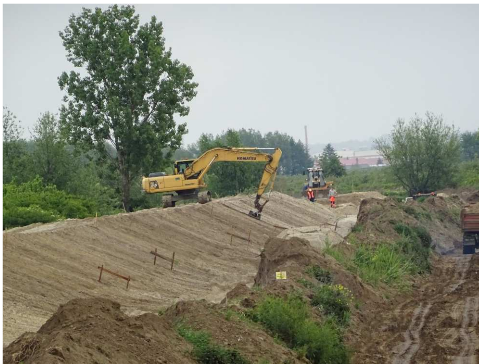
Foto. 36. Zagęszczanie korpusu wału przeciwpowodziowego – lewy brzeg Koprzywianki poniżej mostu na drodze Sośniczany-Skotniki, stan w trzeciej dekadzie maja 2020 r. (widok w dół rzeki).