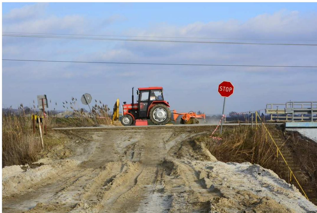
Foto. 22. Utrzymywanie czystości dróg publicznych w sąsiedztwie terenu budowy – droga dojazdowa do mostu na drodze Szewce-Skotniki, stan w drugiej dekadzie stycznia 2021 r. (widok w dół rzeki).