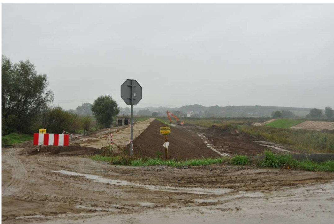
Foto. 11. Oznakowanie terenu budowy – prawy brzeg Koprzywianki powyżej mostu na drodze Samborzec-Zajeziórze, stan w trzeciej dekadzie października 2020 r. (widok w górę rzeki).