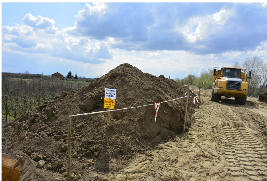
Foto. 24. Zabezpieczenie hałd humusu – prawy brzeg Koprzywianki powyżej mostu na drodze Sońniczany-Skotniki, stan w drugiej dekadzie kwietnia 2021 r. (widok w górę rzeki).