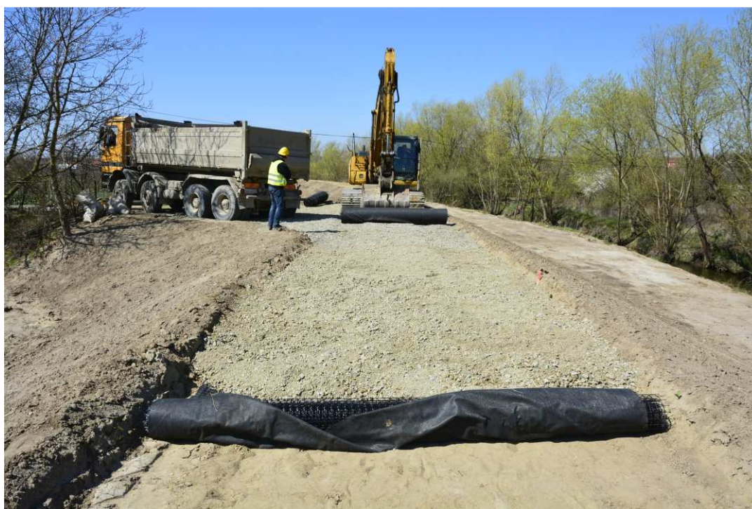
Foto. 42. Budowa drogi na koronie wału przeciwpowodziowego – prawy brzeg Koprzywianki powyżej kładki pieszej w Koprzywnicy, stan w trzeciej dekadzie kwietnia 2021 r. (widok w górę rzeki).