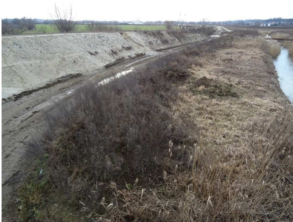
Foto. 4. Stan terenu budowy w pierwszym kwartale okresu realizacji robót na Zadaniu 4 – prawy brzeg Koprzywianki powyżej mostu na drodze Samborzec-Zajeziórze, stan w drugiej dekadzie lutego 2020 r. (widok w górę rzeki).