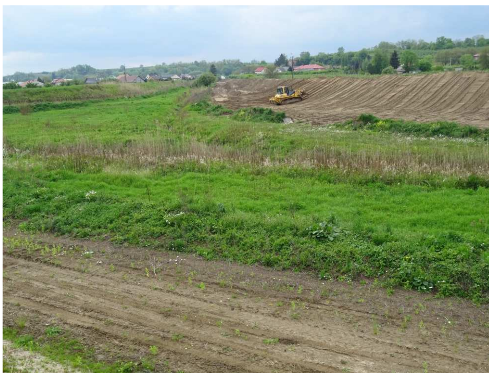
Foto. 34. Formowanie skarp wału przeciwpowodziowego – lewy brzeg Koprzywianki poniżej ujścia cieków Polanówka, stan w drugiej dekadzie maja 2020 r. (widok w górę rzeki).