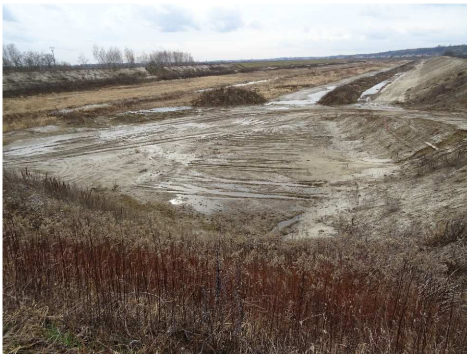
Foto. 2. Stan terenu budowy w pierwszym kwartale okresu realizacji robót na Zadaniu 4 – brzegi Koprzywianki powyżej mostu na drodze Andruszkowice-Koćmierzów, stan w trzeciej dekadzie lutego 2020 r. (widok w górę rzeki).