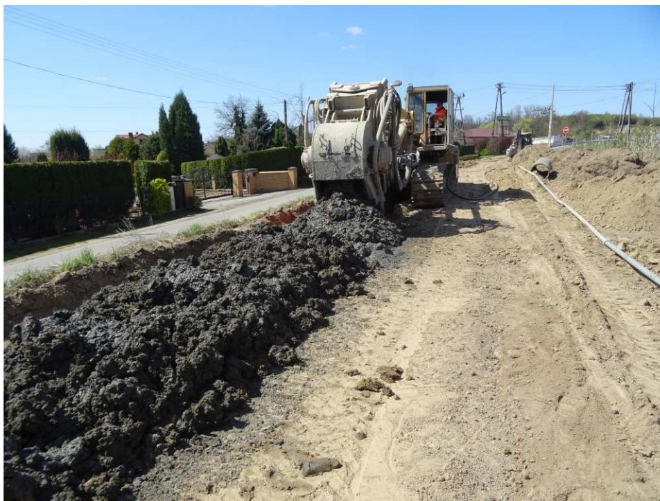
Foto. 25. Budowa przesłony cementowo-bentonitowej – prawy brzeg ciek Polanówka poniżej mostu na drodze Kraków-Sandomierz, stan w trzeciej dekadzie kwietnia 2020 r. (widok w górę ciek).