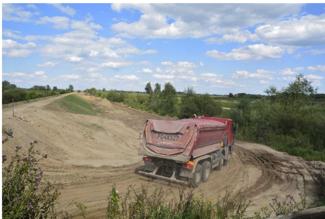
Foto. 32. Transport mas ziemnych do budowy wału przeciwpowodziowego – lewy brzeg Koprzywianki poniżej mostu na drodze Sońniczany-Skotniki, stan w trzeciej dekadzie lipca 2020 r. (widok w dół rzeki).