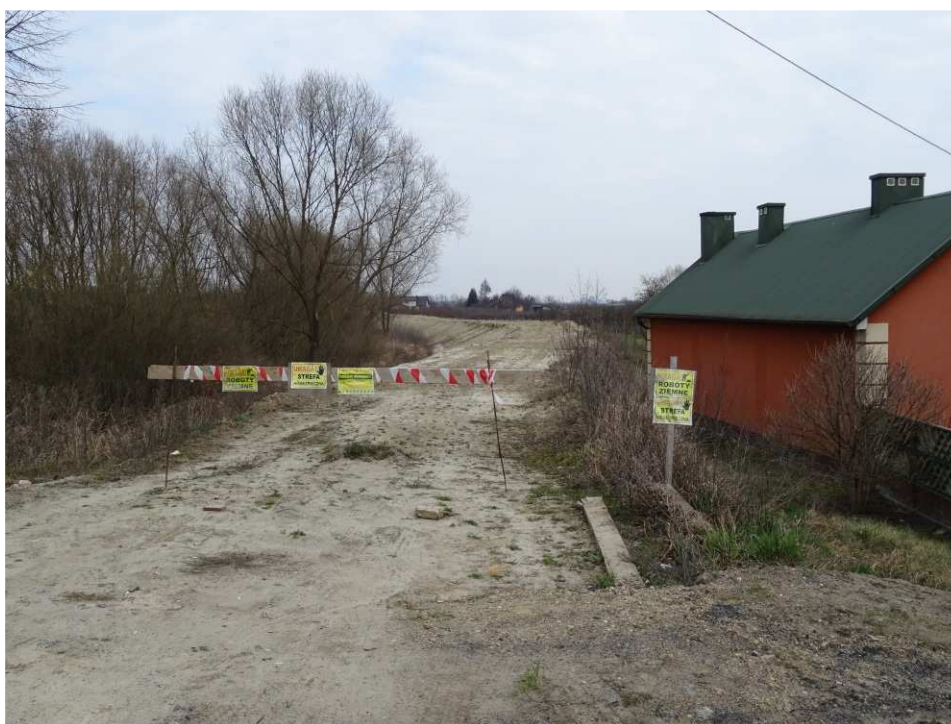
Foto. 12. Oznakowanie terenu budowy – prawy brzeg Koprzywianki poniżej mostu na drodze nr 758 w Koprzywnicy, stan w drugiej dekadzie marca 2020 r. (widok w dół rzeki).