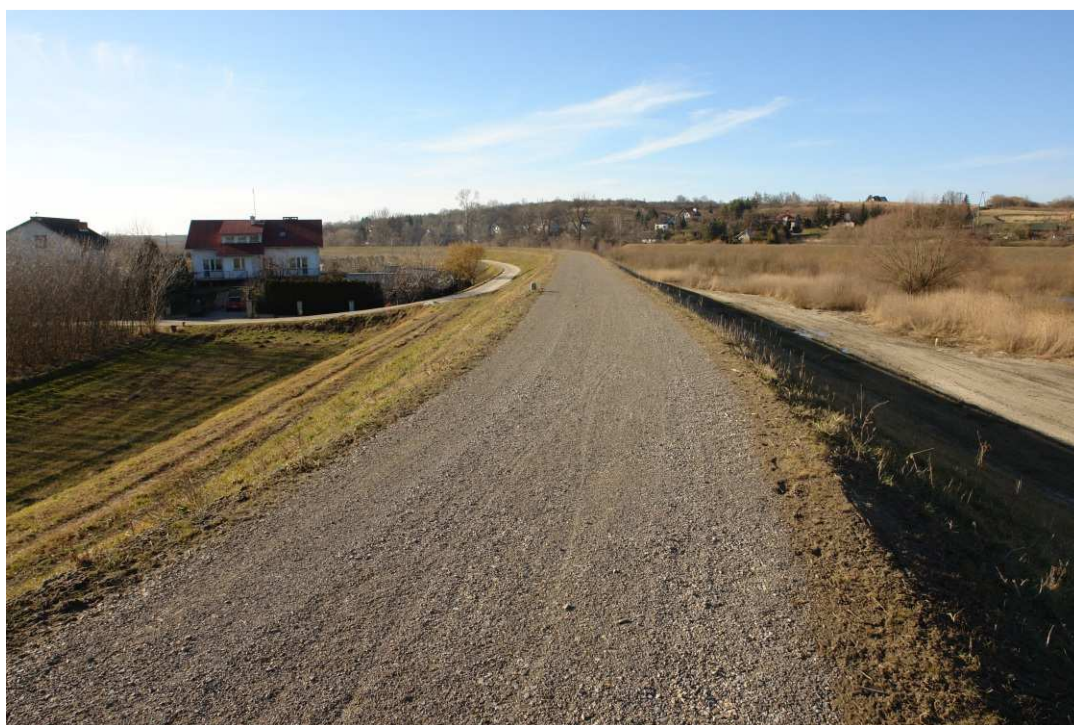
Foto. 49. Stan terenu budowy w ostatnim kwartale okresu realizacji robót na Zadaniu 4 – brzegi Koprzywianki powyżej mostu na drodze Sandomierz-Zawiszełcze, stan w trzeciej dekadzie lutego 2022 r. (widok w górę rzeki).