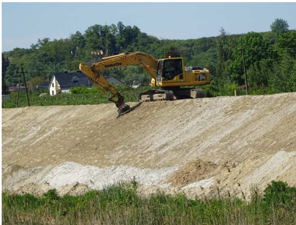
Foto. 35. Zagęszczanie korpusu wału przeciwpowodziowego – lewy brzeg Koprzywianki powyżej mostu na drodze Żłota-Zawierbie, stan w trzeciej dekadzie maja 2020 r. (widok w górę rzeki).