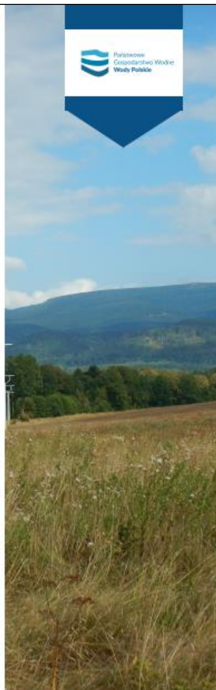
Fig. 6. Information poster inviting to public consultations conc. the draft Annex no. 3 to the EMP.