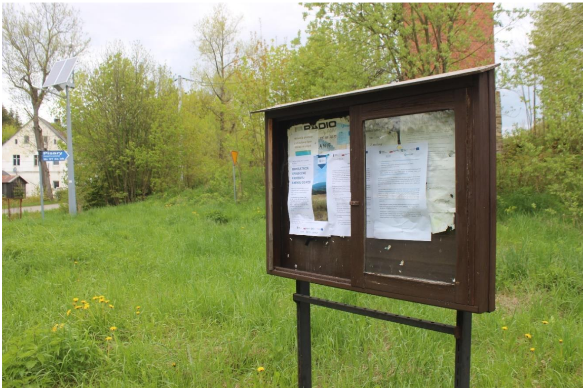
Phot. 4. Information poster conc. the draft Annex no. 3 to the EMP for Contract 2A.1/1 displayed in Pisary.