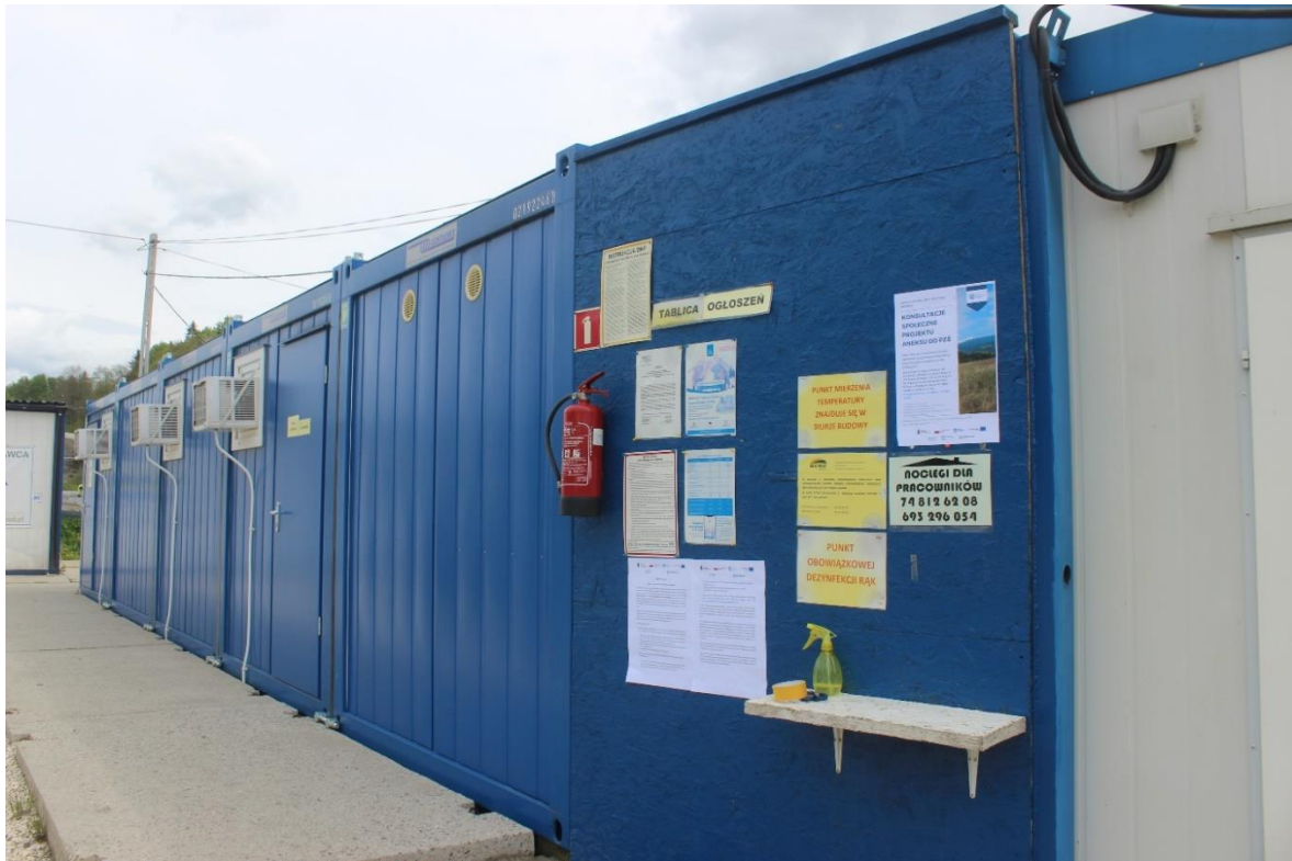
Phot. 3. Information poster conc. the draft Annex no. 3 to the EMP for Contract 2A.1/1 displayed in Boboszków.