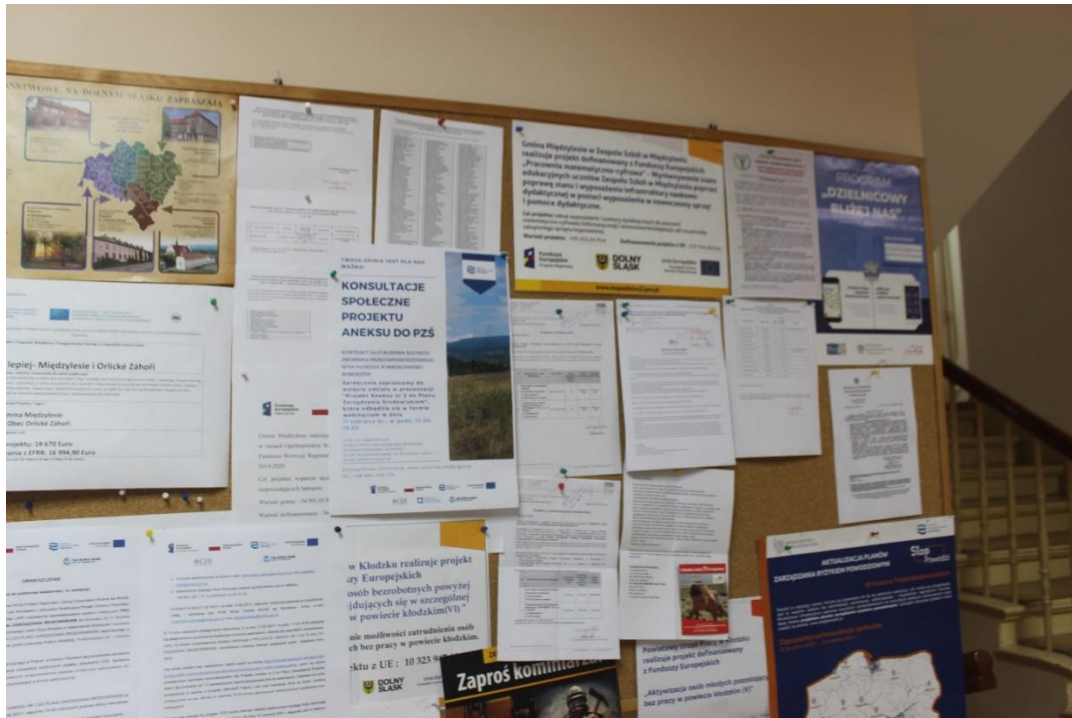
Phot. 1. Information poster conc. the draft Annex no. 3 to the EMP for Contract 2A.1/1 displayed on the notice board in the Międzyzlesie Town and Commune Office.