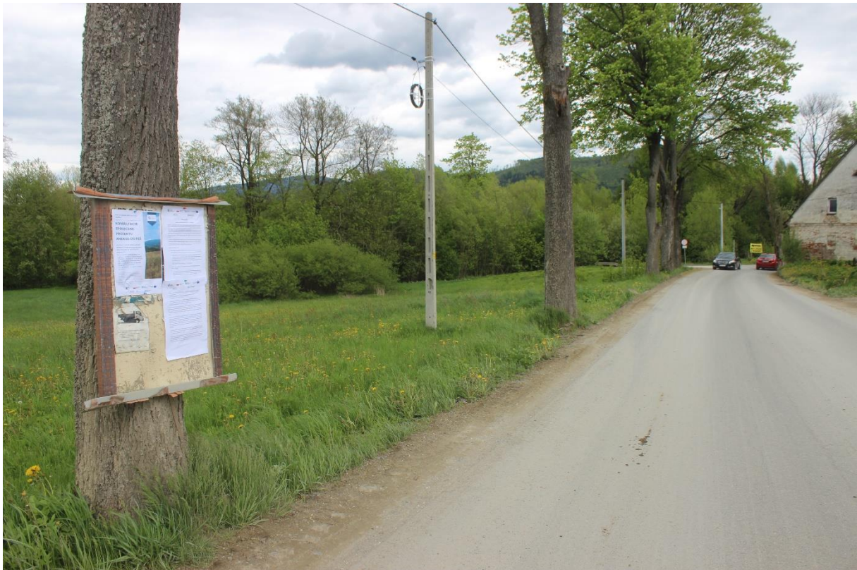
Phot. 5. Information poster conc. the draft Annex no. 3 to the EMP for Contract 2A.1/1 displayed in Dolnik.