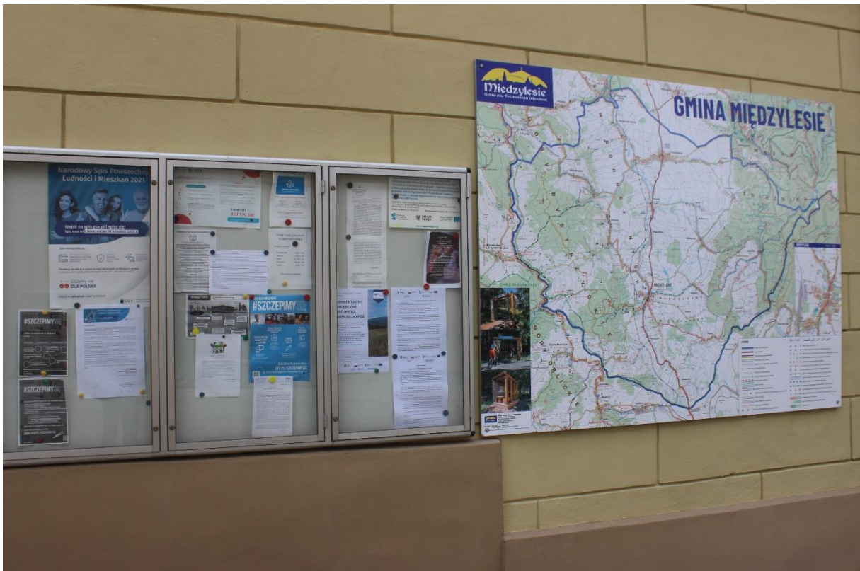
Phot. 6. Information poster conc. the draft Annex no. 3 to the EMP for Contract 2A.1/1 displayed in Międzyzlesie.