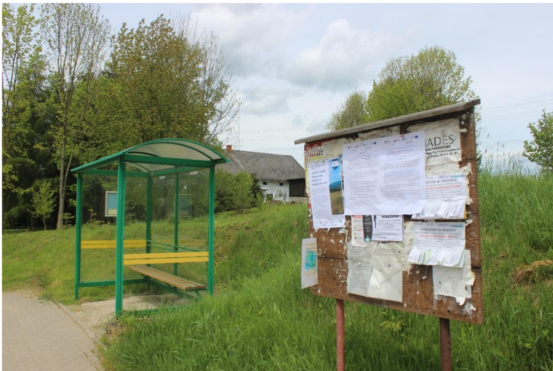
Phot. 2. Information poster conc. the draft Annex no. 3 to the EMP for Contract 2A.1/1 displayed in the town of Boboszków.