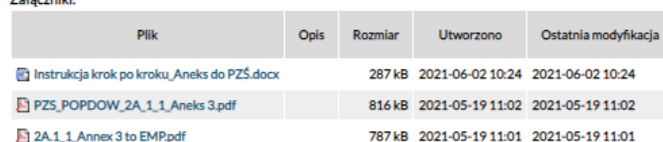
Fig. 1. Announcement on public consultations of the draft Annex no. 3 to the EMP with downloadable materials, posted at the website of SWH PW RZGW in Wrocław.