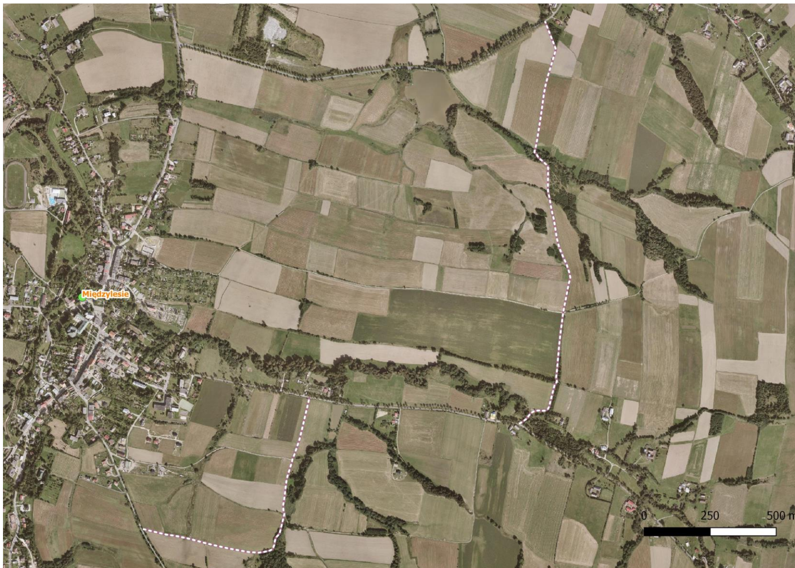
Ryc. 1 Odcinki remontowanych dróg w przebiegu alternatywnej trasy dojazdu do Terenu Budowy Kontraktu na roboty 2A.1/1.