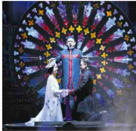
• Romeo i Julia w szczecińskiej operze.

– Zbudowaliśmy dwa światy – co scenicznie jest czytelne nie tylko w kostiumie, ale i jakości ruchu. Zatrudniliśmy dwoje choreografów, po to by różny Kapuletich i Montekich różniły się każdym calu. Tancerze są tacy, jakimi mają być Romeo i Julia. Wzorem i modelem tożsamości rodziny. Głównym tematem inscenizacji jest to, jak nasi bohaterowie się odnajdują w tych światach. Teatr szekspirowski był teatrem ulicznym, pełnym czytelných sym-