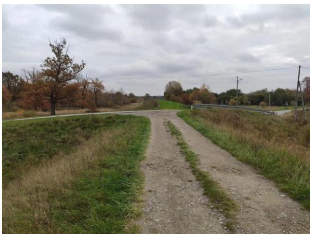
Zdjęcie nr 15: Koniec inwestycji – droga Orlińska – Gorzyce.

Część II. Zdjęcia wału prawego rzeki Łęg w km 0+000 - 5+236.