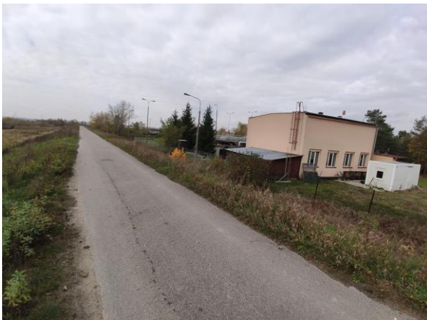
Zdjęcie nr 6: Budynki oczyszczalni.