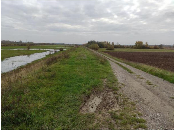
Zdjęcie nr 9: Wody powierzchniowe w międzywale, wał, droga przy wale od strony odpowietrznej.