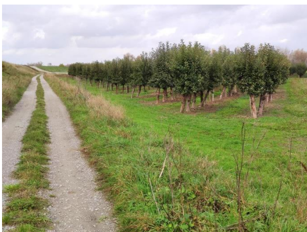
Zdjęcie nr 25: Sady owocowe przy drodze przywałowej.