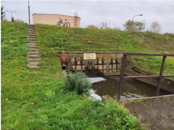
Zdjęcie nr 8: Wylot wód opadowych, w oddali budynek oczyszczalni.