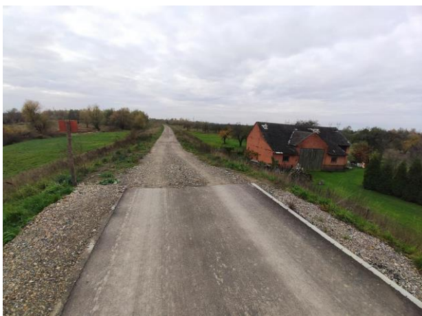
Zdjęcie nr 1: Początek wałów lewostronnych, budynek gospodarczy.

Zdjęcia od km 0+082 (od rzeki Wisły) do mostu Orliśka – Gorzyce)