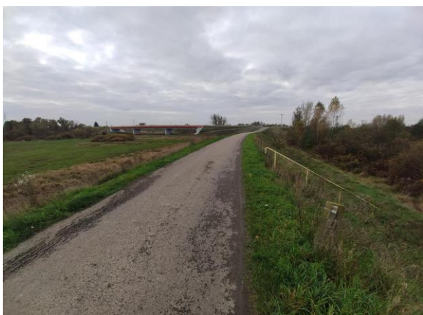
Zdjęcie nr 5: Przepust, zasuwa na cieku wodnym przebiegającym przez wał.