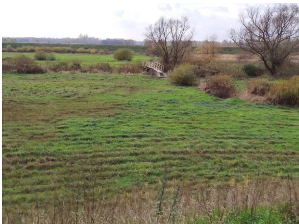
Zdjęcie nr 11: Widok na mostek dla pieszych z wałów prawostronnych.