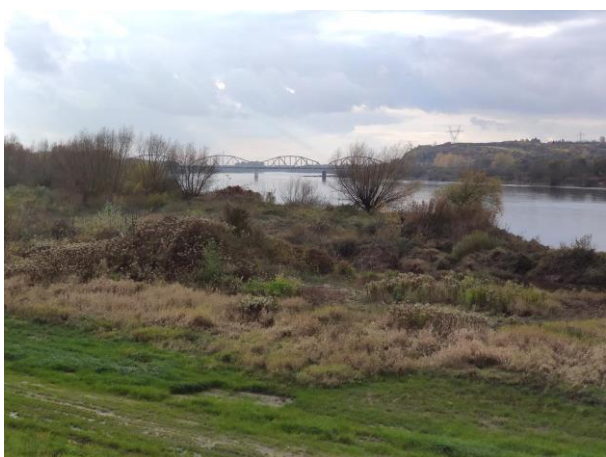
Zdjęcie nr 4: Most kolejowy na Wiśle, znajdujący się blisko ujścia rzeki Łęg.

Stan obszaru inwestycji na 30 listopada 2020r.