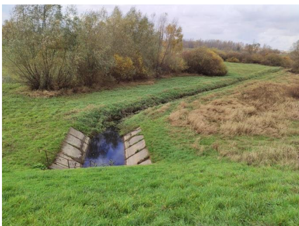
Zdjęcie nr 19: Odpływ z przepustu od strony międzywała ( ul. Podwale).