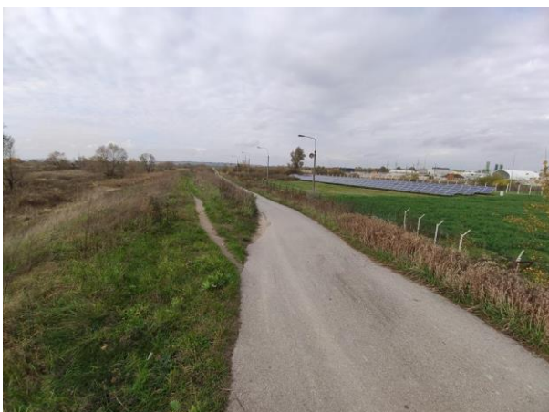
Zdjęcie nr 10: Zjazd drogi asfaltowej z wałów, w oddali ferma fotowoltaiki.