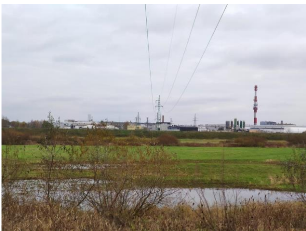
Zdjęcie nr 11: Widok na międzywale, rz. Łęg, tereny przemysłowe w oddali.