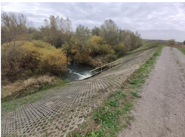
Zdjęcie nr 8: Ujście wód z przepompowni PGW WP do międzywala.