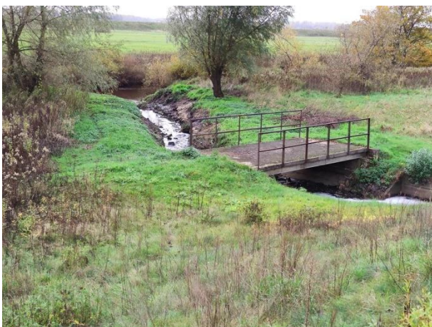
Zdjęcie nr 7: Odptyw wód z oczyszczalni, mostek.