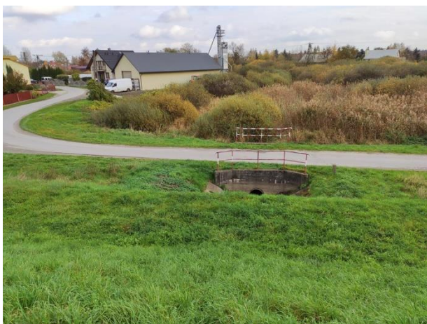
Zdjęcie nr 18: Przepust pod ul. Podwale .