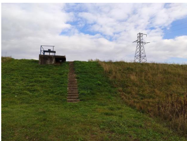
Zdjęcie nr 24: Przepust przez wał, zasuwa, linia WN.