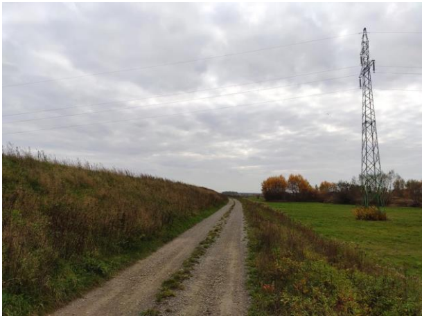
Zdjęcie nr 10: Wał, droga szutrowa, linia WN, tereny przyległe.