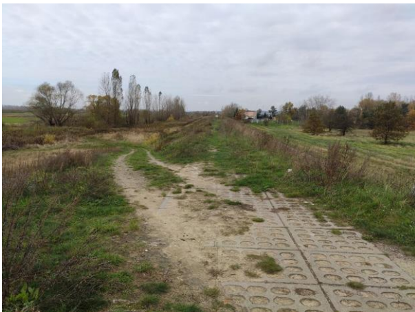
Zdjęcie nr 4: Wzmocnienie przejazdu w poprzek przez wał.