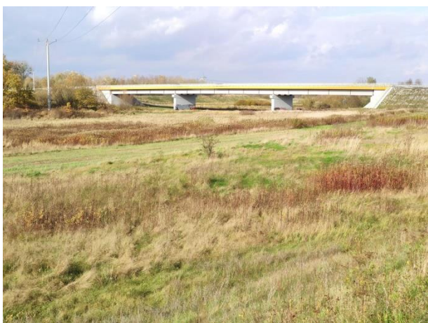
Zdjęcie nr 15: Widok zwału prawostronnego na most DK 77, linia SN.