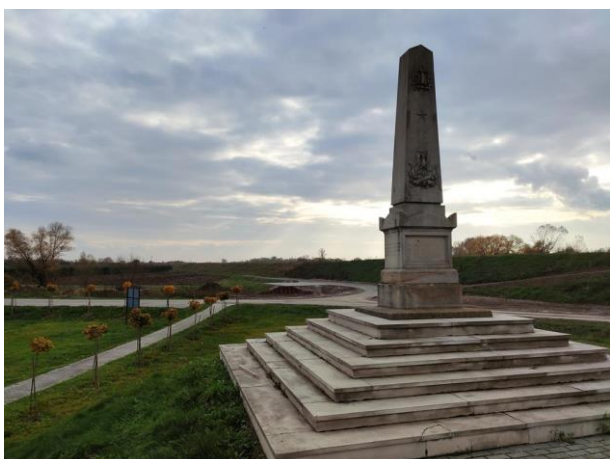
Zdjęcie nr 1: Widok na Obelisk upamiętniający Bitwę Pod Wrzawami, w oddali obszar inwestycji wał prawostronny.