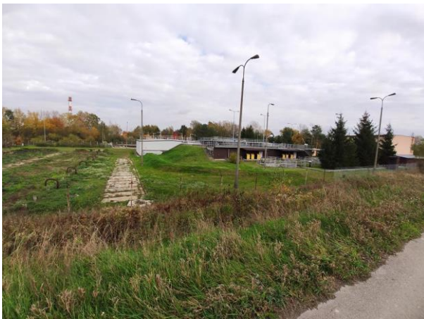
Zdjęcie nr 9: Obiekty oczyszczalni ścieków.