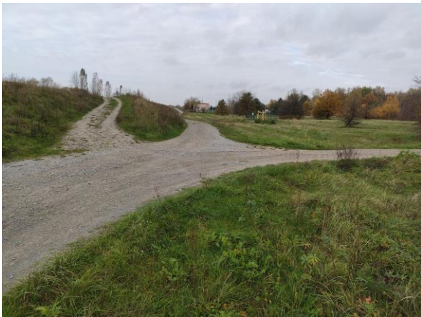
Zdjęcie nr 3: Skrzyżowanie dróg z wjazdem na wały, w oddali stacja redukcji gazu.