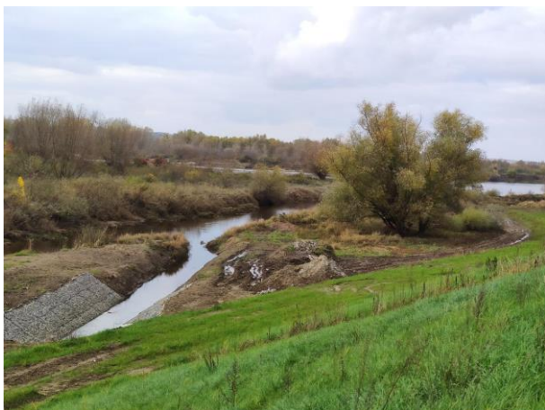
Zdjęcie nr 3: Ujście rzeki Łęg do Wisły.