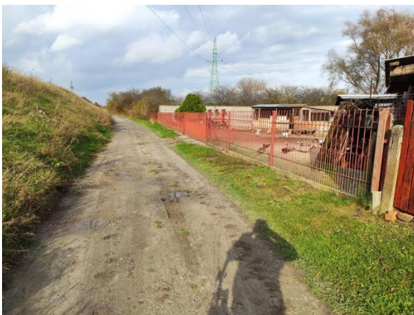
Zdjęcie nr 22: Droga przy wale prawym, ogrodzenia do przebudowy, w oddali słup sieci WN.