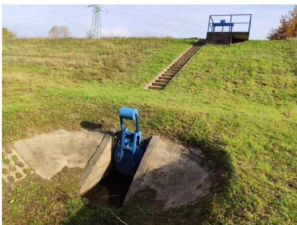
Zdjęcie nr 13: Przepust od strony międzywala, zasuwą, w oddali linia WN do przebudowy.