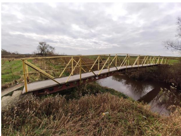
Zdjęcie nr 13: Mostek dla pieszych na rz. Łęg.