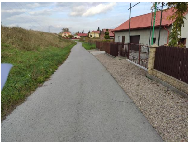
Zdjęcie nr 17: ul. Podwale.