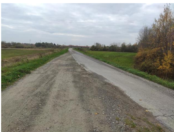
Zdjęcie nr 4: Skrzyżowanie – dr. szutrowa i dr. asfaltowa, przebiegające górą wałów.