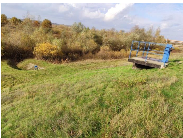
Zdjęcie nr 12: Przepust przez wał, zasuwą.