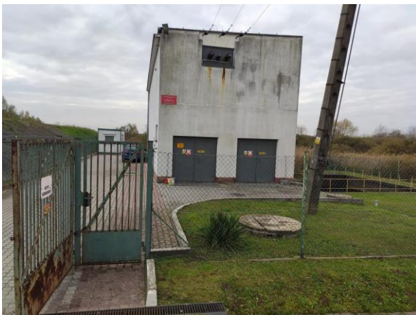
Zdjęcie nr 7: Przepompownia PGW WP, ciek Strug.