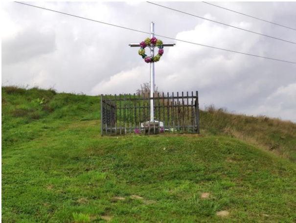
Zdjęcie nr 20: Krzyż w obszarze inwestycji.