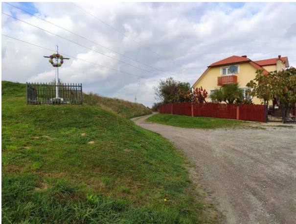
Zdjęcie nr 21: Krzyż, droga, zabudowania blisko inwestycji.