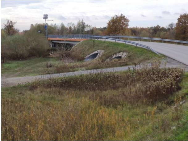
Zdjęcie nr 2: Widok na Most oraz przepusty w międzywalu.