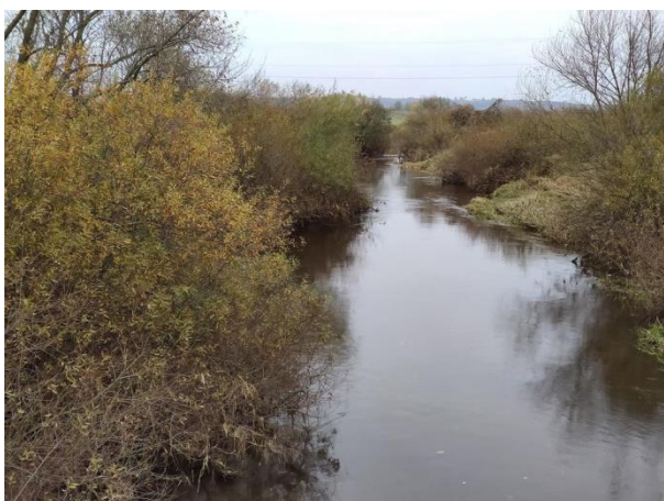
Zdjęcie nr 14: Koryto rzeki Łęg.