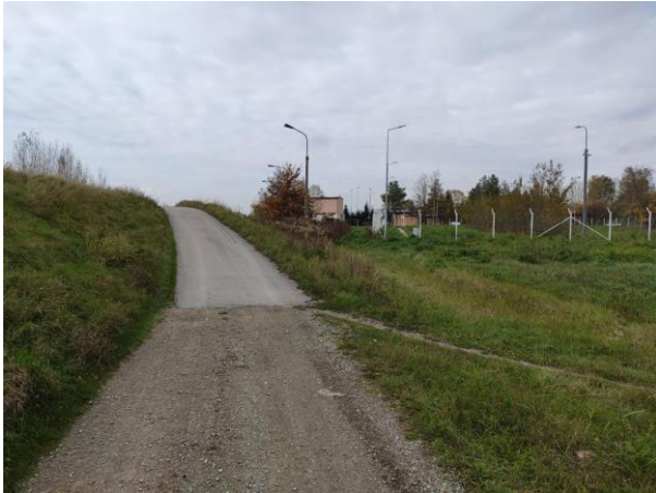
Zdjęcie nr 5: Wjazd na wał przy oczyszczalni (nawierzchnia asfaltowa).