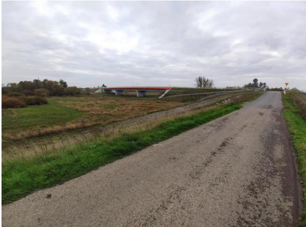
Zdjęcie nr 6: Widok na most nad rz. Łęg, DK 77 (ul. Sandomierska).