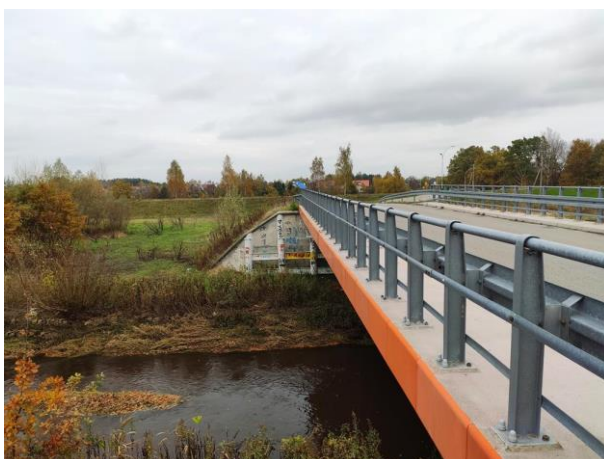
Zdjęcie nr 1: Most nad rz. Łęg, dr. Orlińska – Gorzyce.

Zdjęcia od km 5+236 (od mostu Orlińska – Gorzyce do Wisły)