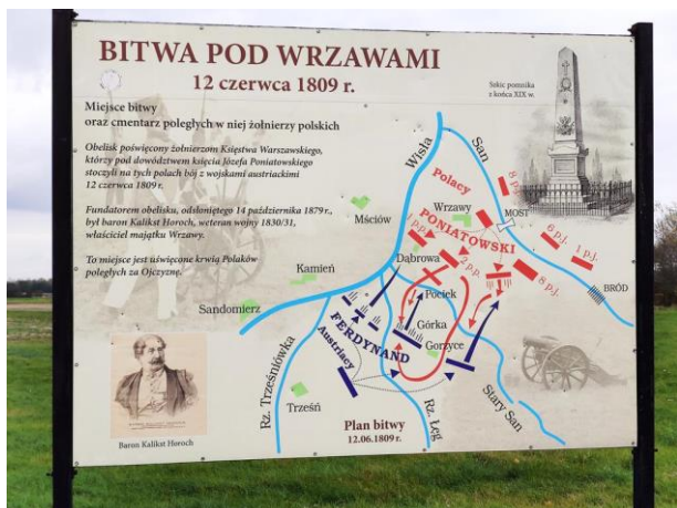
Zdjęcie nr 2: Tablica informacyjna.