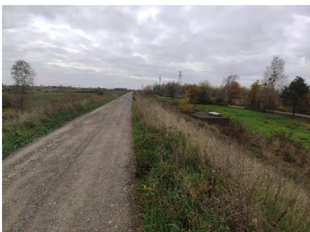
Zdjęcie nr 2: Fundamenty do likwidacji.