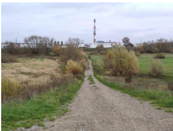
Zdjęcie nr 12: Droga w międzywalu, dojście do mostku dla pieszych.