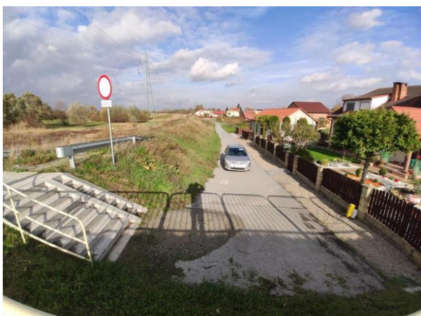
Zdjęcie nr 16: Widok z DK 77, Wał prawostronny, schody zwału do ul. Podwale, Zabudowania w sąsiedztwie istniejących wałów.