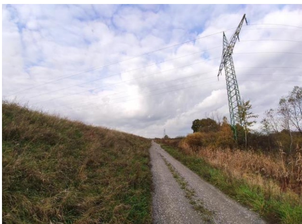
Zdjęcie nr 23: Wał prawy, droga przy wale, słup linii WN przechodzącej przez międzywale rzeki Łęg.