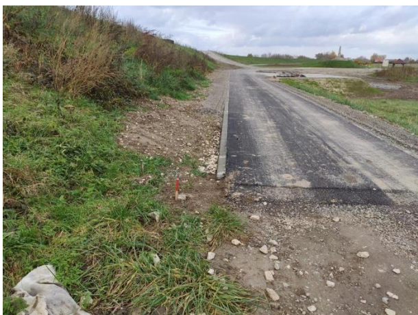
Zdjęcie nr 26: Początek inwestycji przy wale prawostronnym (przy rz. Wiśle).