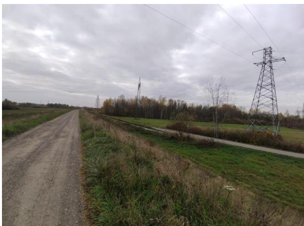
Zdjęcie nr 3: Sieć linii WN przechodząca przez t. inwestycji.