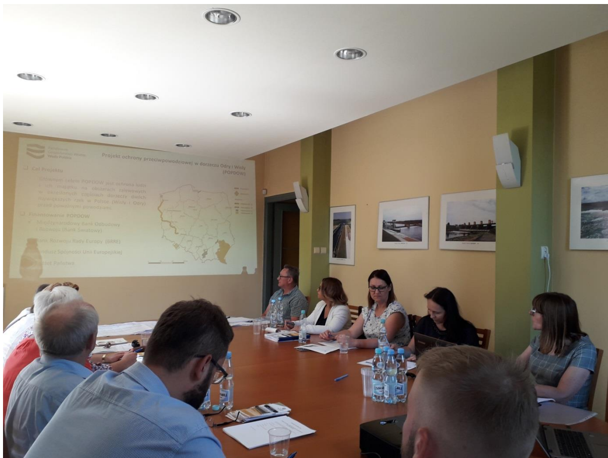
Zdjęcie 14. Konsultacje społeczne projektu dokumentu PPNiP w siedzibie PGW WP RZGW w Krakowie – Nadzór Wodny w Krakowie, gmina Liszki, 4 lipca 2019 r.