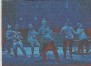
Twórcy spektaklu „Salto w tył” odbiorą Nagrodę im. Wyspiańskiego