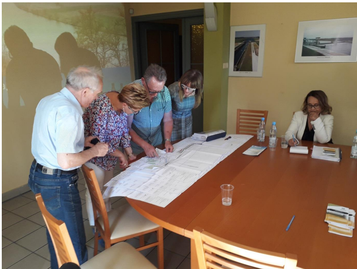
Zdjęcie 15. Konsultacje społeczne projektu dokumentu PPNiP w siedzibie PGW WP RZGW w Krakowie – Nadzór Wodny w Krakowie, gmina Liszki, 4 lipca 2019 r.