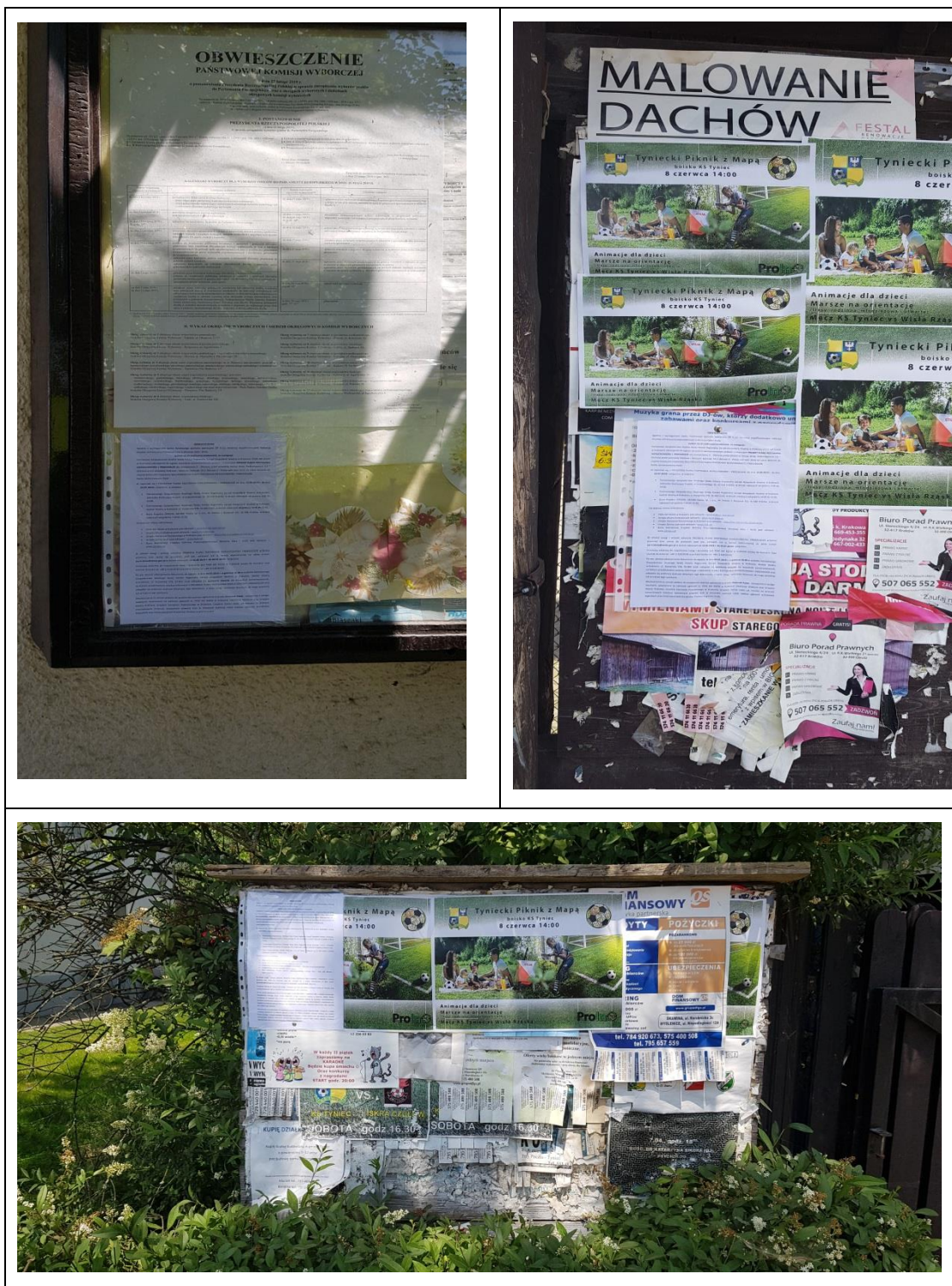
Zdjęcie 9-12. Obwieszczenie o konsultacjach społecznych Projektu PPNiP wywieszone na tablicach ogłoszeń w miejscach realizacji robót (więcej zdjęć dostępnych w archiwach PGW WP RZGW w Krakowie).