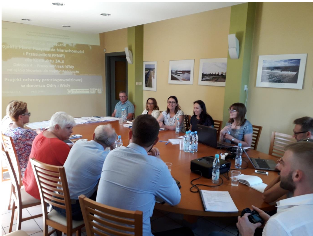
Zdjęcie 13. Konsultacje społeczne projektu dokumentu PPNiP w siedzibie PGW WP RZGW w Krakowie – Nadzór Wodny w Krakowie, gmina Liszki, 4 lipca 2019 r.