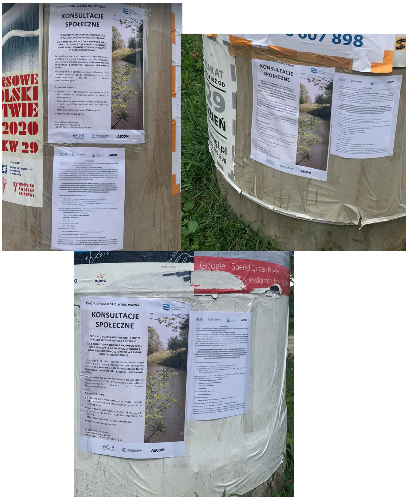
Zdjęcia 7- 11 Przykładowe obwieszczenia o konsultacjach społecznych i plakaty informacyjne Projektu PPNiP wywieszone na tablicach ogłoszeń w miejscach realizacji robót (więcej zdjęć dostępnych w archiwach Konsultanta i PGW WP RZGW w Krakowie).