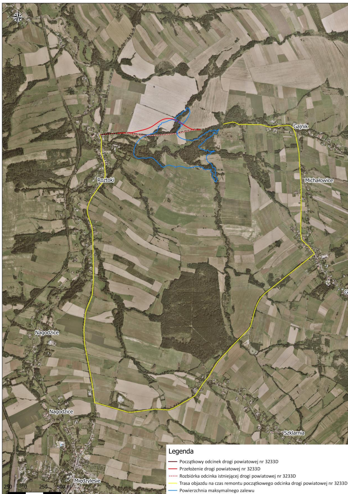
Ryc. 2 Schemat tymczasowej organizacji ruchu na czas remontu odcinka drogi powiatowej nr 3233D.