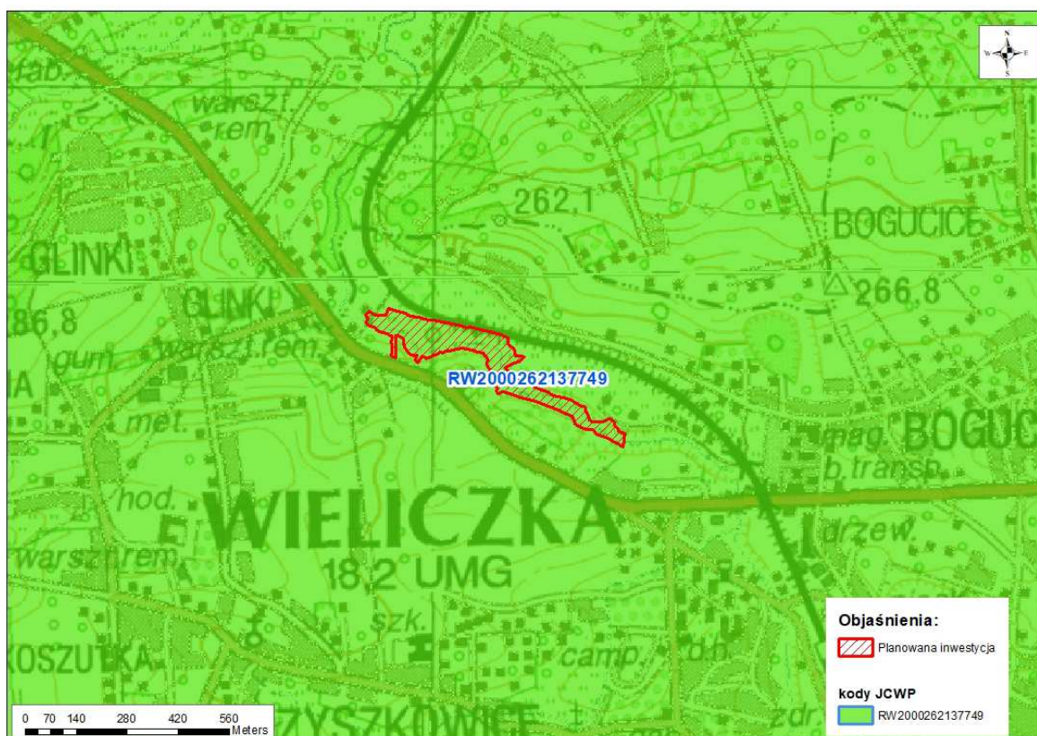
Rys. 3. Lokalizacja Kontraktu na roboty 3A.2/4 na tle JCWP

Lokalizację Kontraktu na roboty na tle JCWP przedstawiono na rysunku poniżej (Rys. 3).