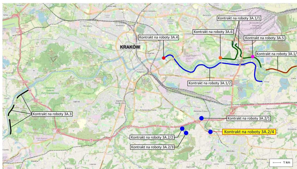
Rys. 1. Lokalizacja Kontraktu na roboty 3A.2/4 na tle lokalizacji pozostałych Kontraktów na roboty Podkomponentu 3A POPDOW

Lokalizację Kontraktu na roboty 3A.2/4 zaprezentowano na zamieszczonym poniżej rysunku (Rys. 1) oraz w Załączniku 5 do niniejszego PZŚ – Mapa lokalizacji Kontraktu.