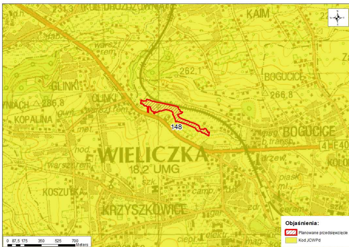
Rys. 4. Lokalizacja Kontraktu na roboty 3A.2/4 na tle JCWPd

Lokalizację Kontraktu na roboty na tle JCWPd przedstawiono na rysunku poniżej (Rys. 4).